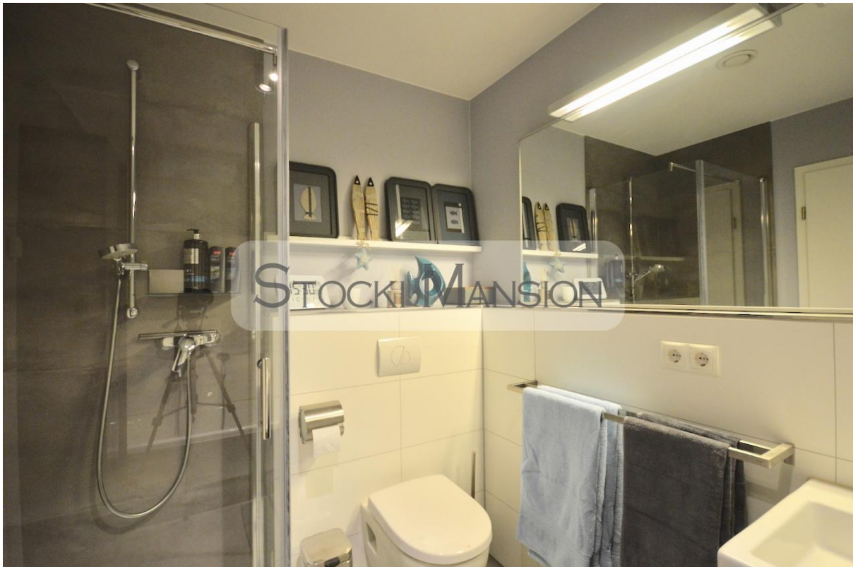
Stilvolles Bad mit Dusche