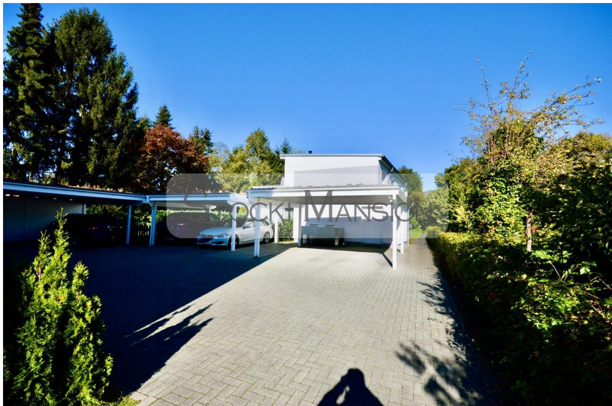
Hinterhof mit Stellplatzanlage