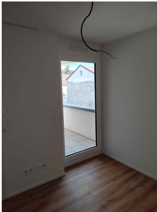
Zugang Loggia vom Schlafzimmer