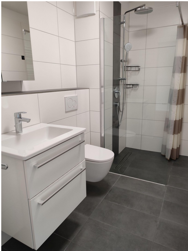
Badezimmer mit Rainbowdusche