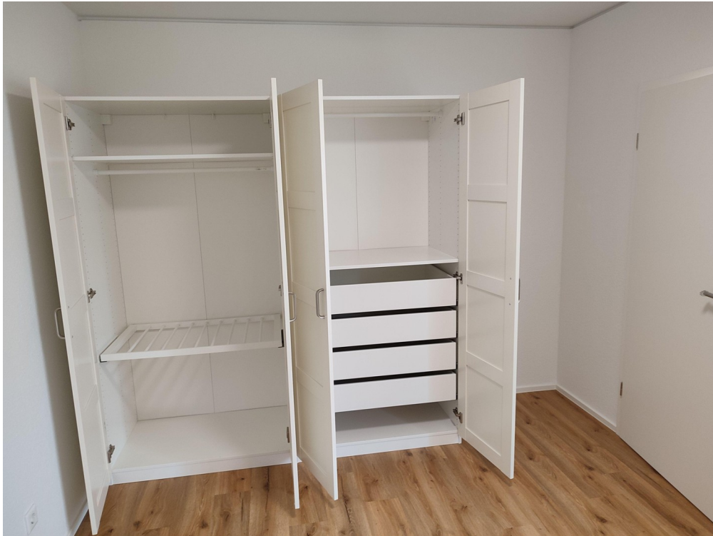
Schrank im Schlafzimmer