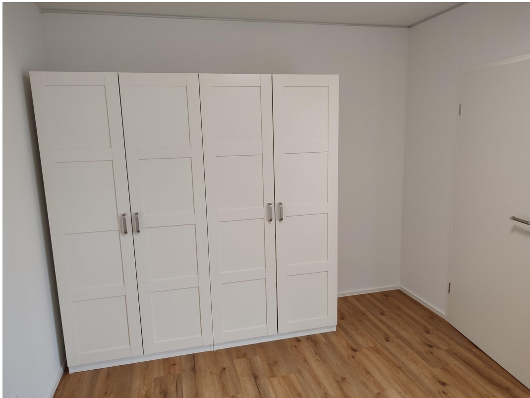
Schrank im Schlafzimmer