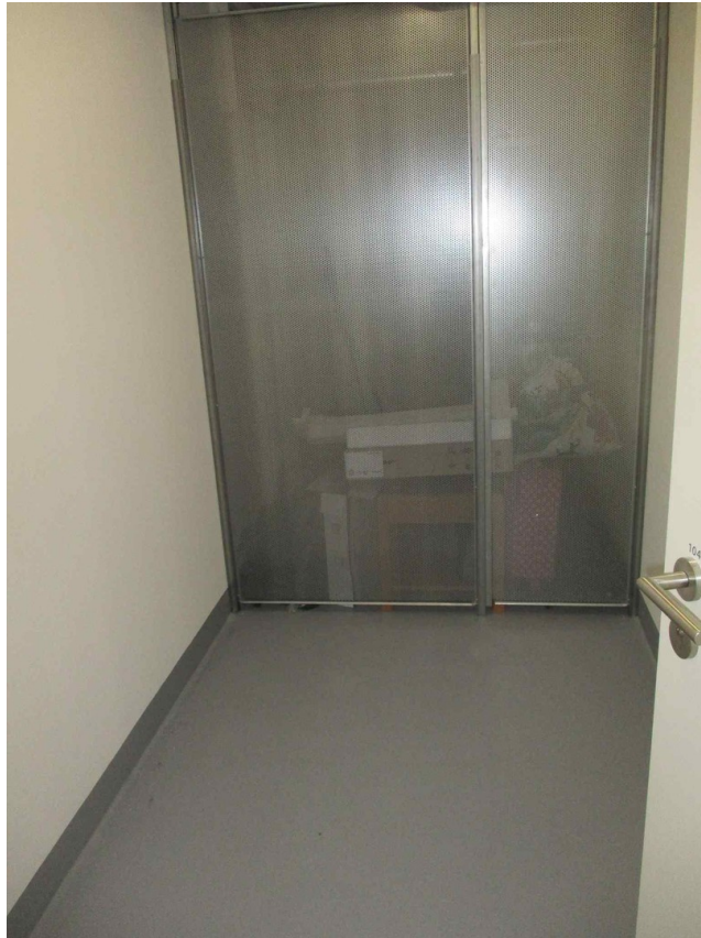
Abstellraum gegenüber Wg.