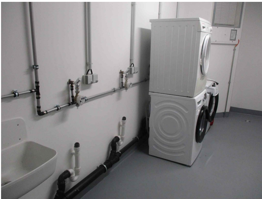
Waschraum auf gleicher Etage