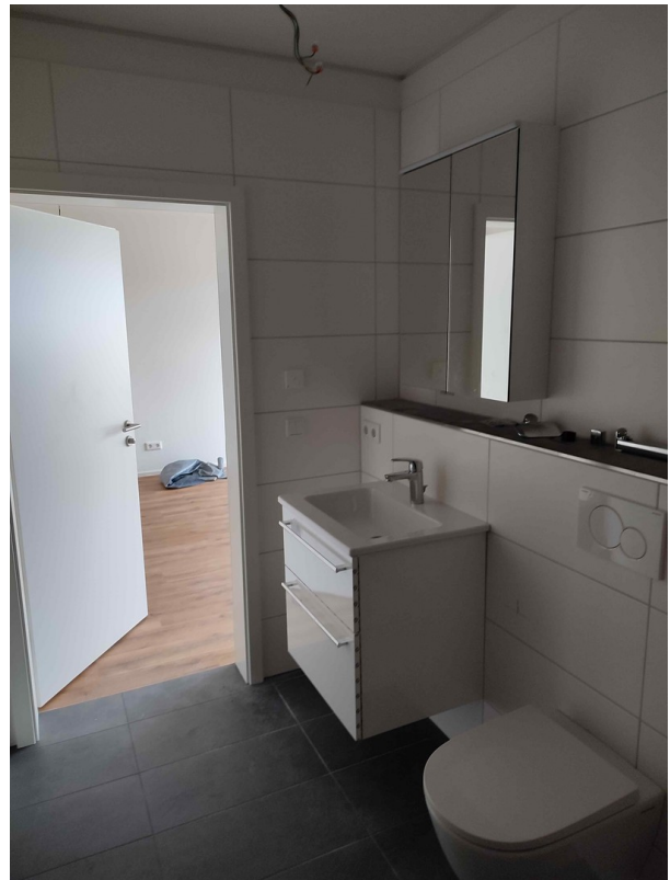
Spiegelschrank im Badezimmer