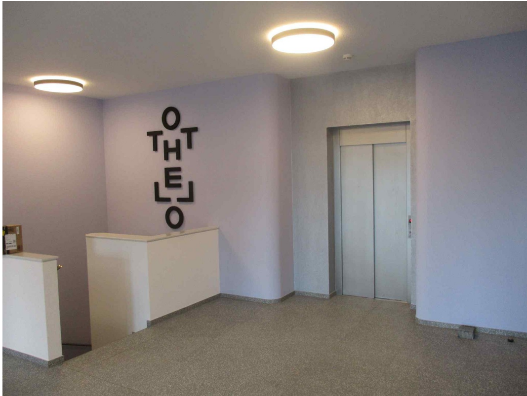
Zugang über Aufzug