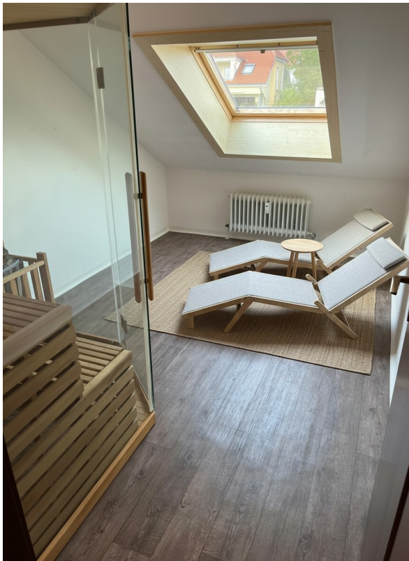
Kinderzimmer 2 / Saunazimmer