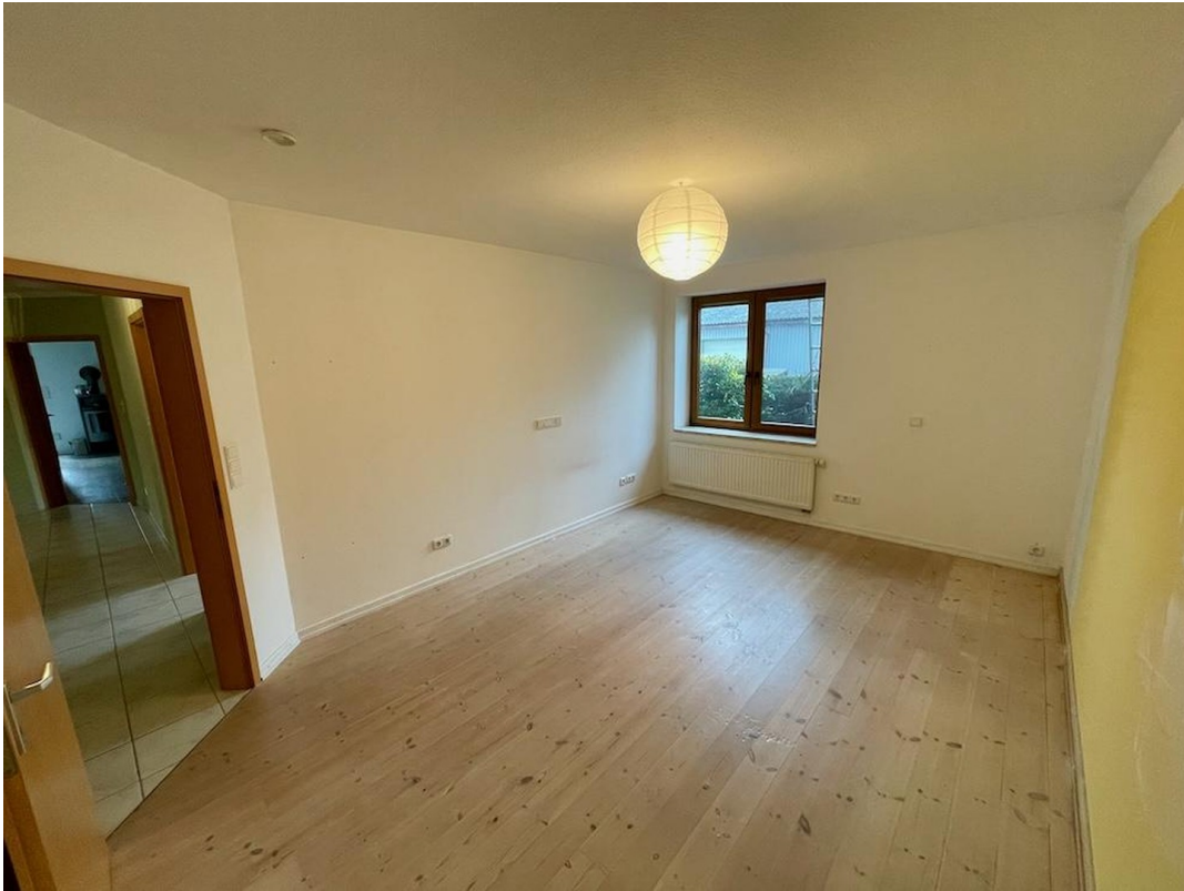
Kind 1 lt. Grundriss