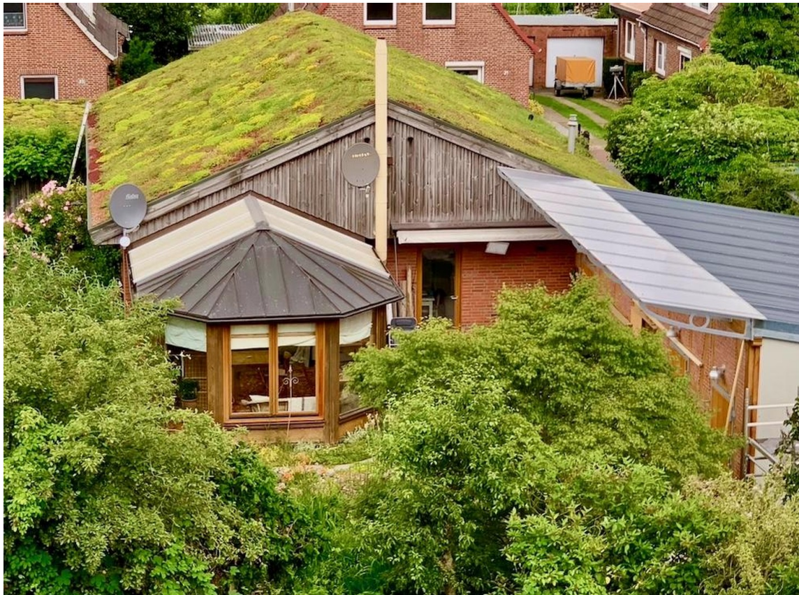
von Süden im Sommer