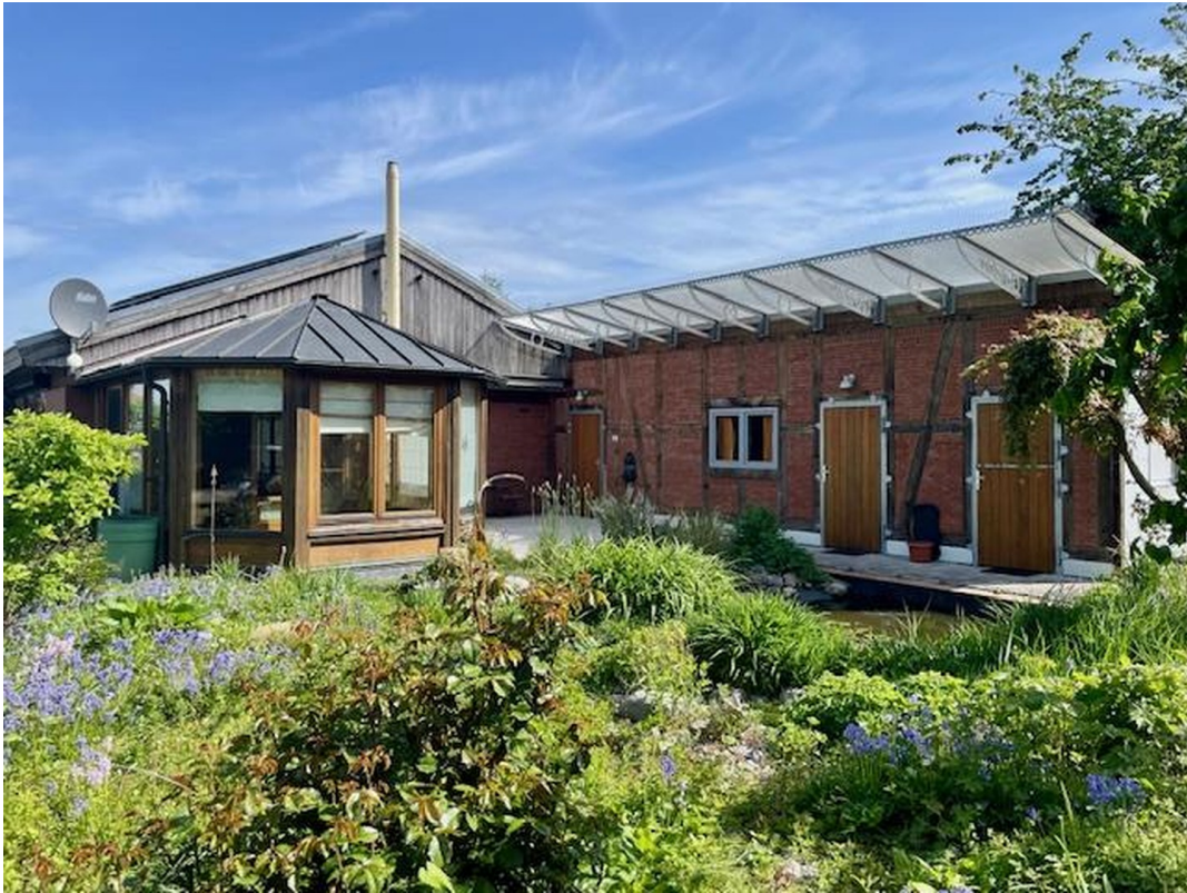
von Süden im Mai