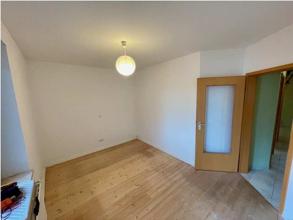
Kind 2 lt. Grundriss