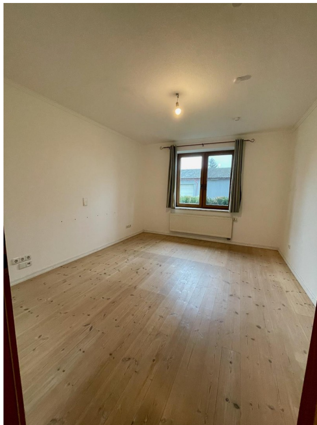
Schlafzi. lt. Grundriss