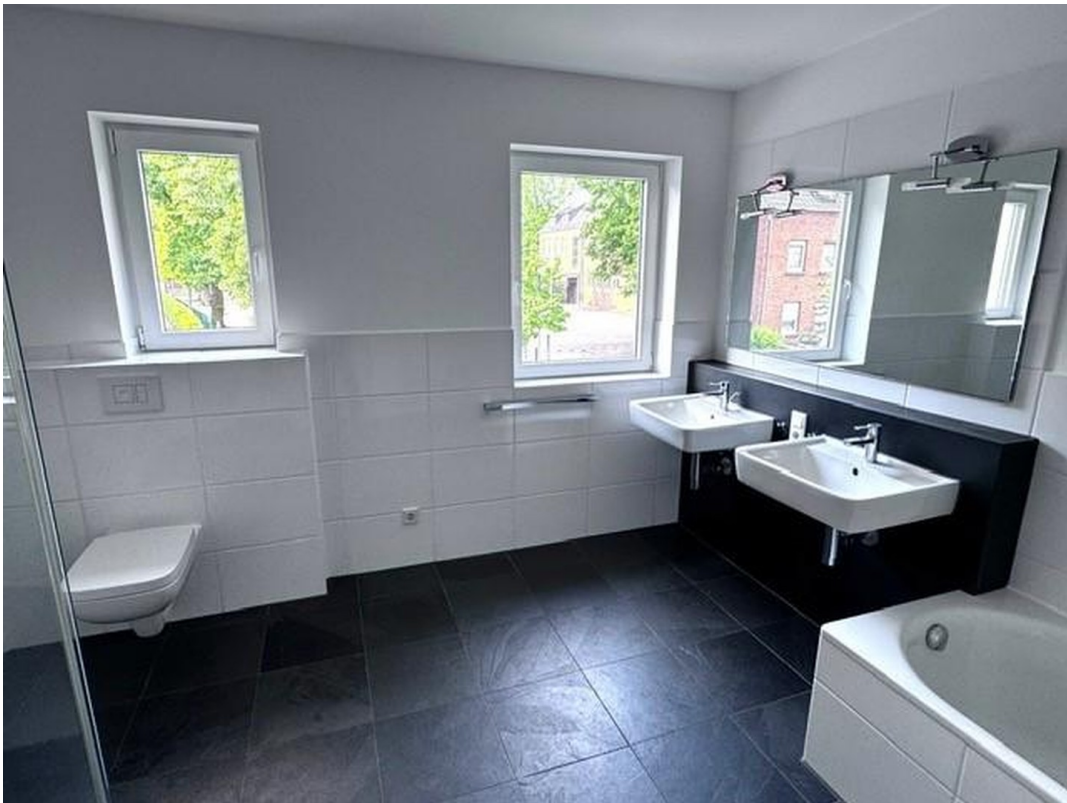
Badezimmer 1. OG