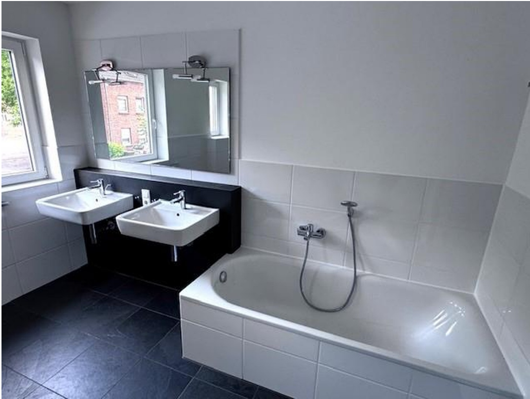
Badezimmer 1. OG