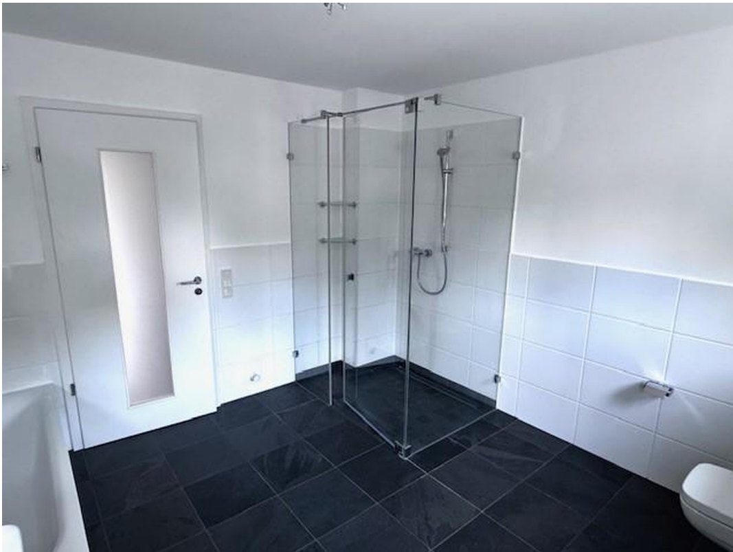
Badezimmer 1. OG