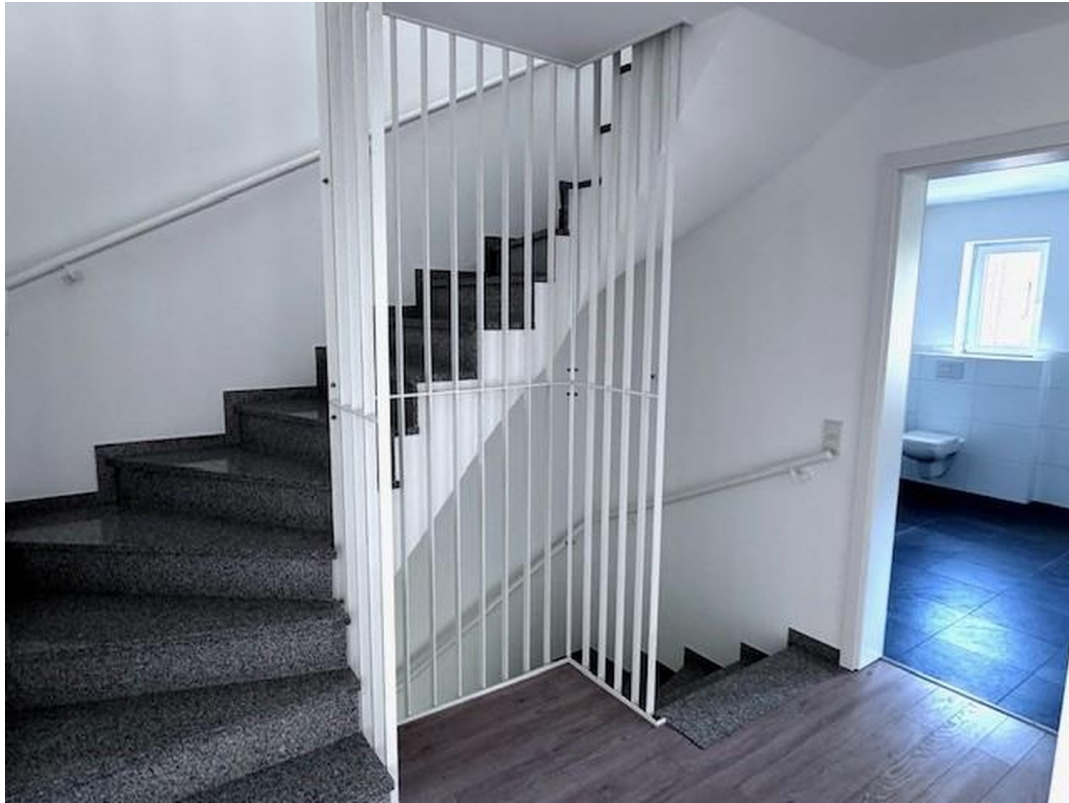
Flur 1. OG