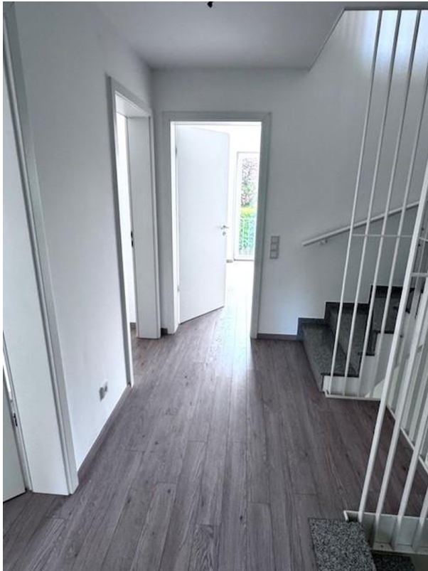
Flur 1. OG