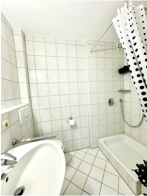
Dusche im BZ