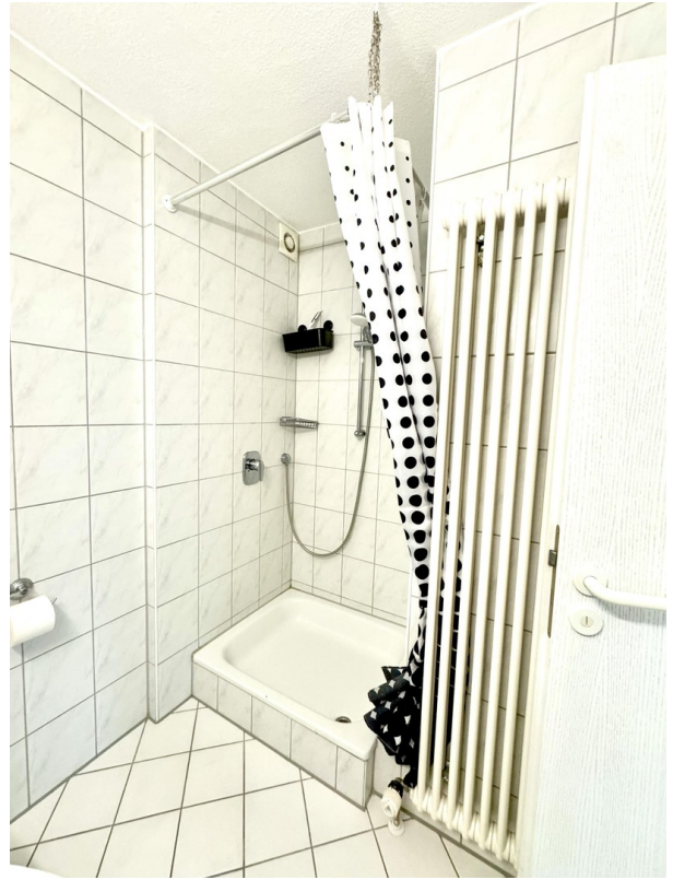
Duschecke im BZ