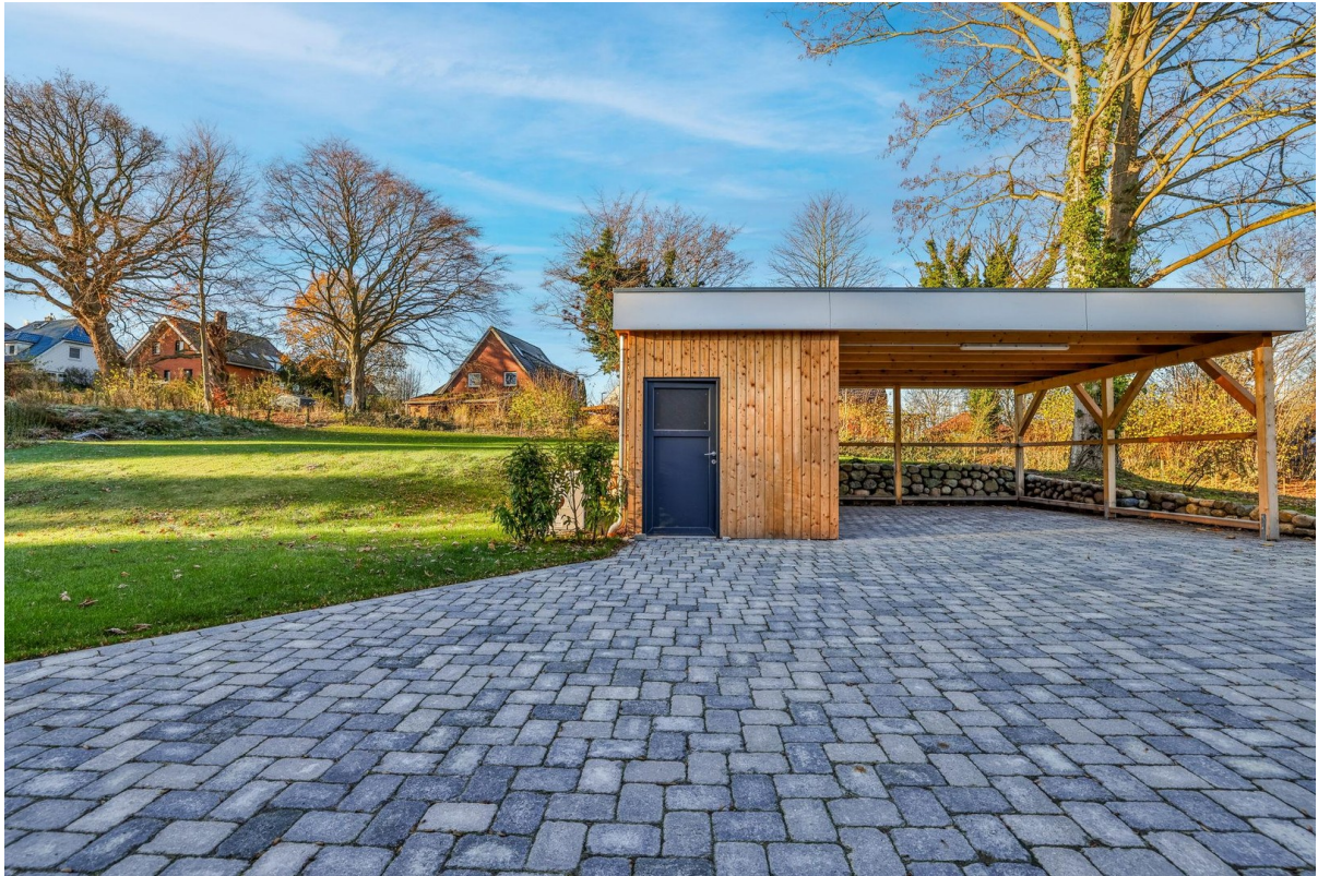
Carport mit Abstellraum