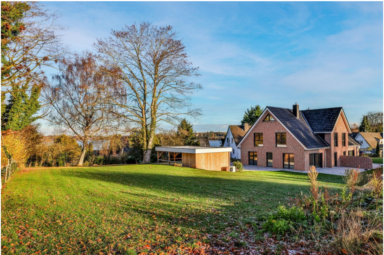
Garten mit Seeblick