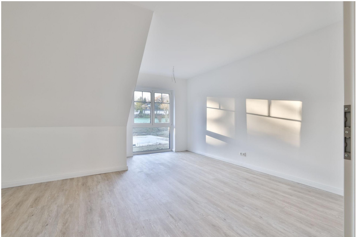
Zimmer 1 OG