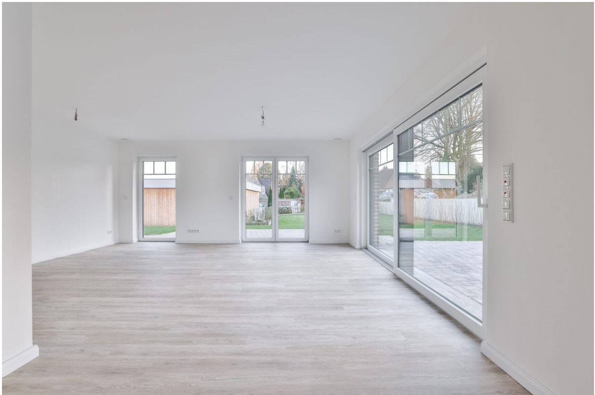
Wohn- / Esszimmer