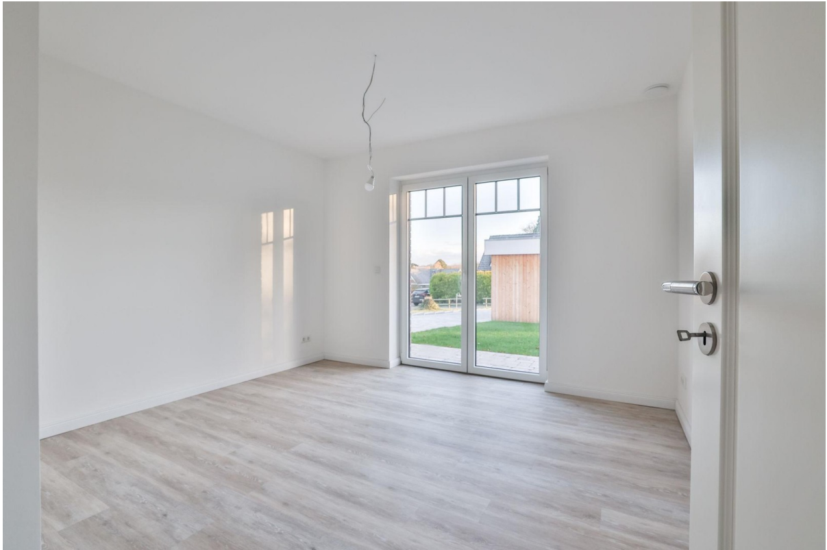
Gästezimmer / Büro