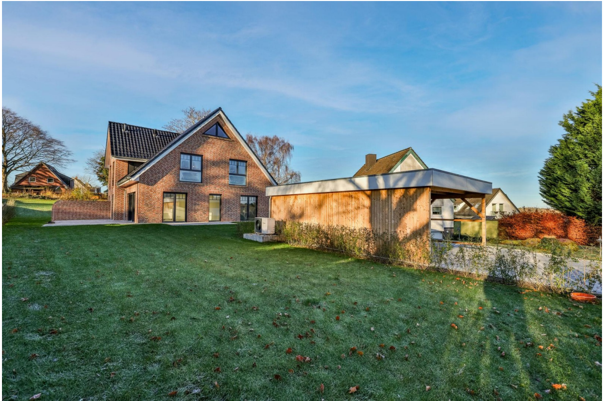
Garten vorderes Haus