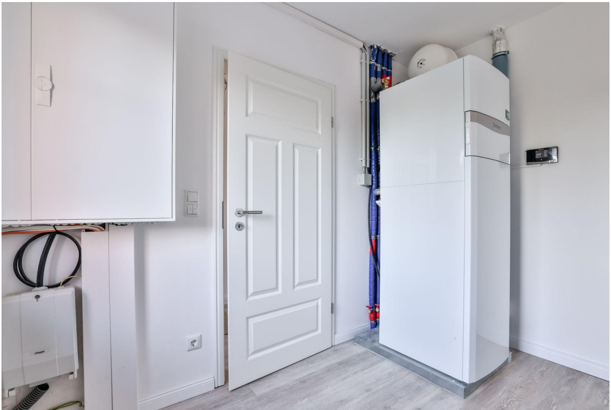
Hauswirtschafts- / Technikraum