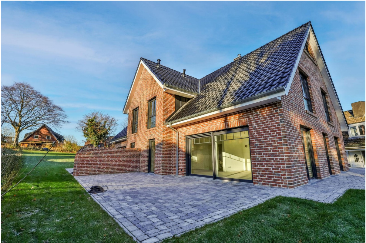
Terrasse vorderes Haus