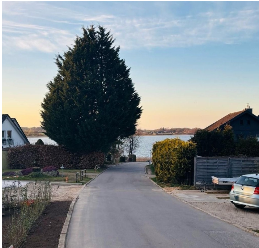
Straße mit Seeblick