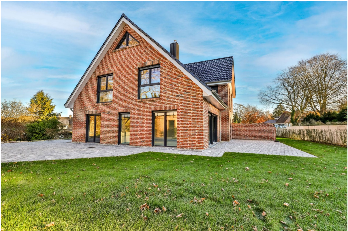
Hausansicht hinteres Haus