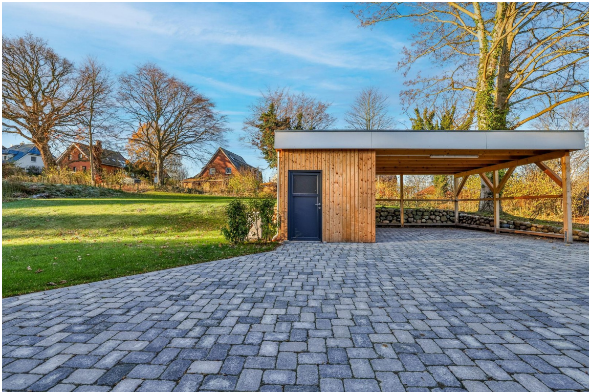
Carport mit Abstellraum