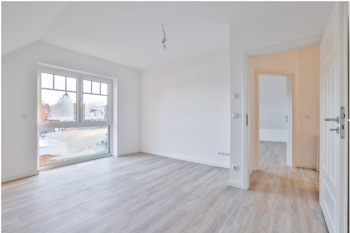
Zimmer 2 OG