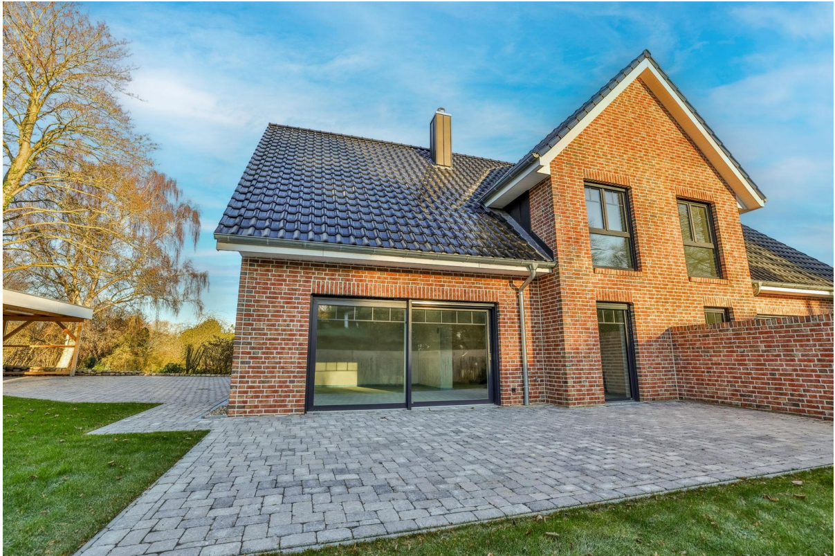
Terrasse hinteres Haus