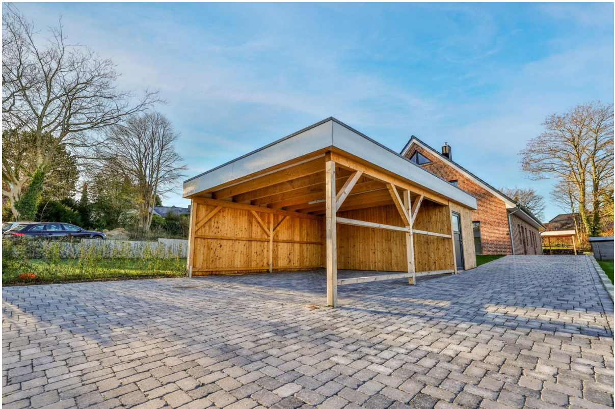
Carport vorderes Haus