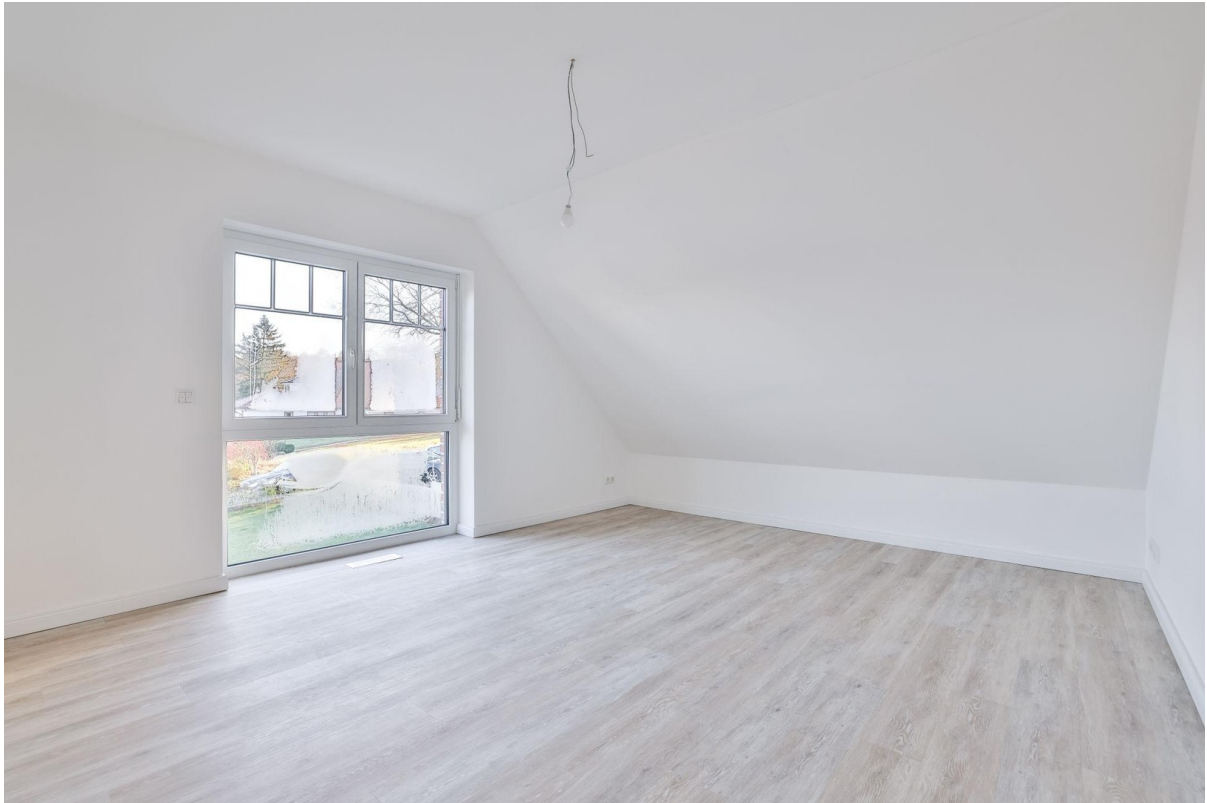
Zimmer 3 OG