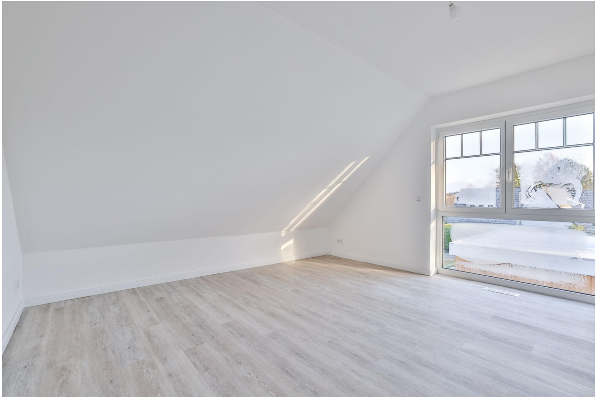
Zimmer 2 OG