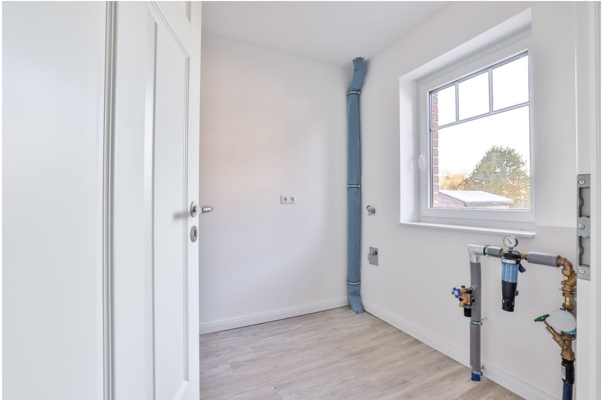
Hauswirtschafts- / Technikraum