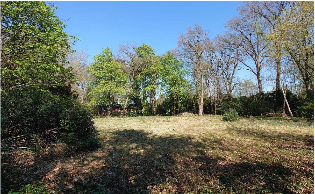
Blick von Südwest