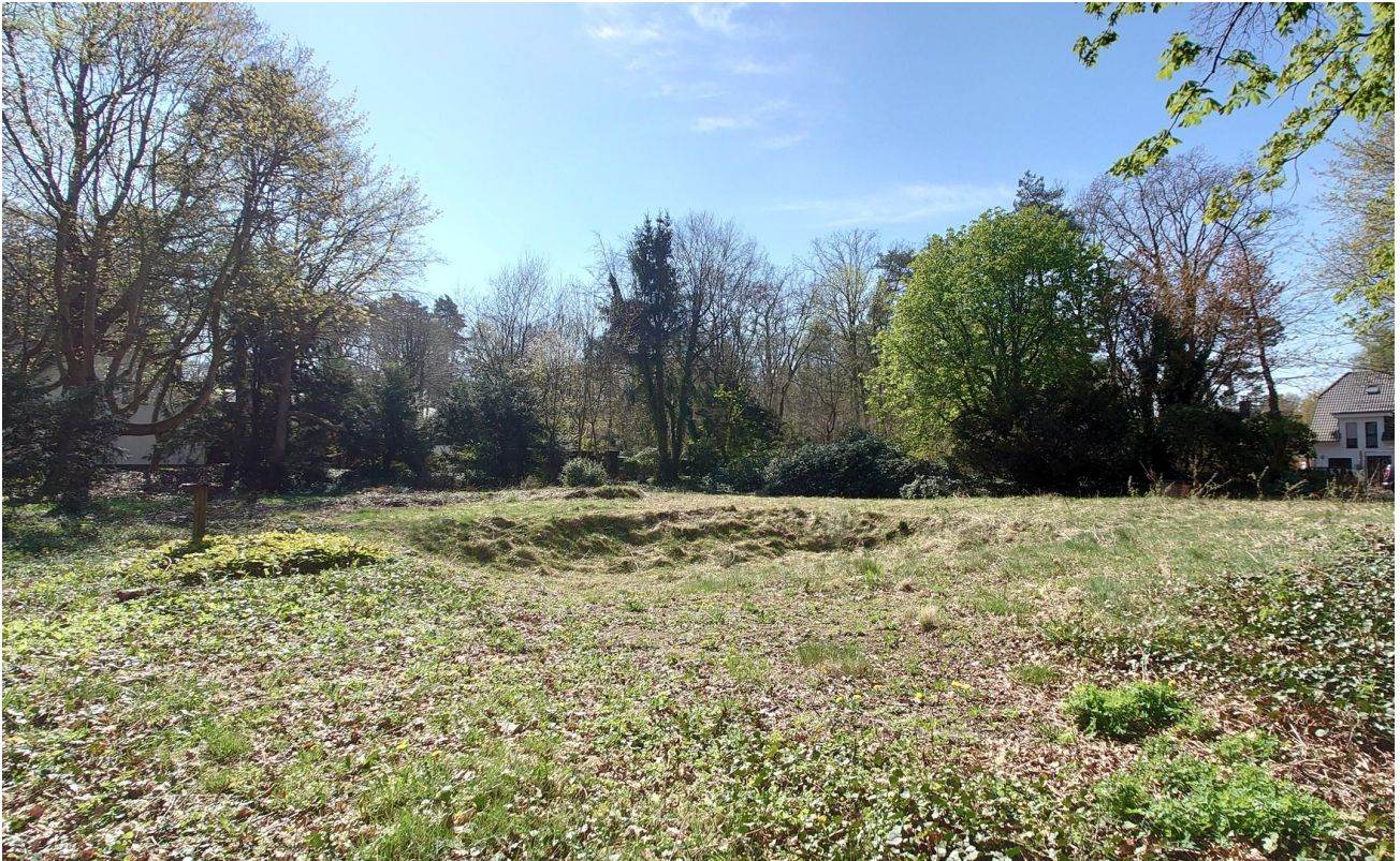
Blick von Nordost