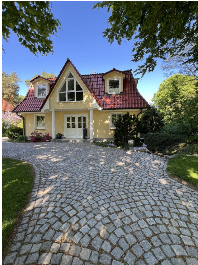
Villa von der Straße