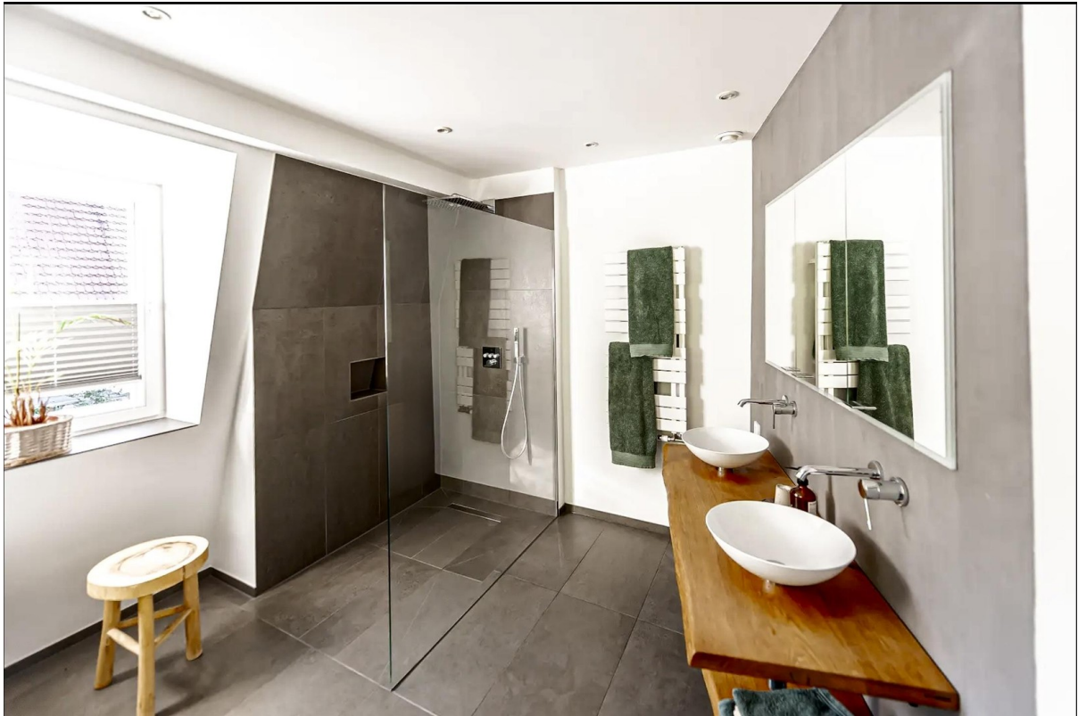
Bad im OG