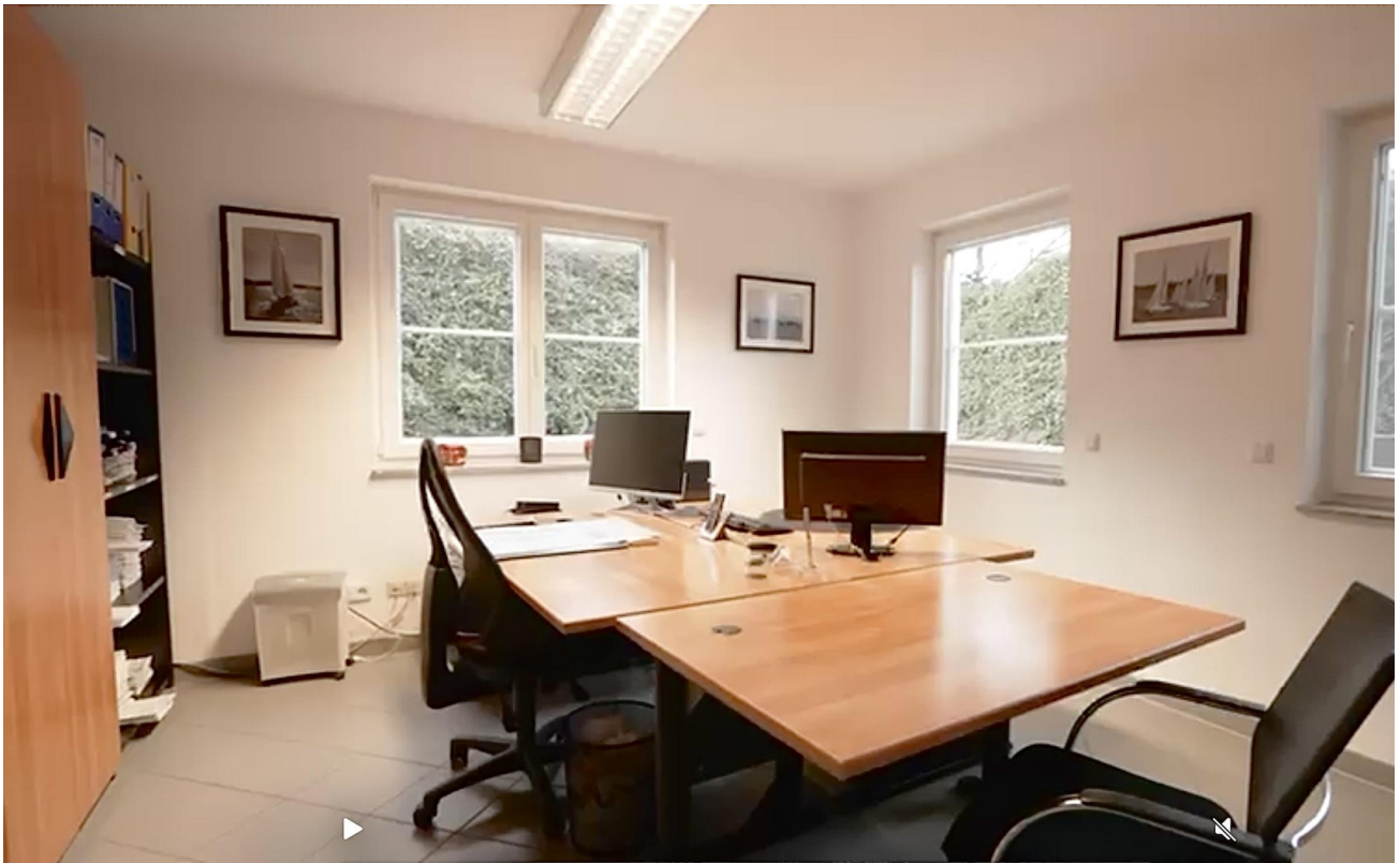
Büro im Souterrain