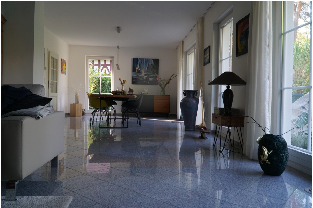
Blick auf den Essbereich