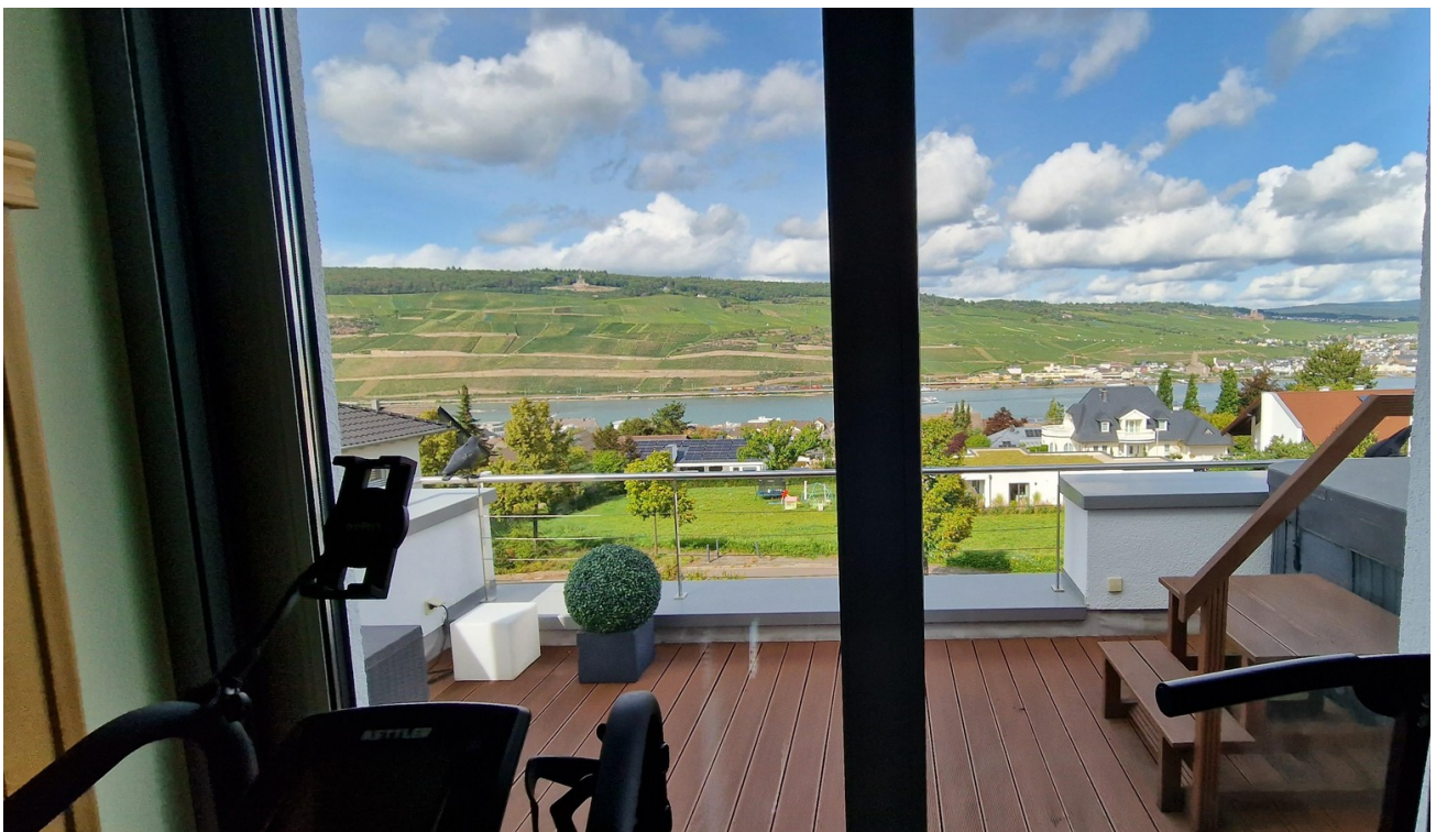
Blick vom Balkon & Jacuzzi