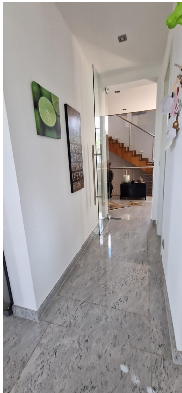
Blick aus Küche