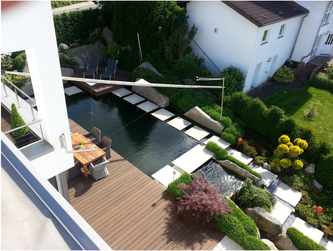
Blick vom Dach