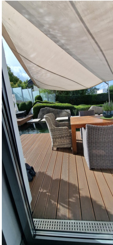
Blick aus der Küche