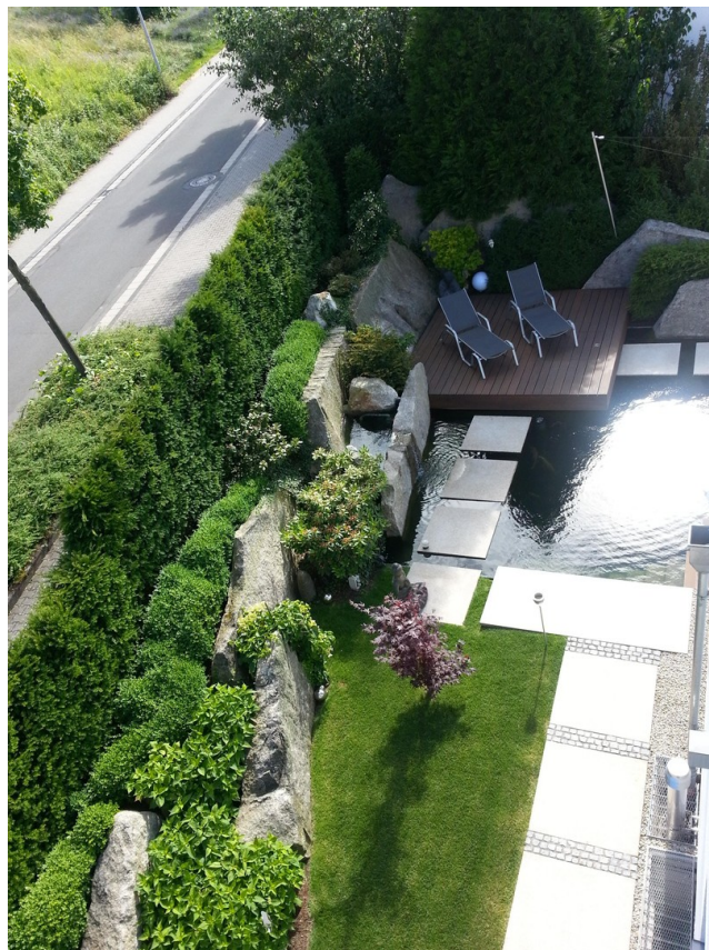
Blick vom Dach