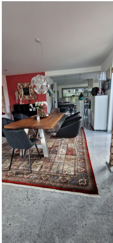
Esszimmer Blick zu Küche