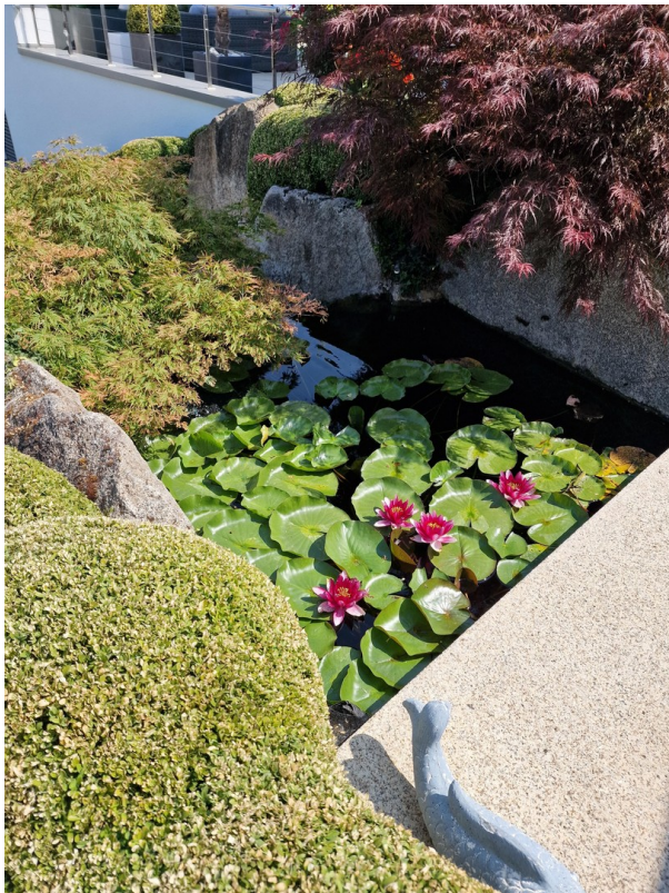
Seerosen am Bachlauf