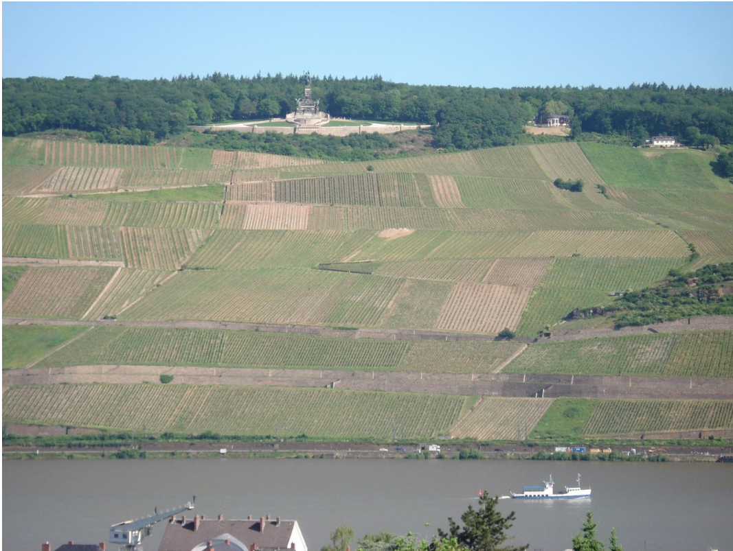
Blick Balkon zum N.-Denkmal