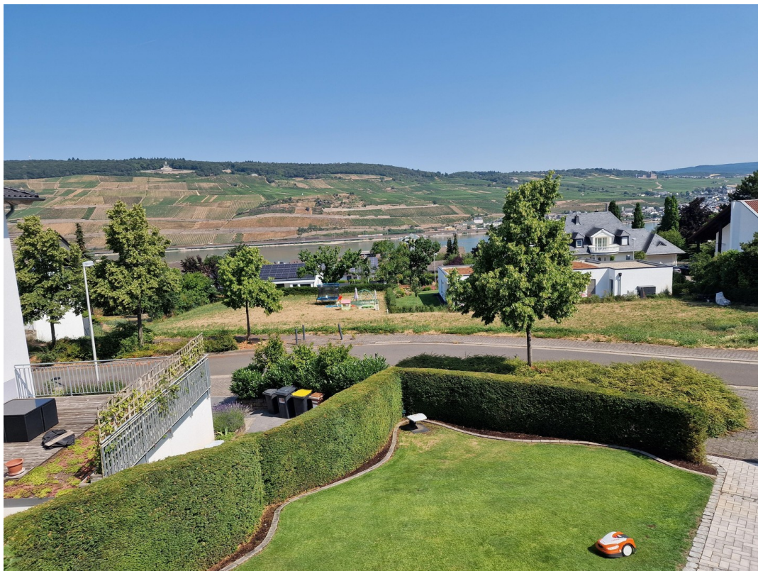
Blick zum Rhein & Weinberge