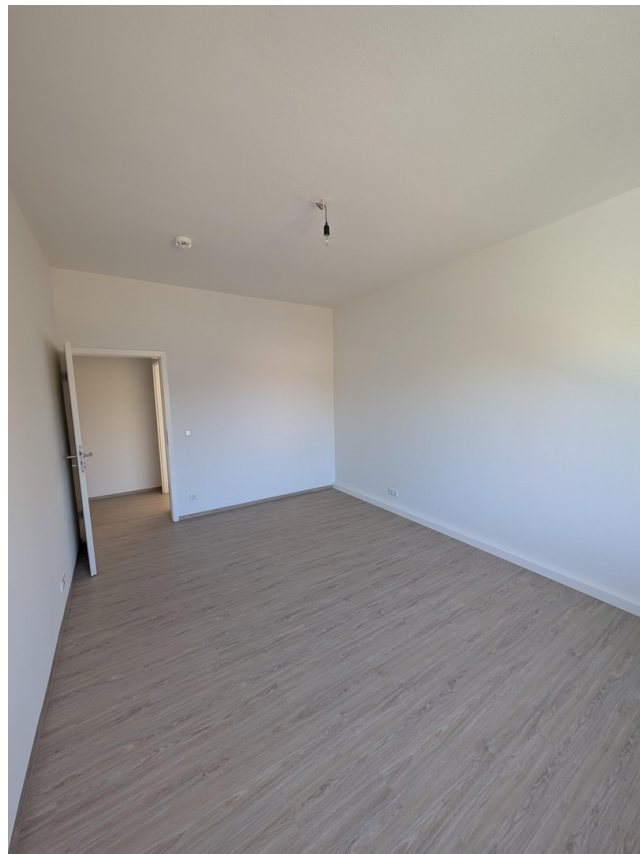
Schlaf- und Wohnbereich