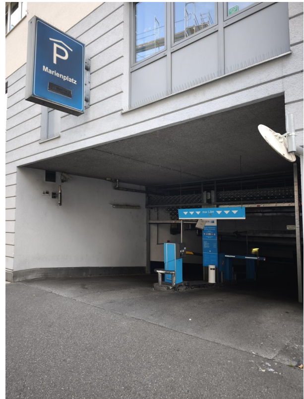
Einfahrt Tiefgarage Marienpl.