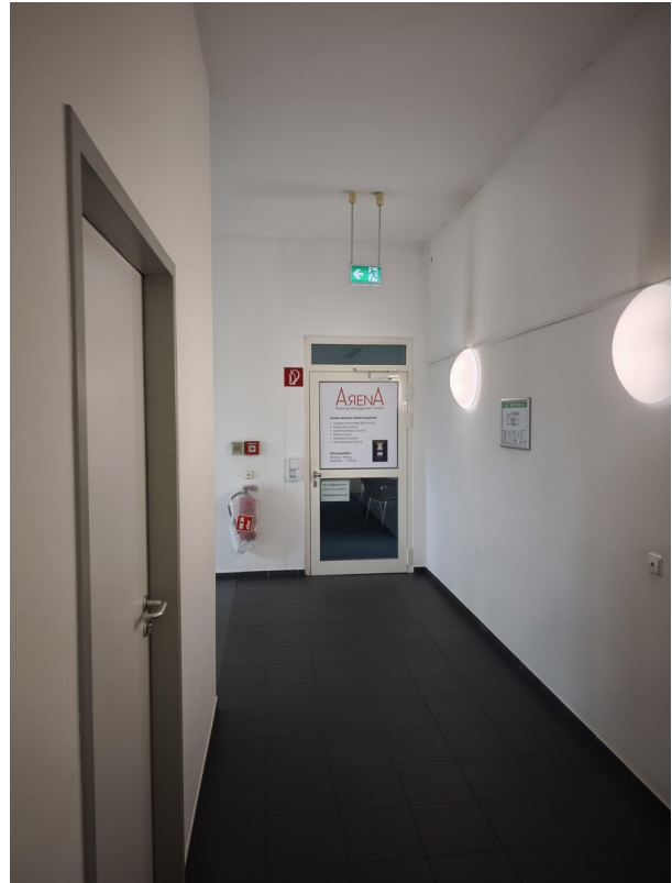
Zugang Büro 5. Etage