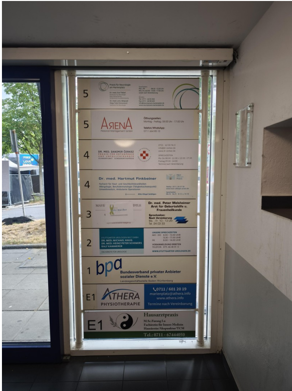
Eingangsbereich zur 5. Etage