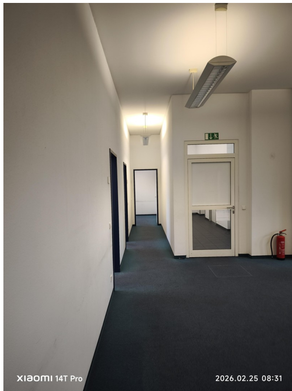
Flur / Ausgang