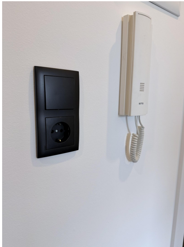
mit Liebe zum Detail