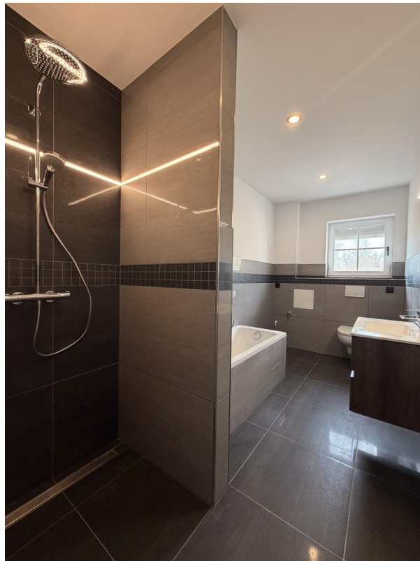
Bad mit Wanne und Dusche