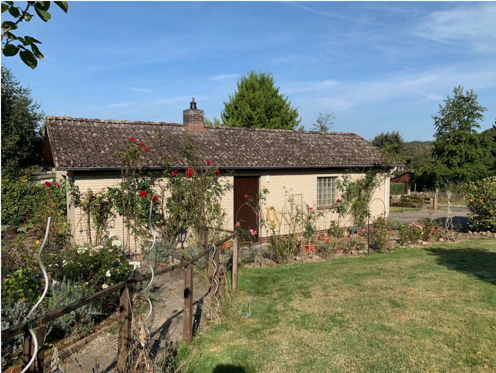
Garage mit Nebenraum