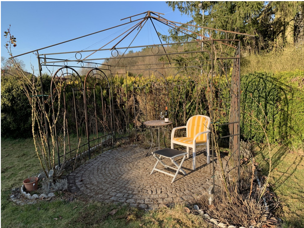
Pavillon in der Abendsonne