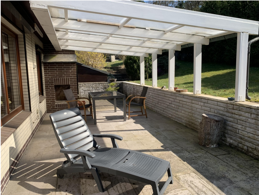
Südterrasse mit Außenkamin