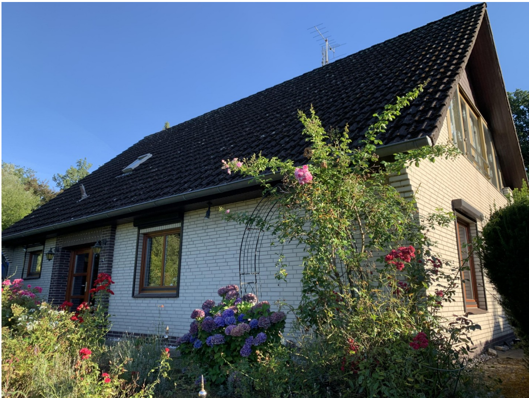
Balkon zum Westen