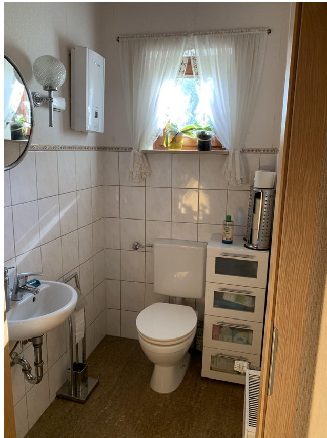
Gäste-WC im Erdgeschoss