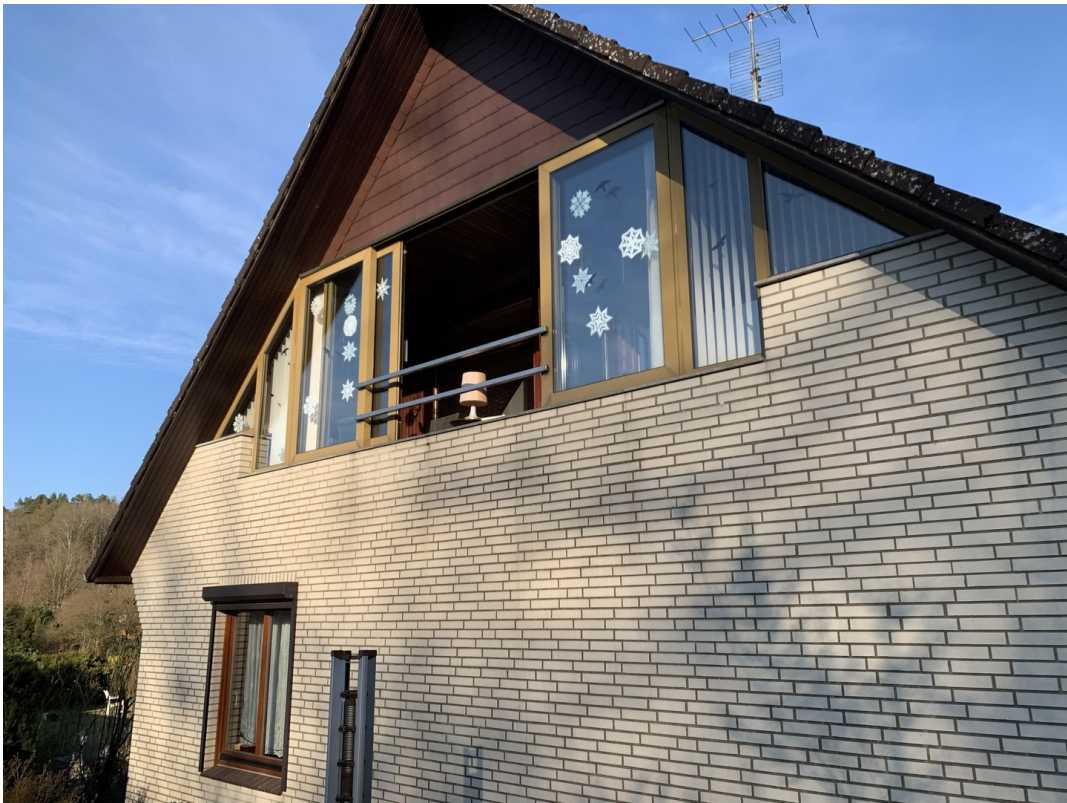
Balkon mit Schiebetür