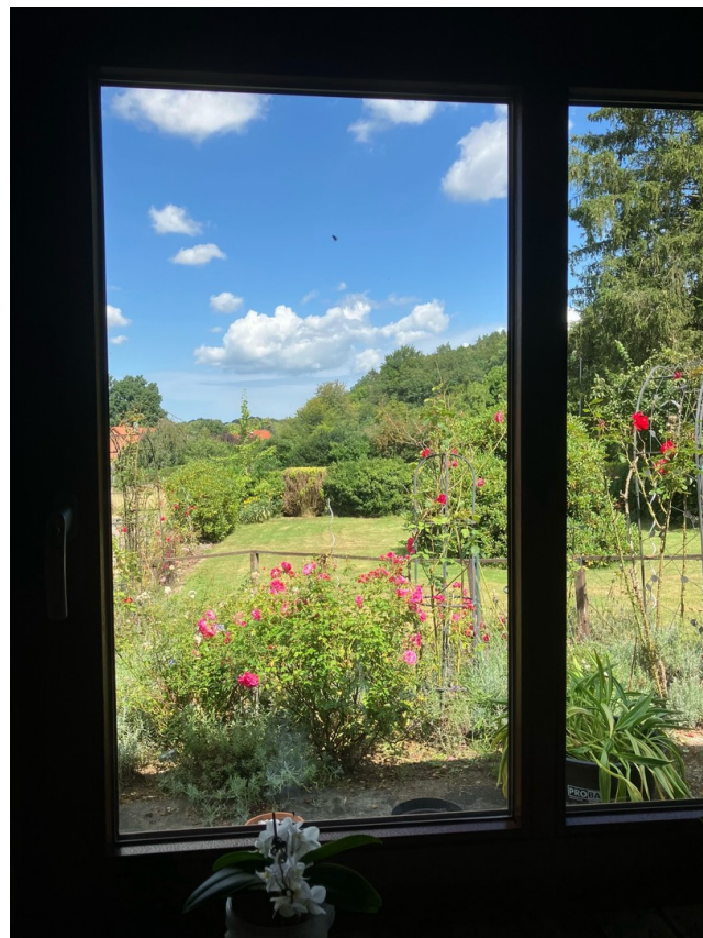
Blick aus dem Küchenfenster