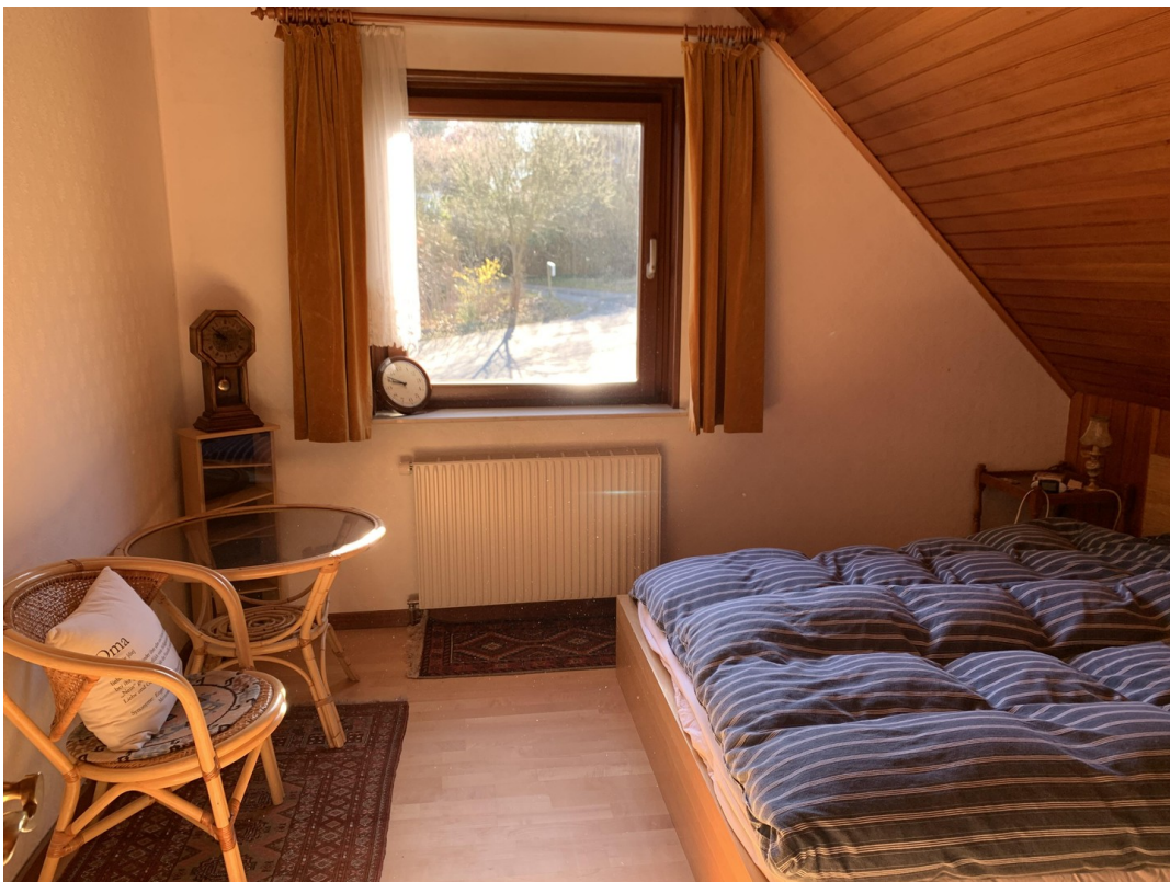
Schlafzimmer im Obergeschoss