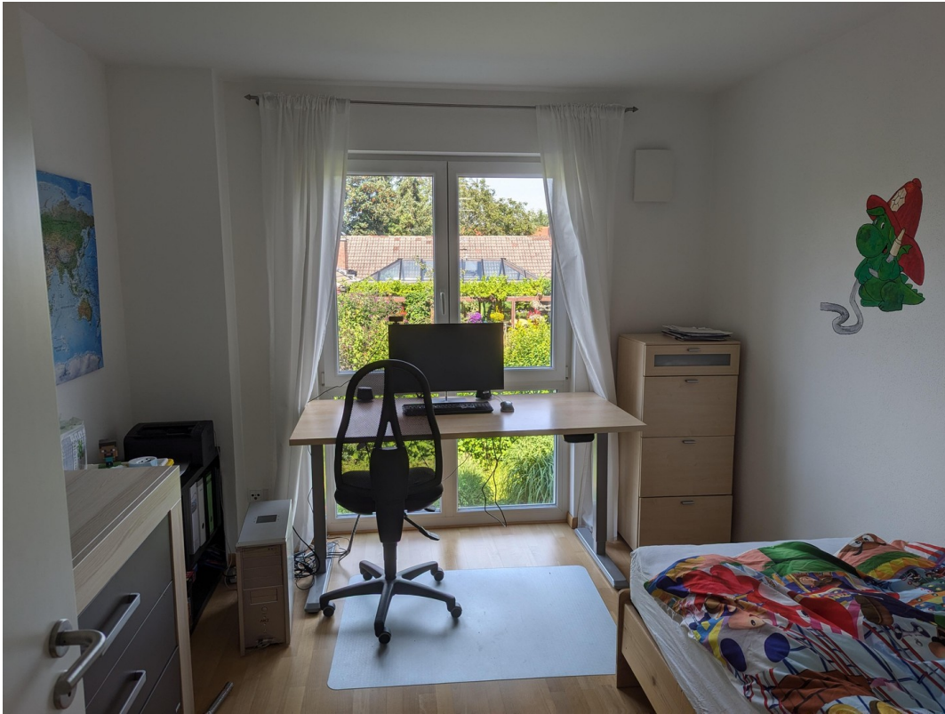
Das zweite Zimmer