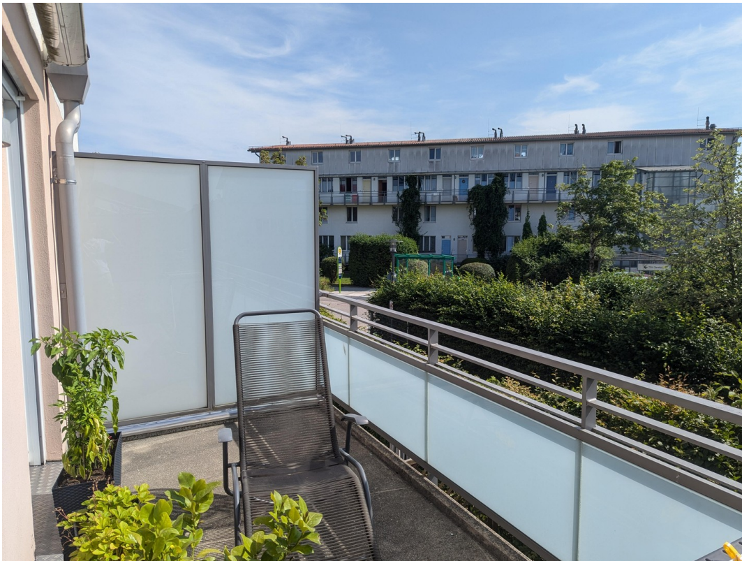
Da könnten Sie liegen...