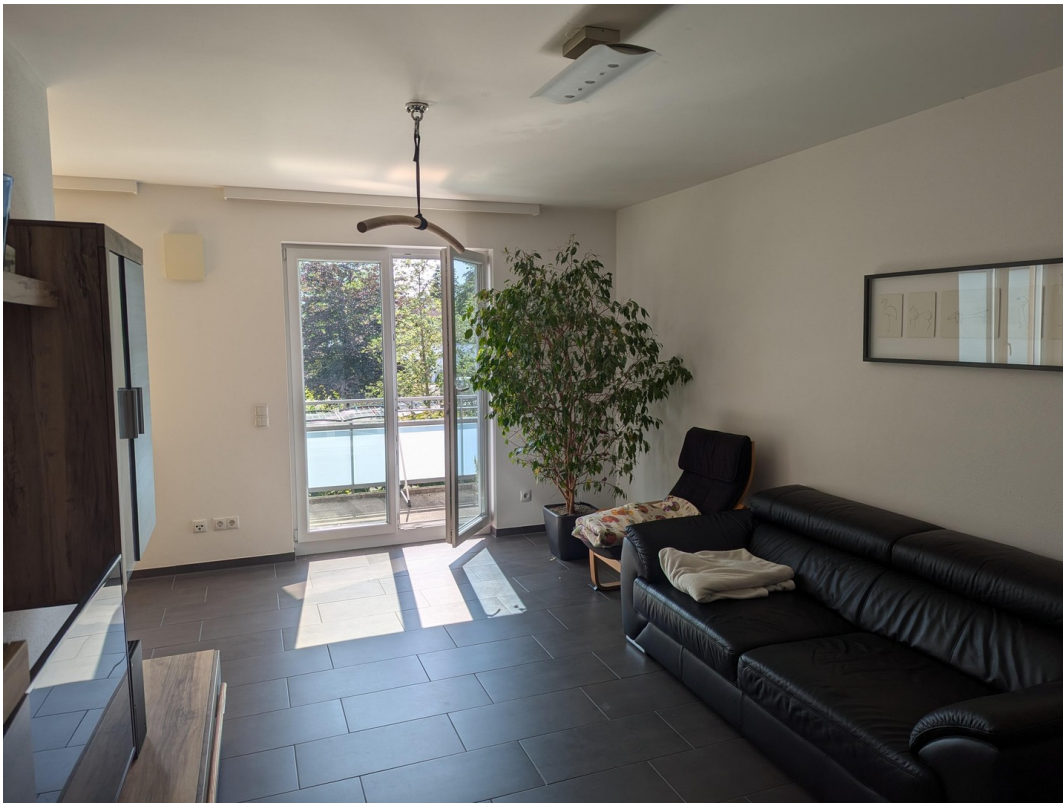
Nochmal zurück ins Wohnzimmer