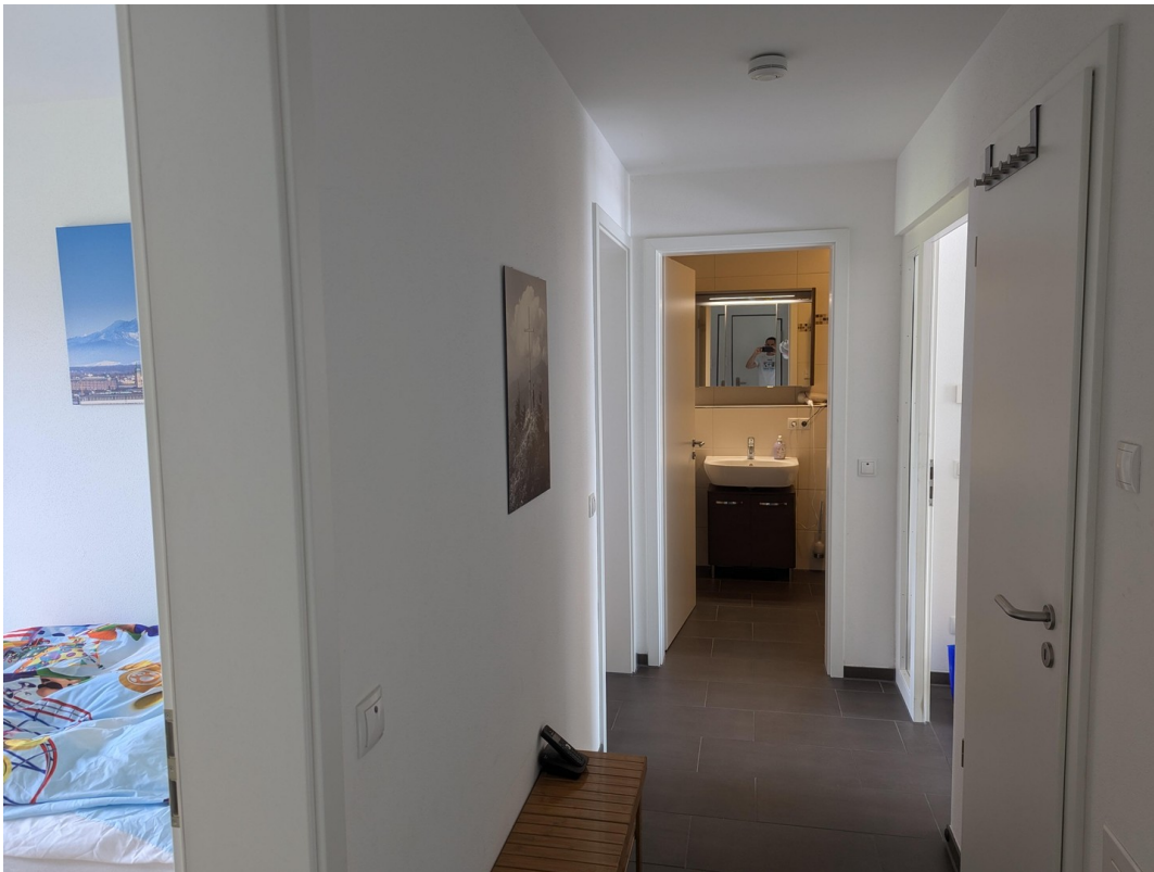
Der Flur. Rechts die Abstellk.