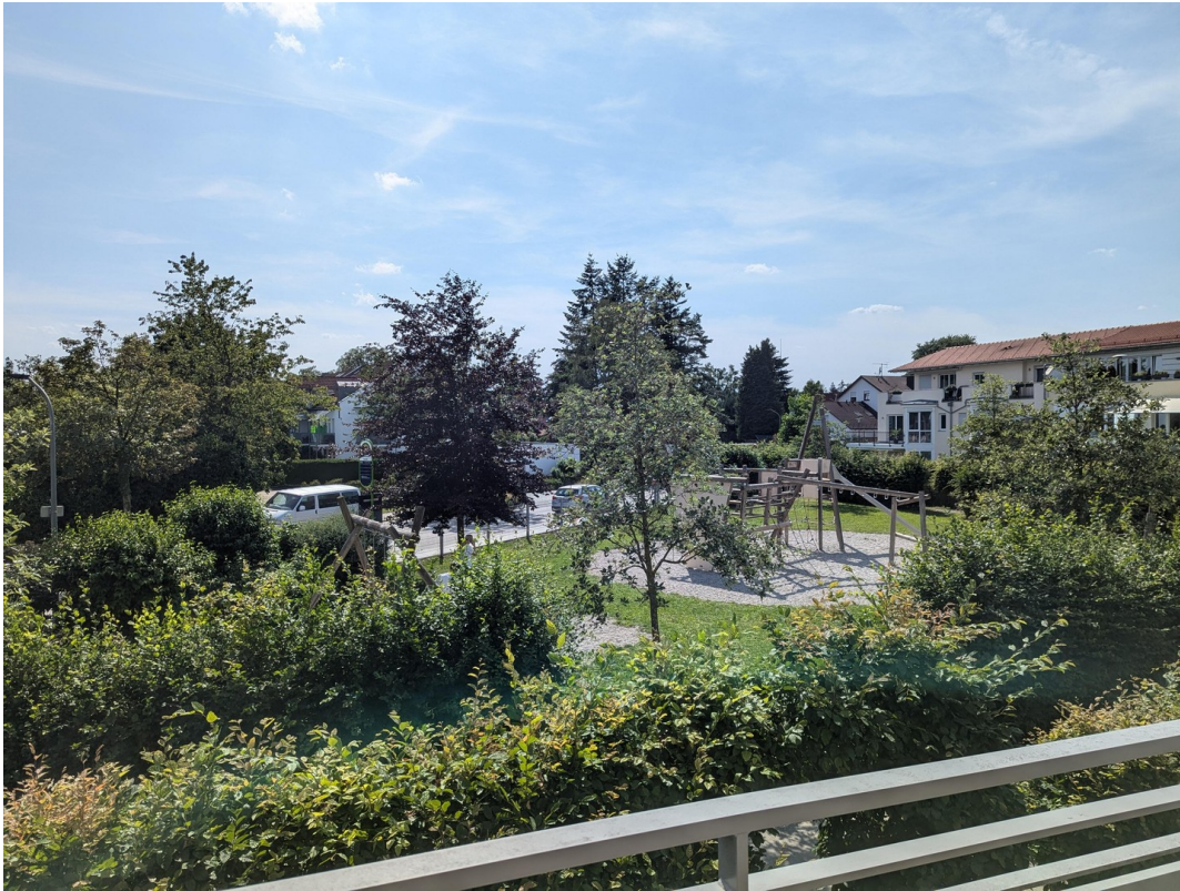
Weiter Blick vom Balkon