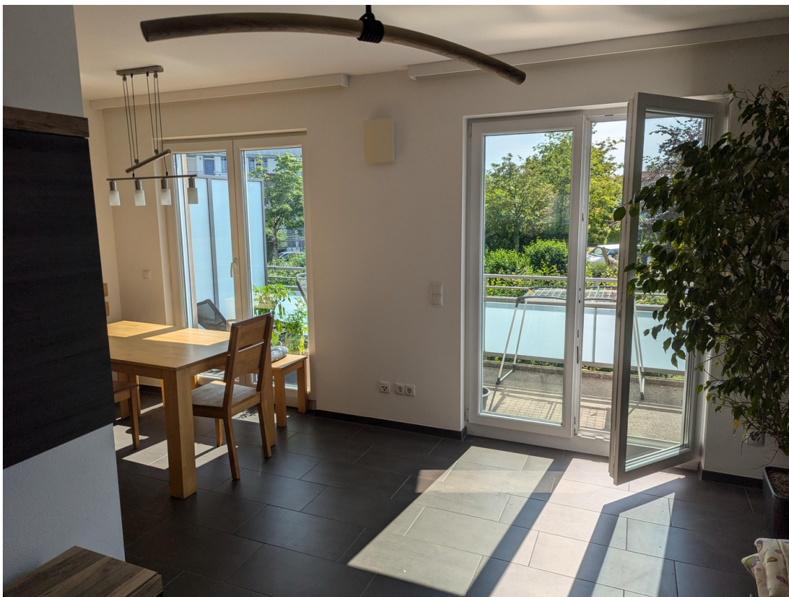
Ein sonniges Wohnzimmer