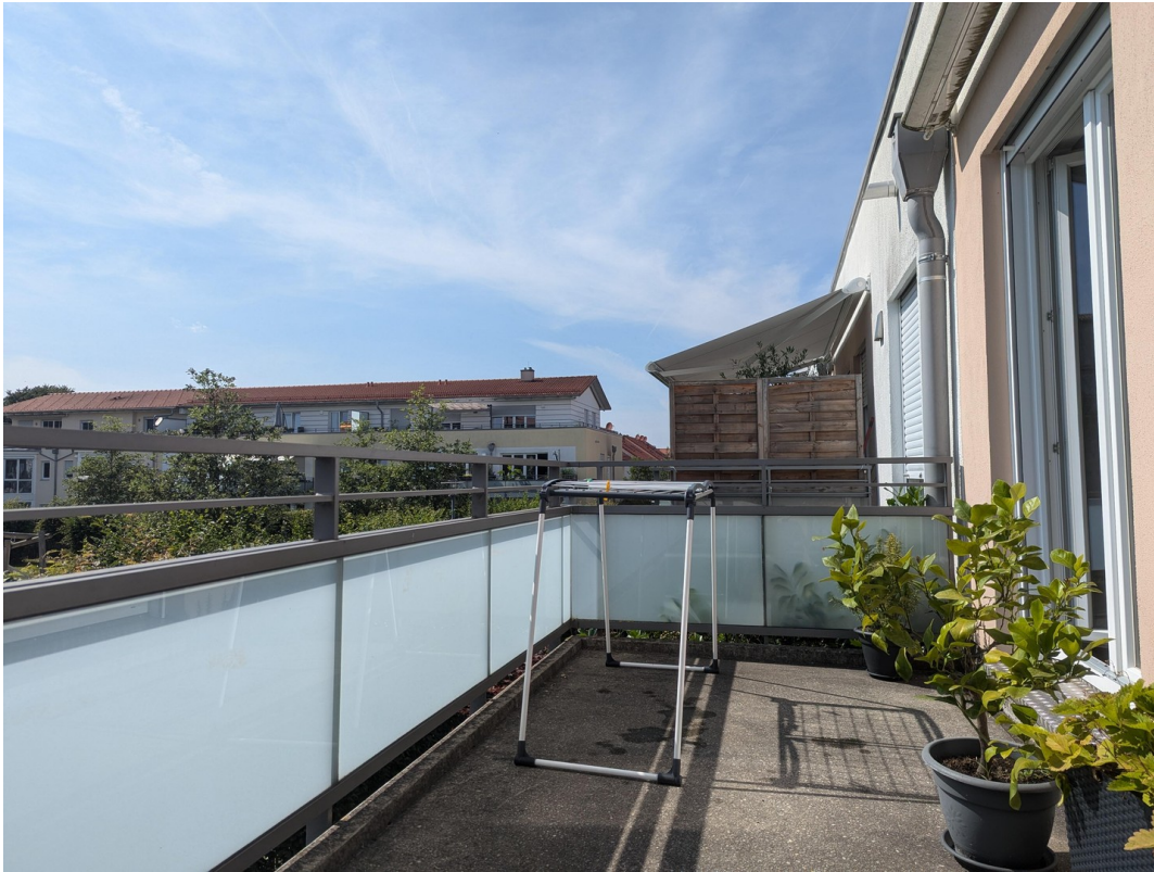
... und die Sonne genießen!