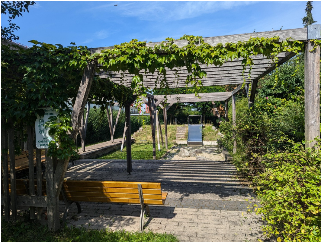
... mit tollen Außenanlagen