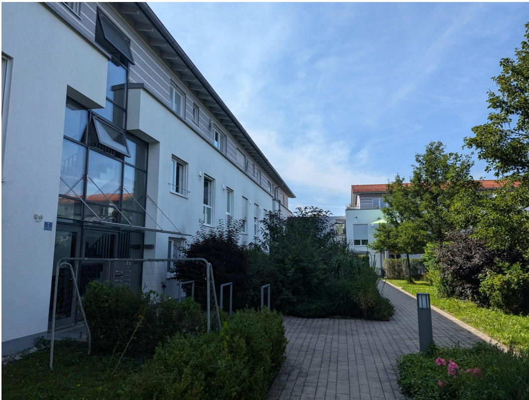
... in einer gepflegten Anlage