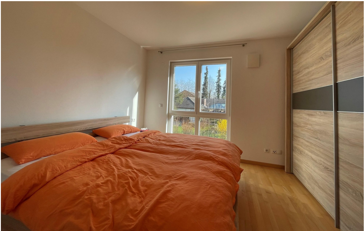
Das geräumige Schlafzimmer