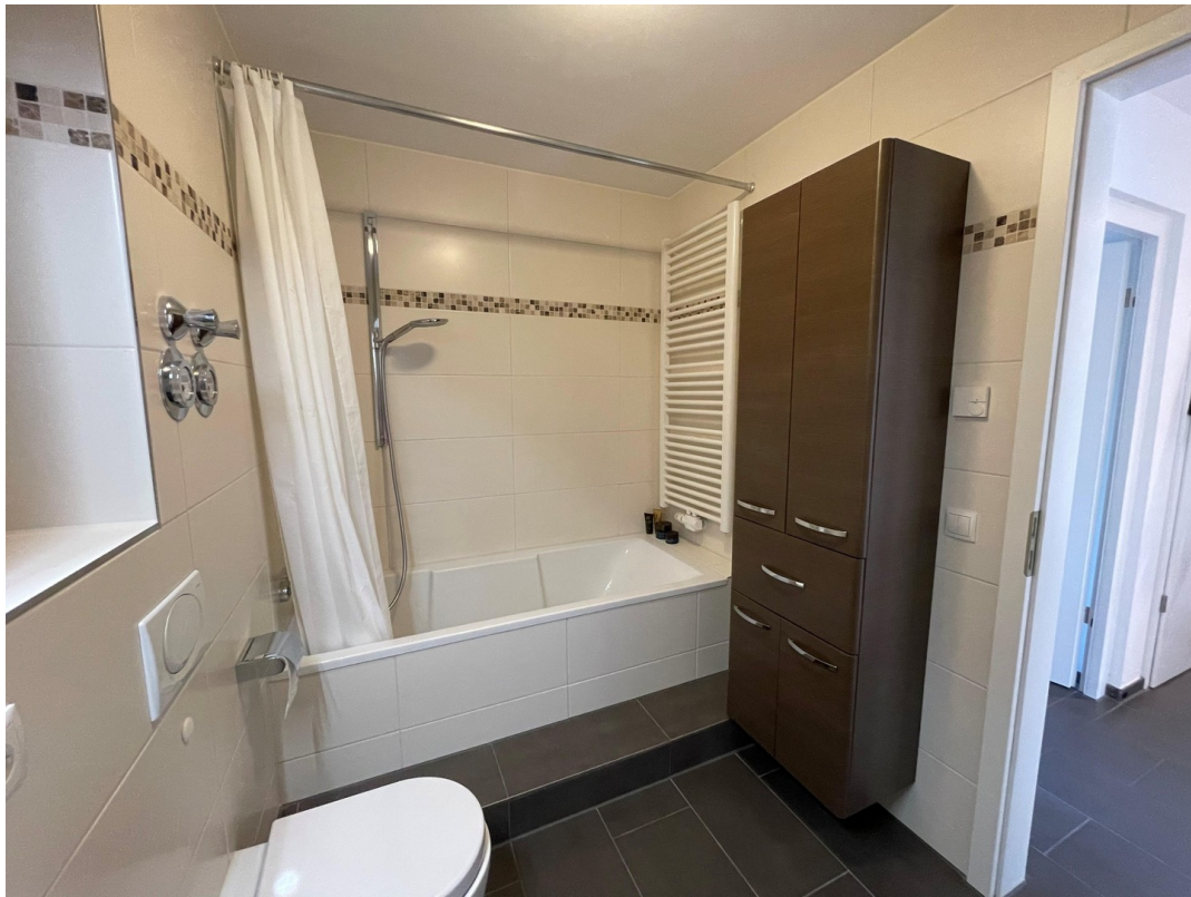
Das deckenhoch geflieste Bad