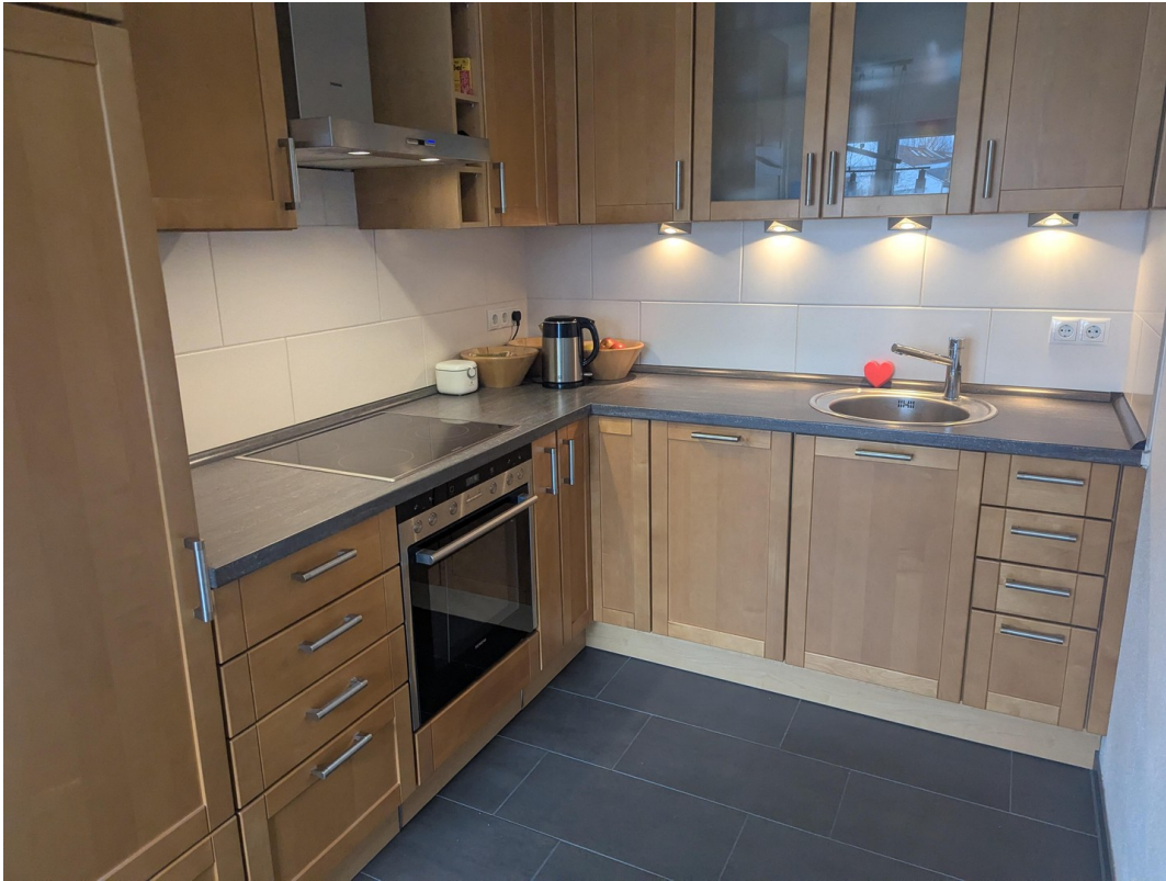
Die Küche ist schon dabei!