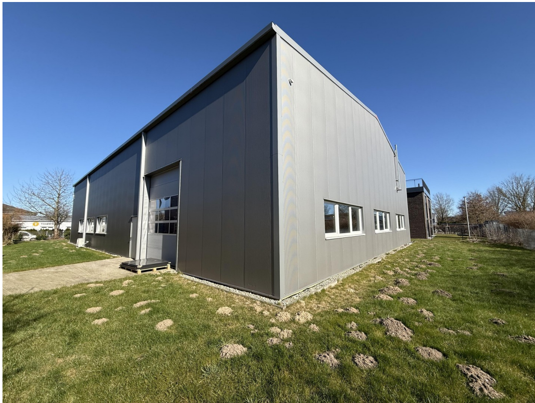
Außenansicht hinterer Bereich