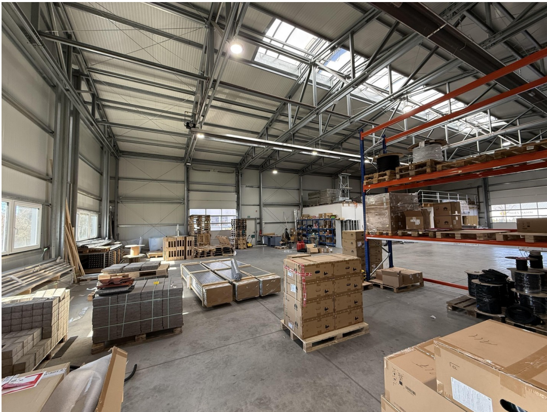
Blick Richtung Seitentor