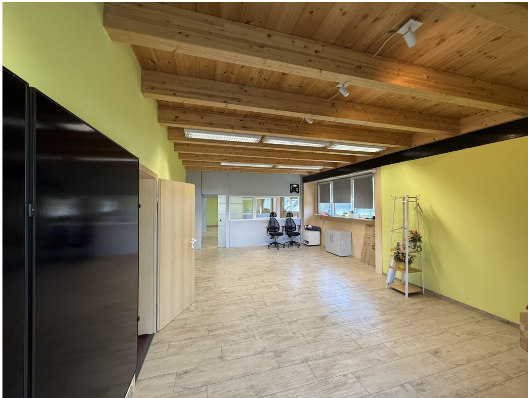
Büro / Kundenempfangsbereich