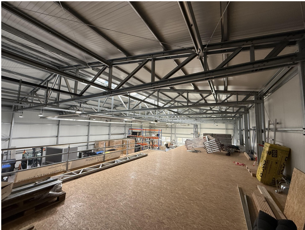
Empore über Büro