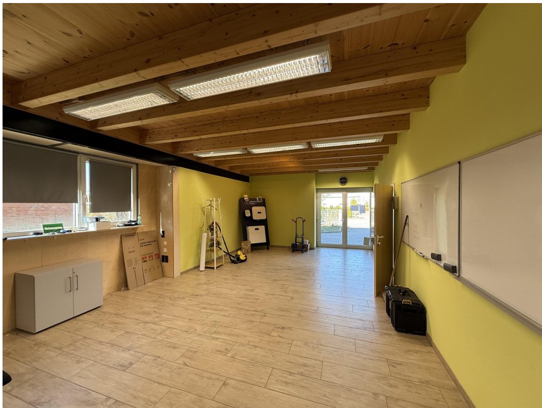
Büro / Kundenempfangsbereich