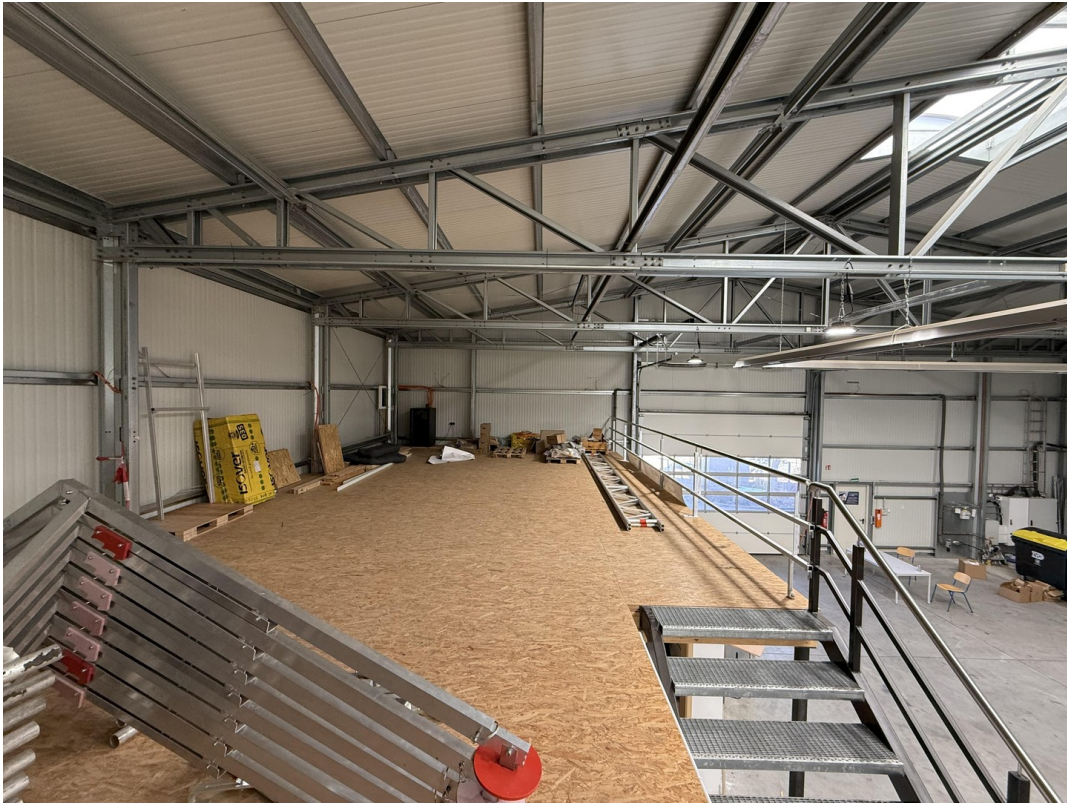
Empore über Büro