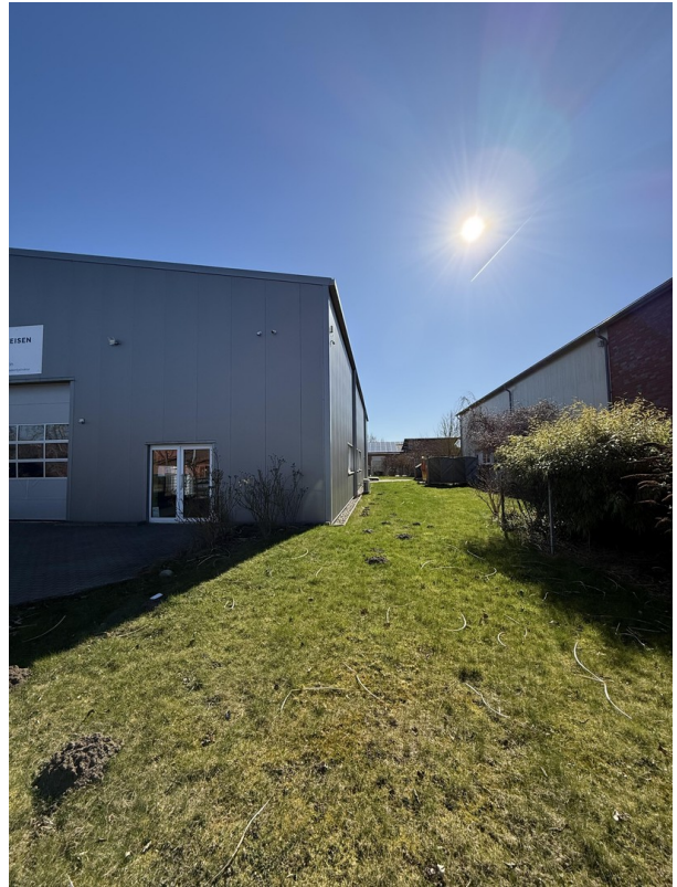
Seitenansicht / Süd-Westseite