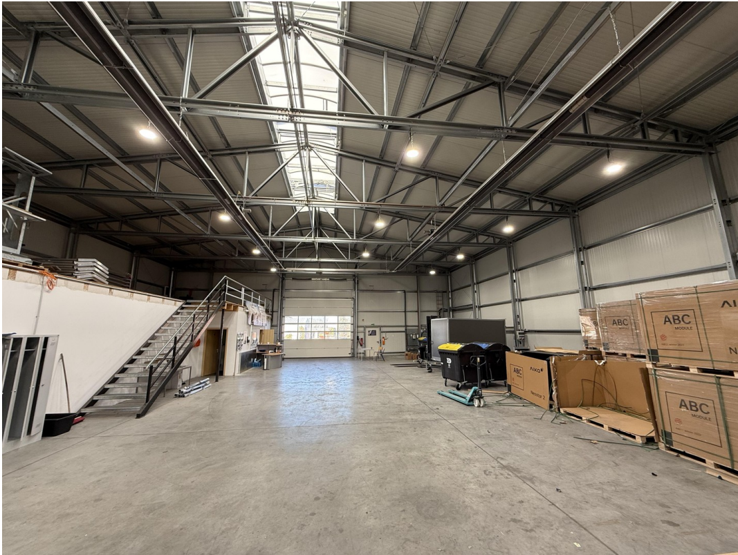
Blick Richtung Haupttor