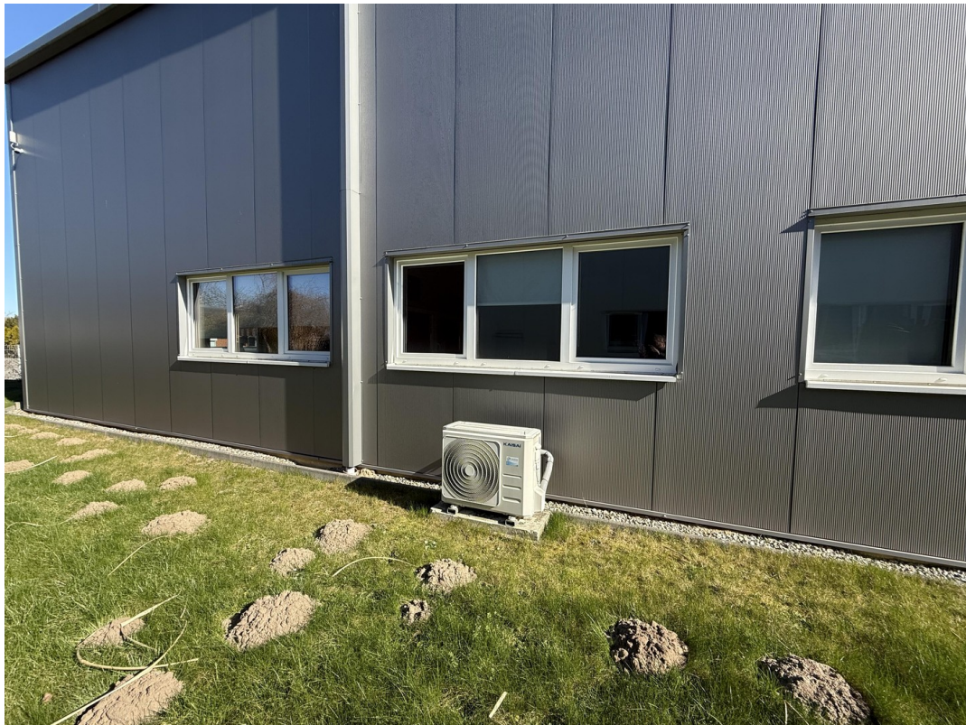
Außenansicht / Luft-Wärmepumpe