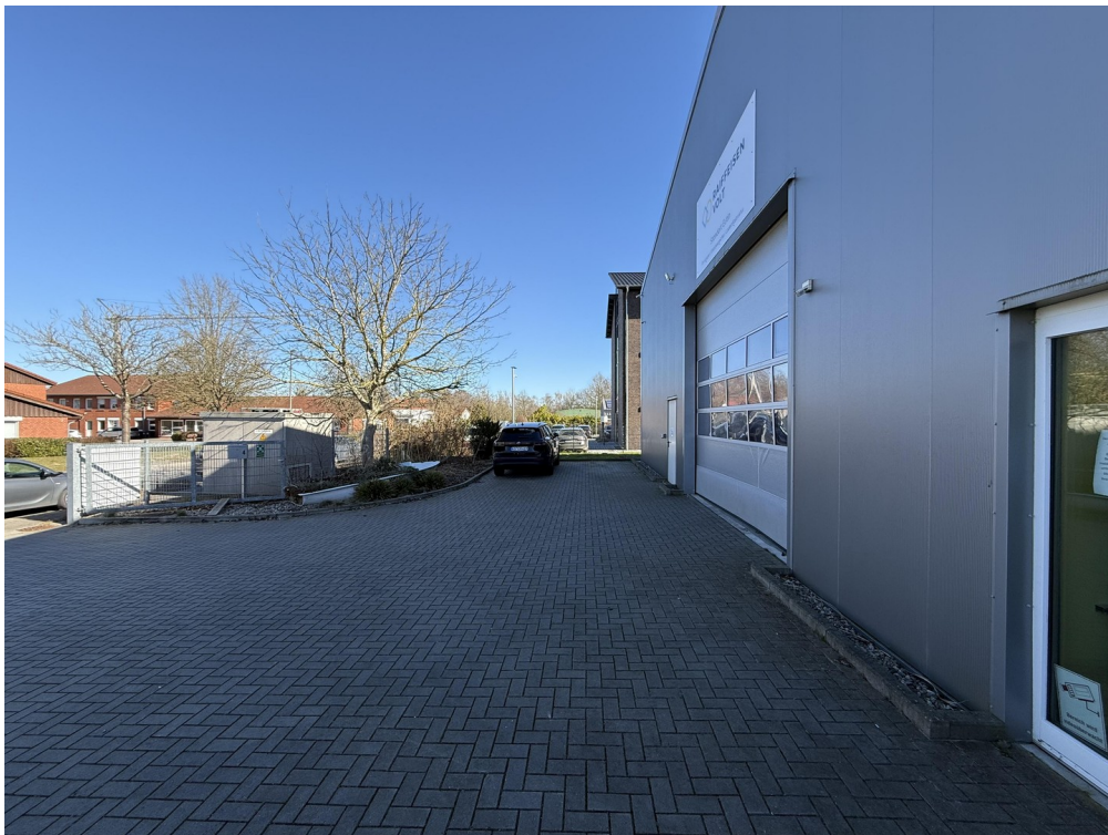
Hofeinfahrt / Parkplätze