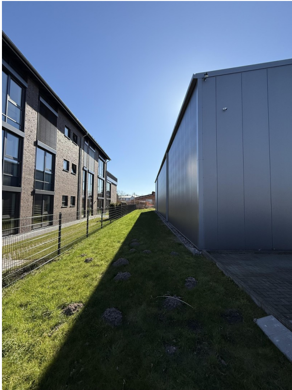
Seitenansicht / Nordseite