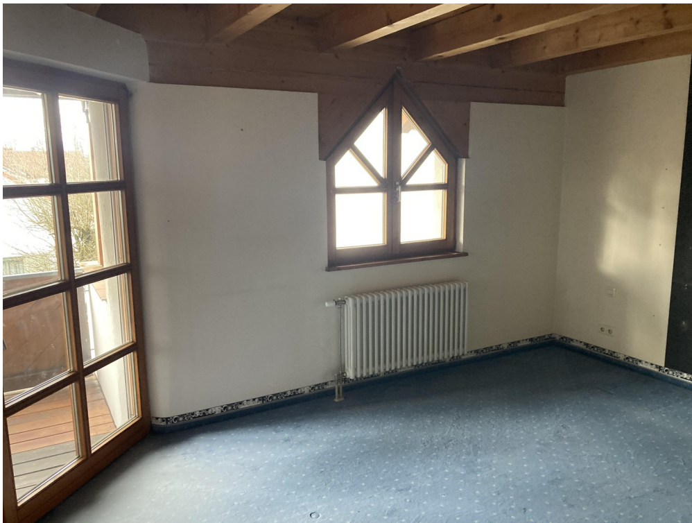
Schlafzimmer mit Balkon, 1. OG