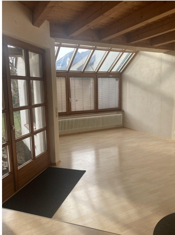
Wohnzimmer mit Wintergarten