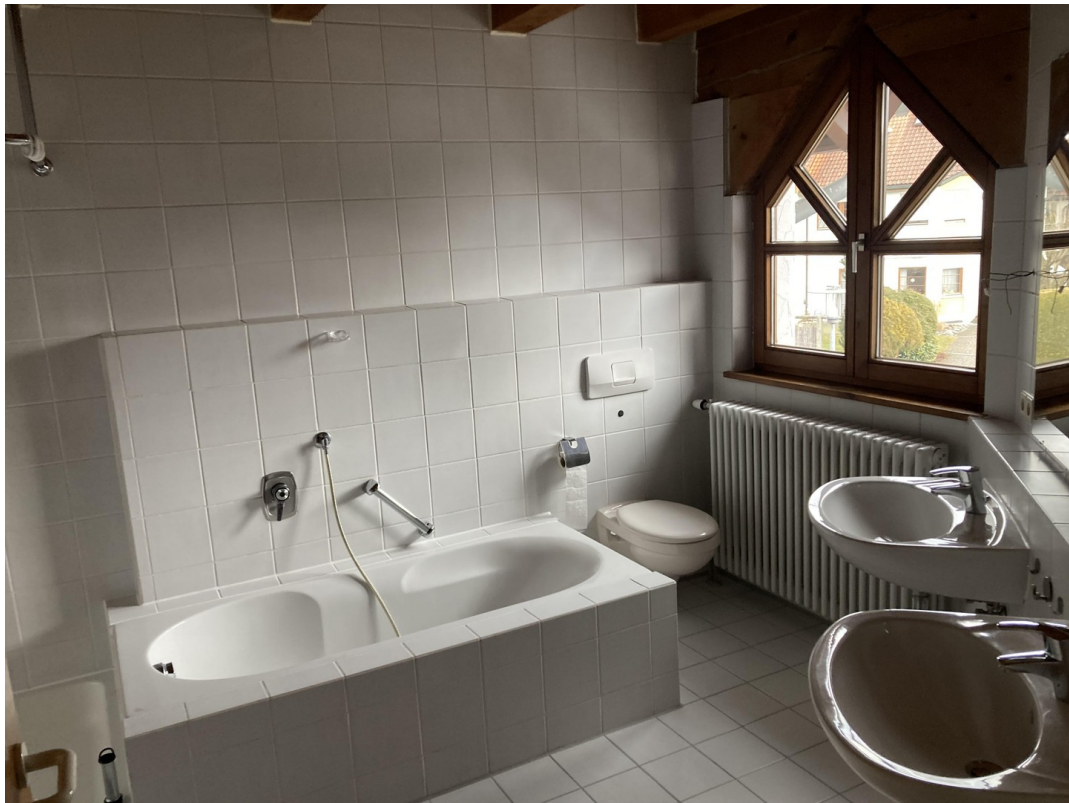
Bad im 1. OG