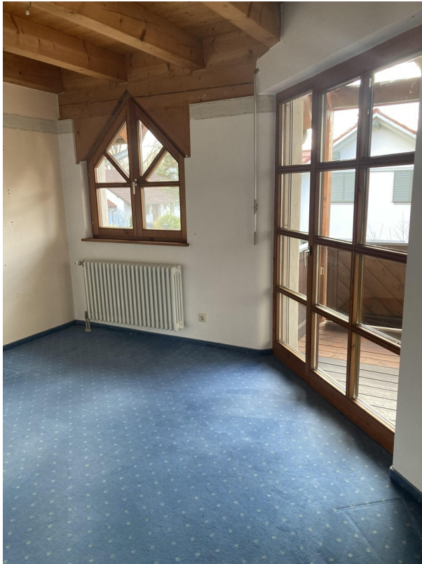
2. Zimmer mit Balkon, 1. OG