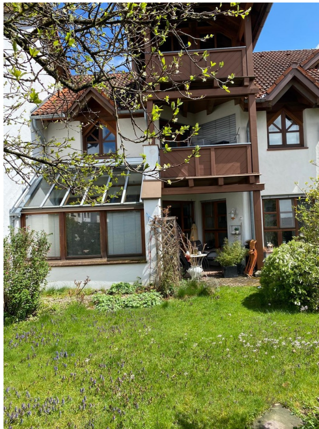
Rückseite mit Garten