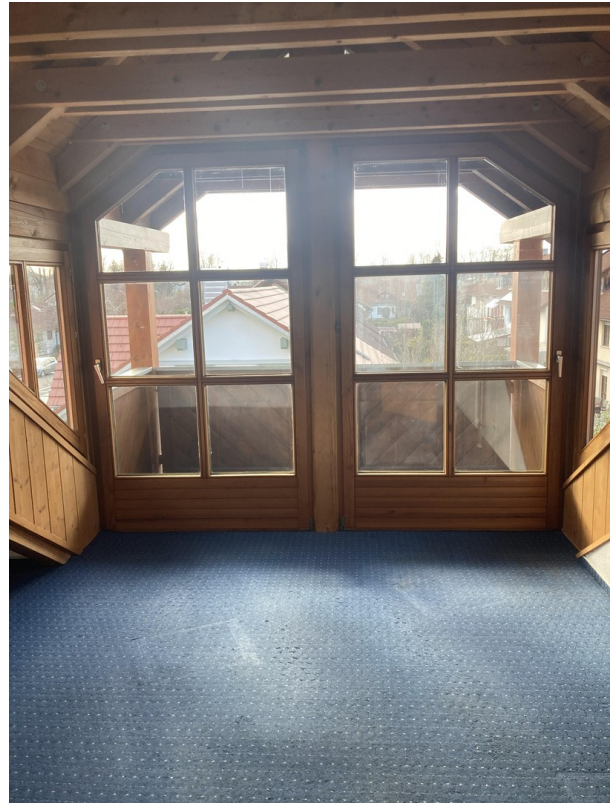
kleines Zimmer mit Balkon, DG