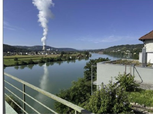
Blick von der Terrasse EG auf den Rhein