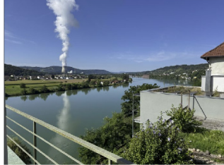
Blick von der Terrasse EG auf den Rhein