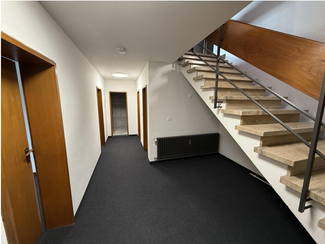
Flur im UG