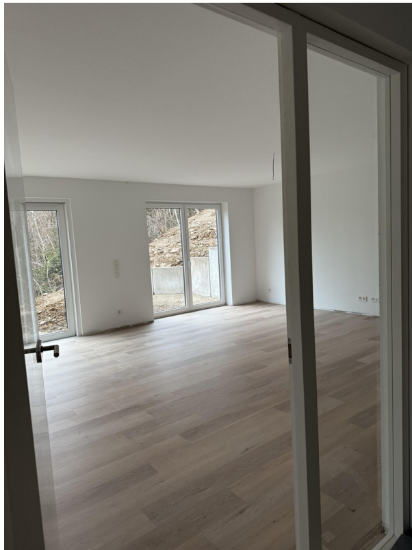
Flur Blick ins Wohnzimmer