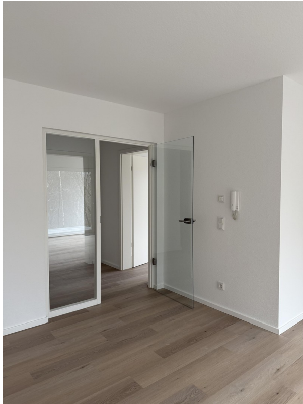
Wohnzimmer Blick in den Flur