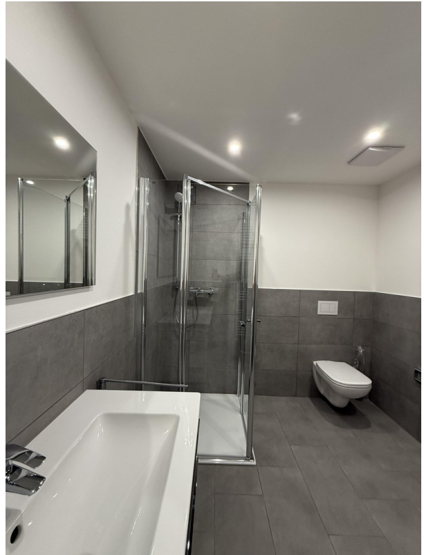
Badezimmer Ansicht 2