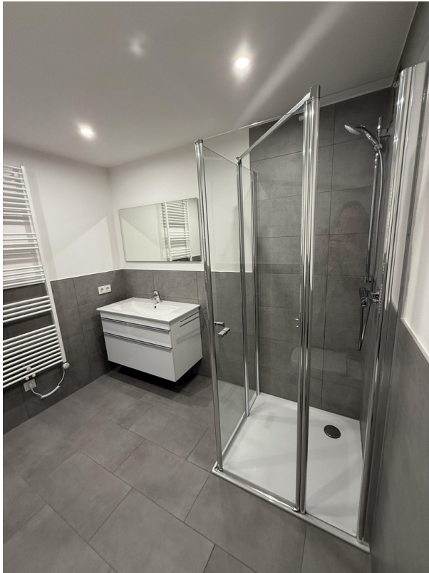
Badezimmer Ansicht 1