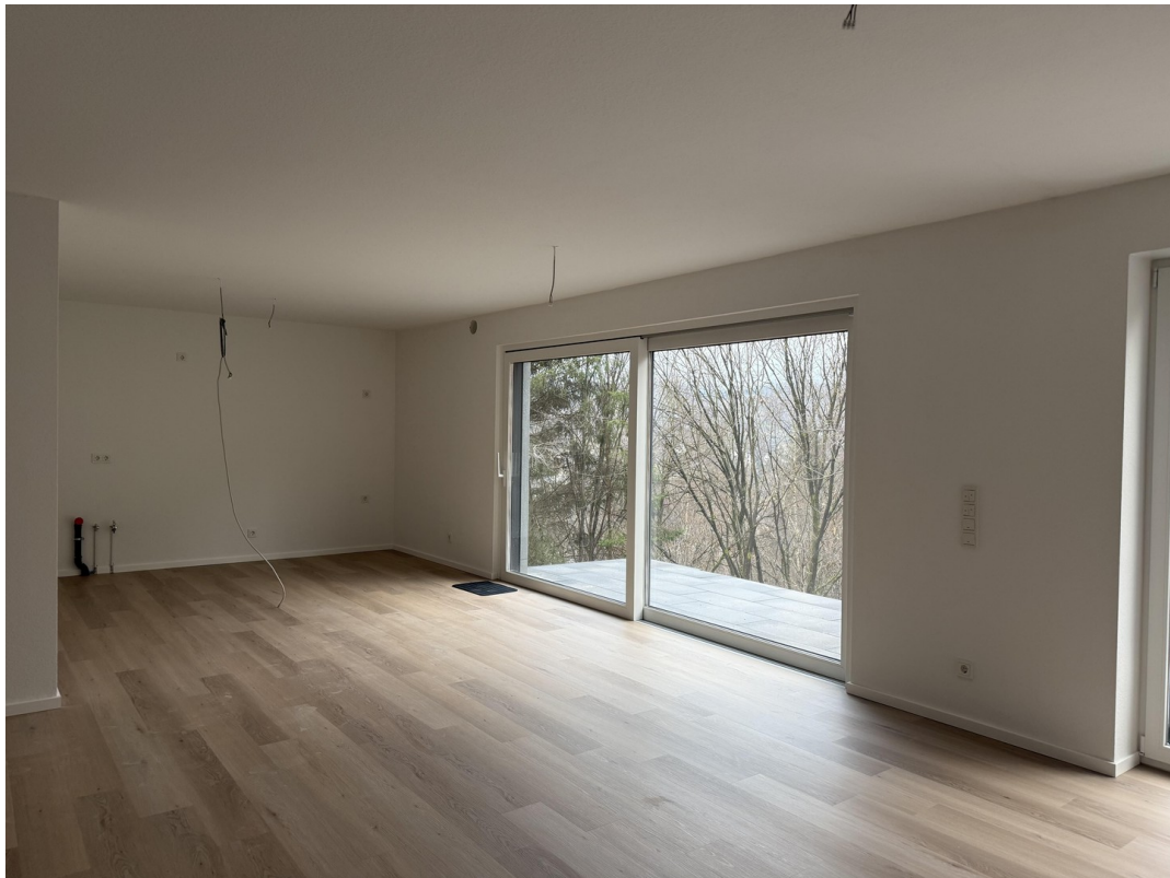
Wohnzimmer Blick in die Küche