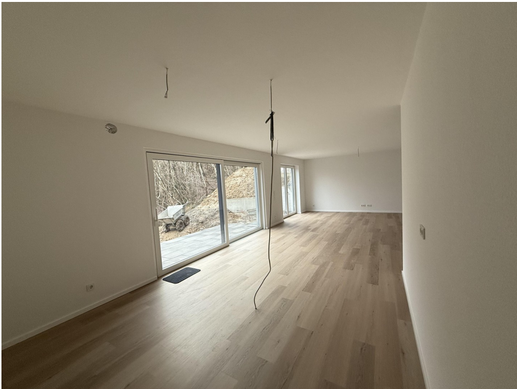
Küche Blick ins Wohnzimmer