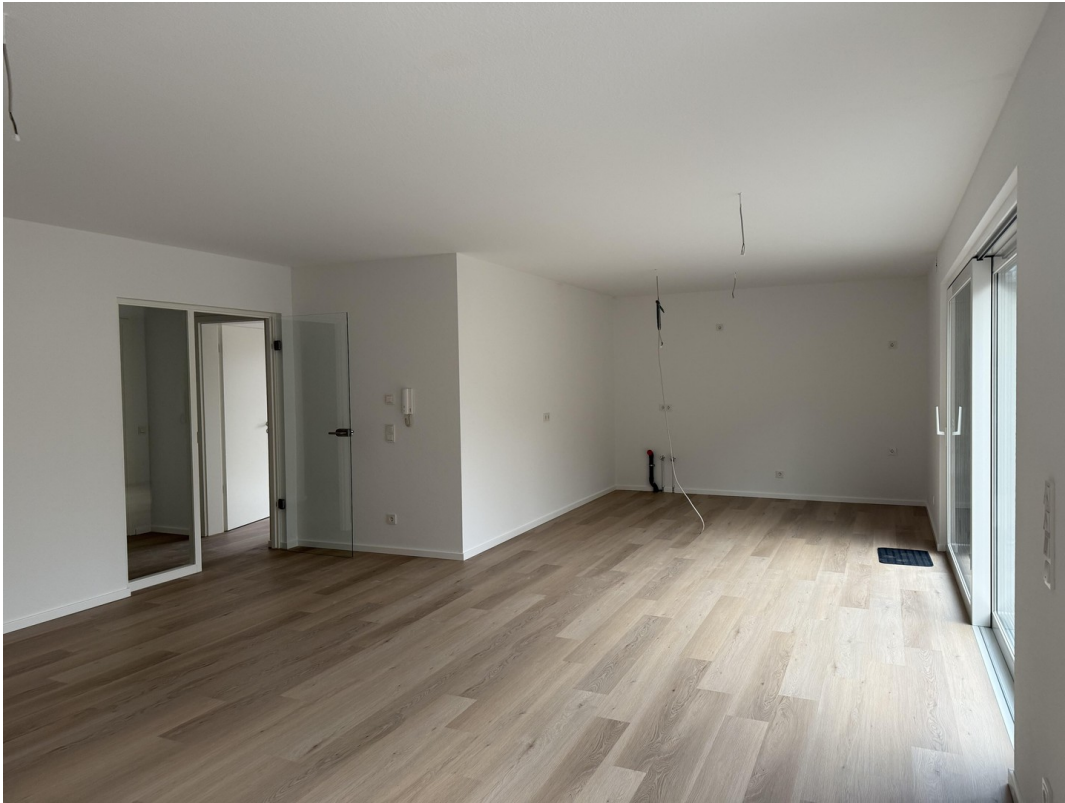
Wohnzimmer Blick in die Küche