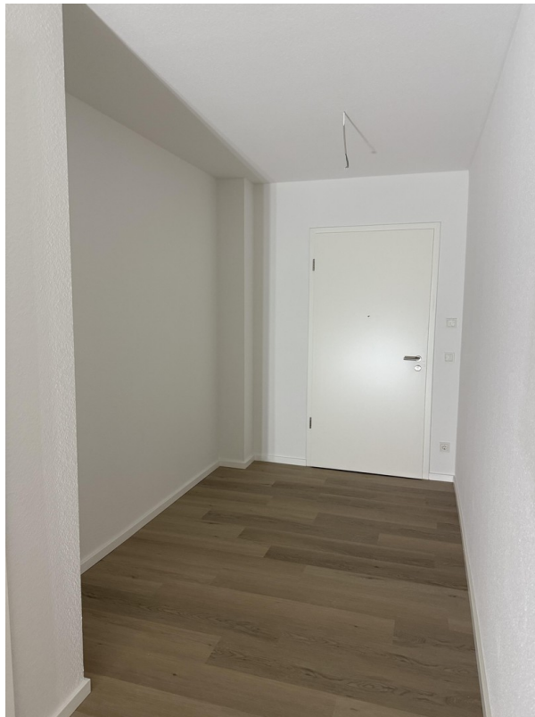
Flur Blick zur Haustür