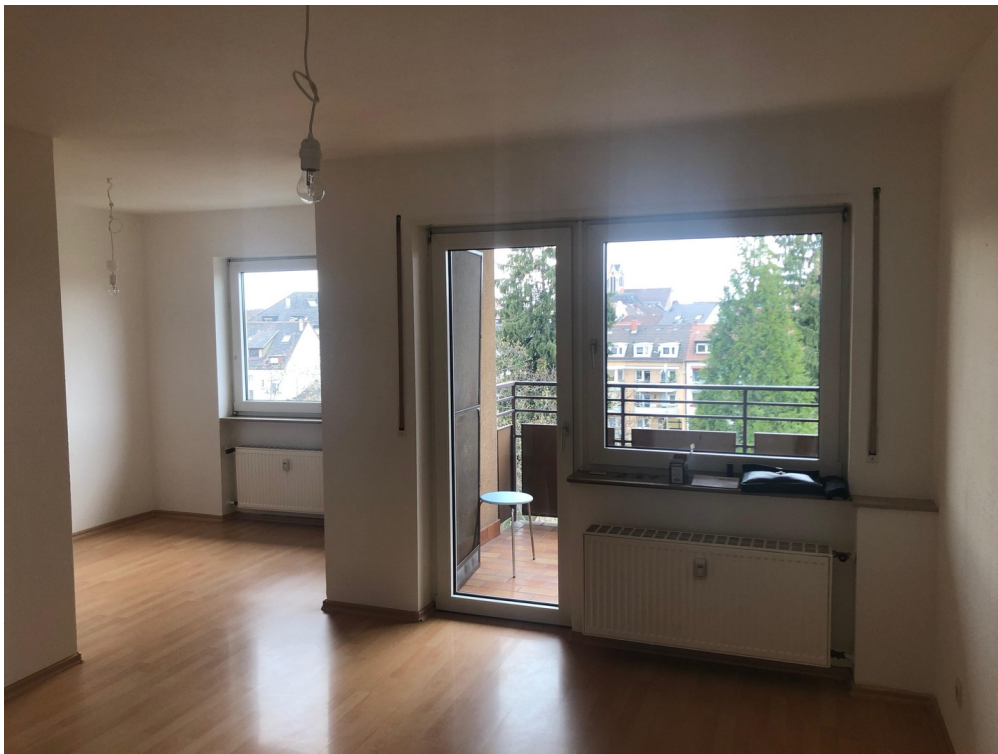
Wohn- und Essbereich 3