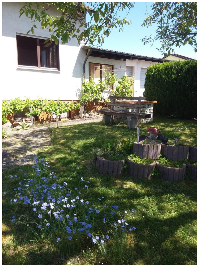
Bank am gemauerten Grill