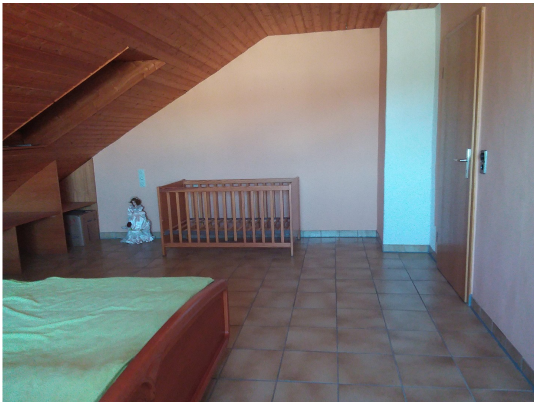
OG Zimmer Ost