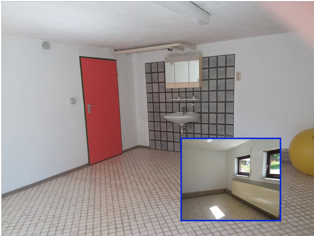
UG Hobbyraum (West)