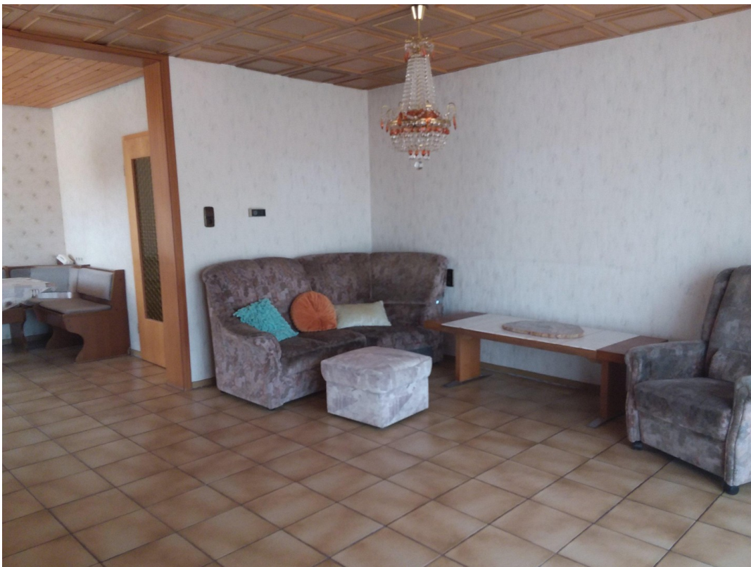
EG Wohnzimmer (2)