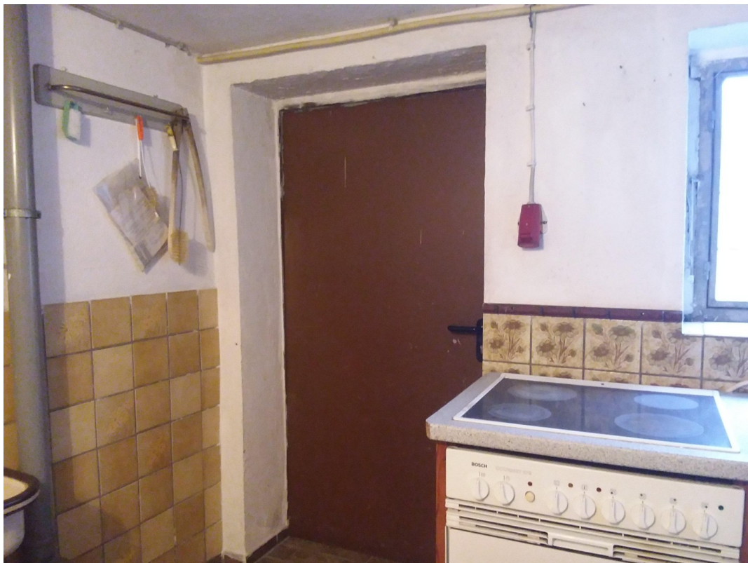
Waschküche Zugang Garten