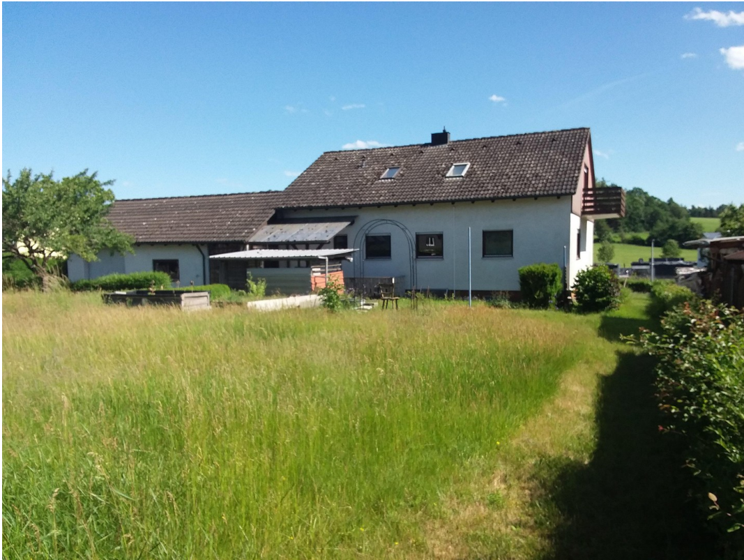
Bebauungspotenzial im Norden