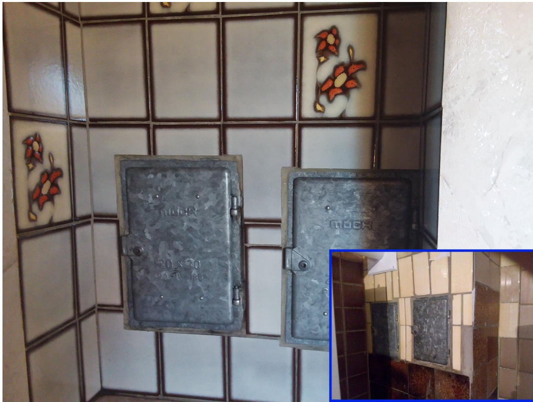
zweizügiger Kamin UG bis DG