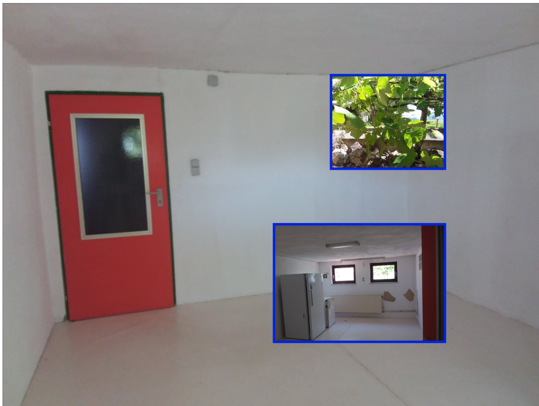
UG weiterer Hobbyraum (Süd)