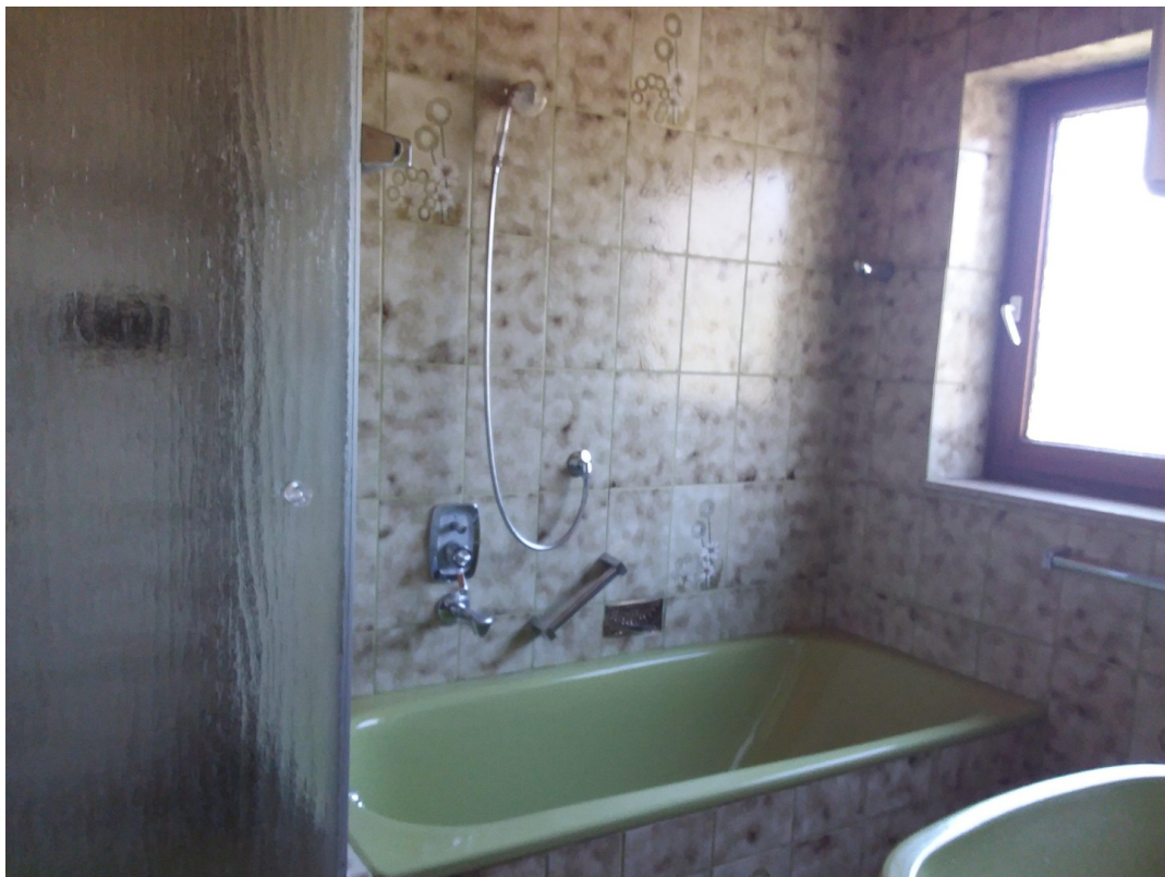
EG Bad: Wanne, Dusche, Bidet