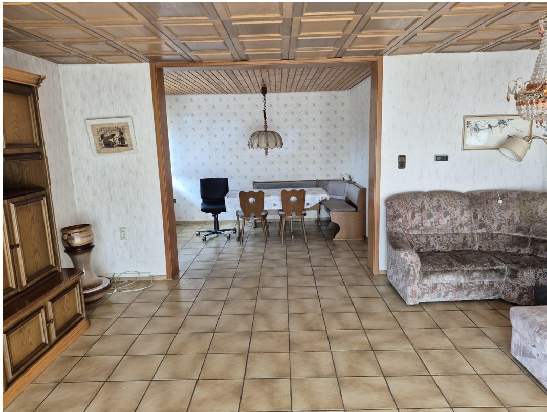
EG Wohn-/Esszimmer 37 m 2