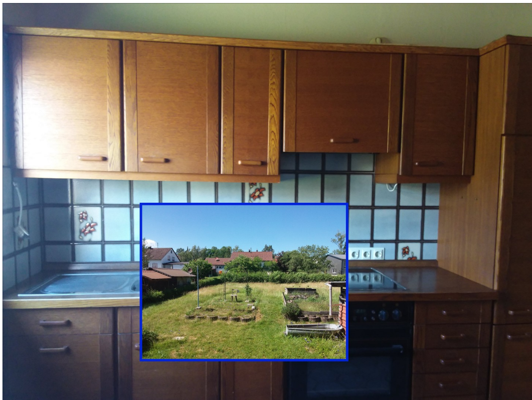
EG Küche 80er Jahre