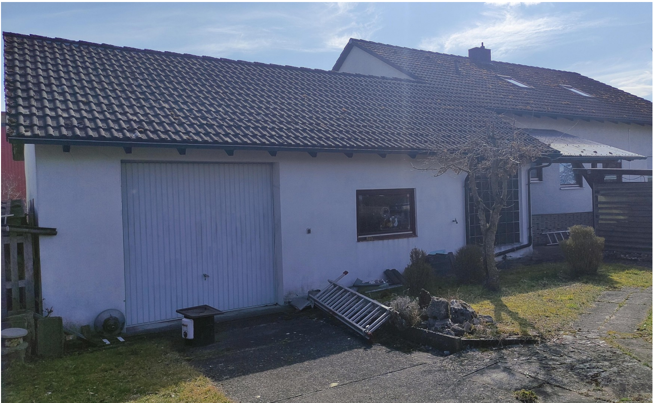
Garage Nordtor und Fenster