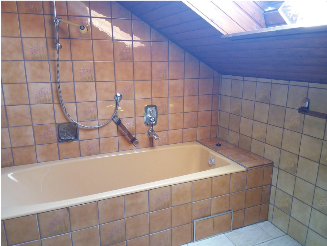
OG Bad mit Wanne