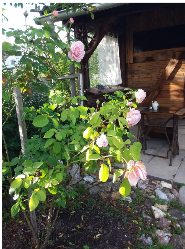
Sitzplatz vor Gerätehütte