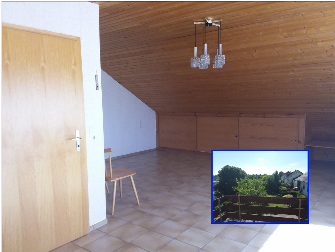
OG Studio mit Balkon