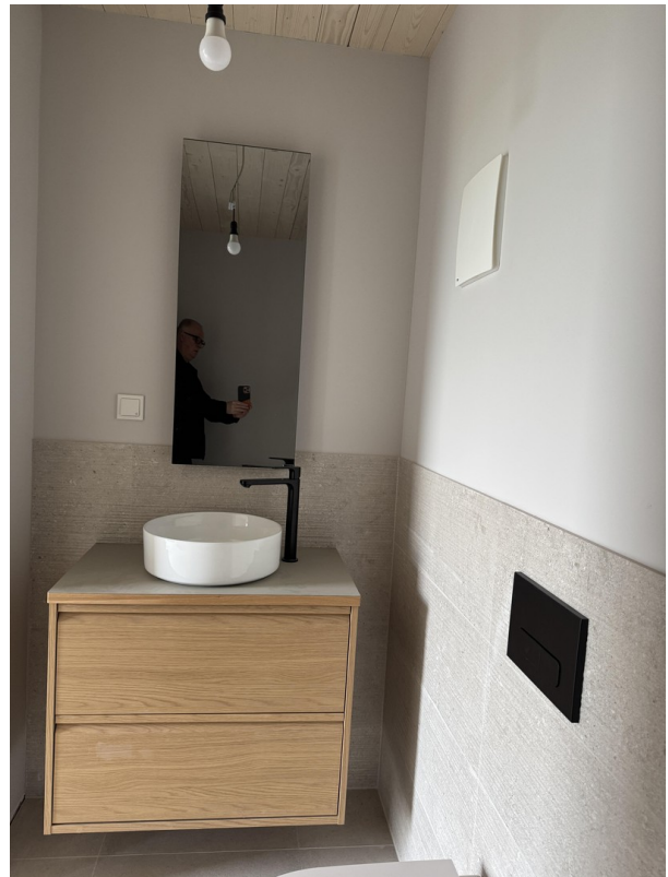
WC mit Waschtisch