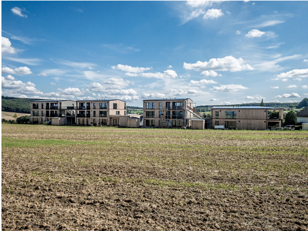
Blick vom Fussweg