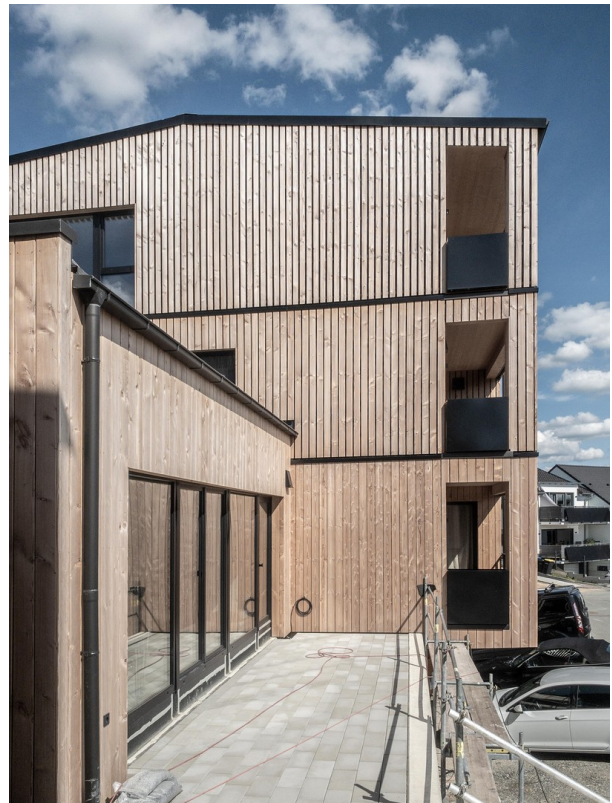
Seitenansicht mit Balkonen