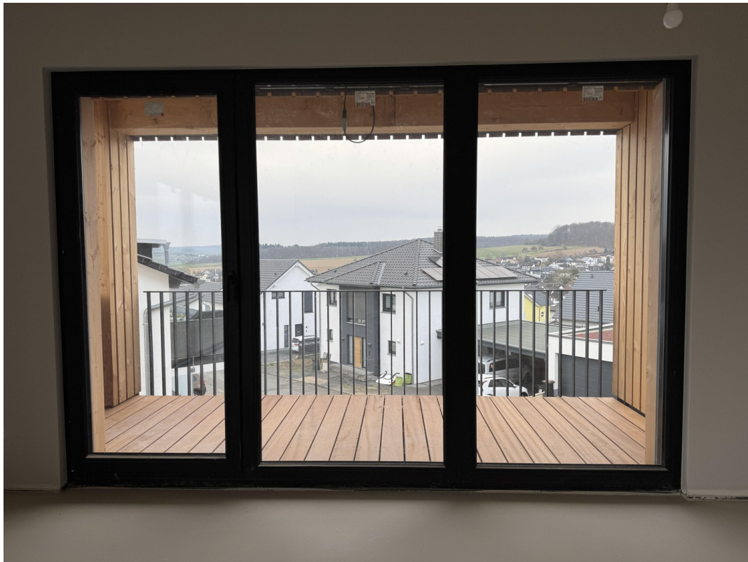
Schlafzimmer mit Balkonblick