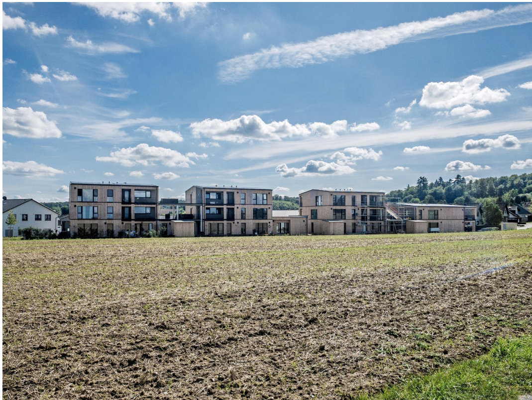
Blick über den Acker