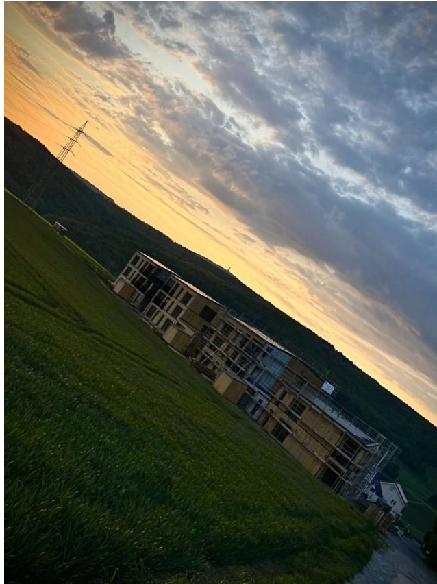
Sonnenaufgang am Wohnprojekt