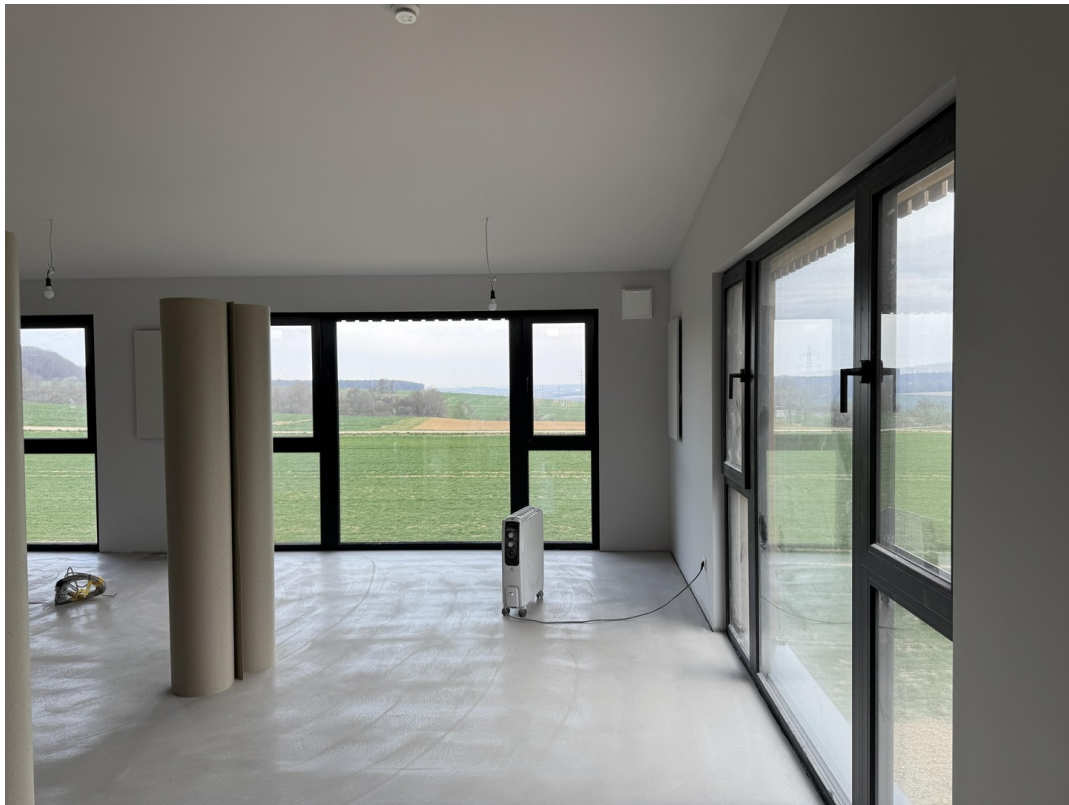
Überall toller Rundumblick