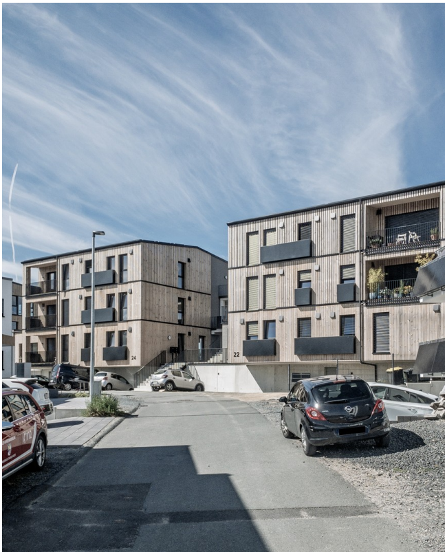
Straßenansicht Haus 24-22