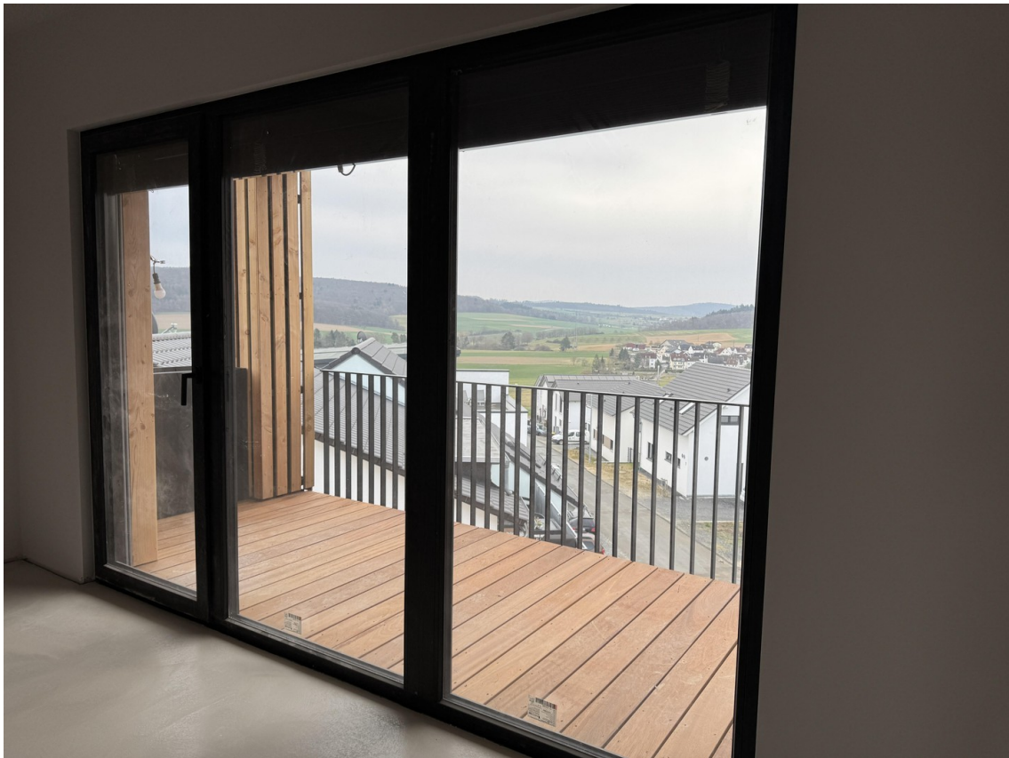
Blick Schlafzimmer + Balkon