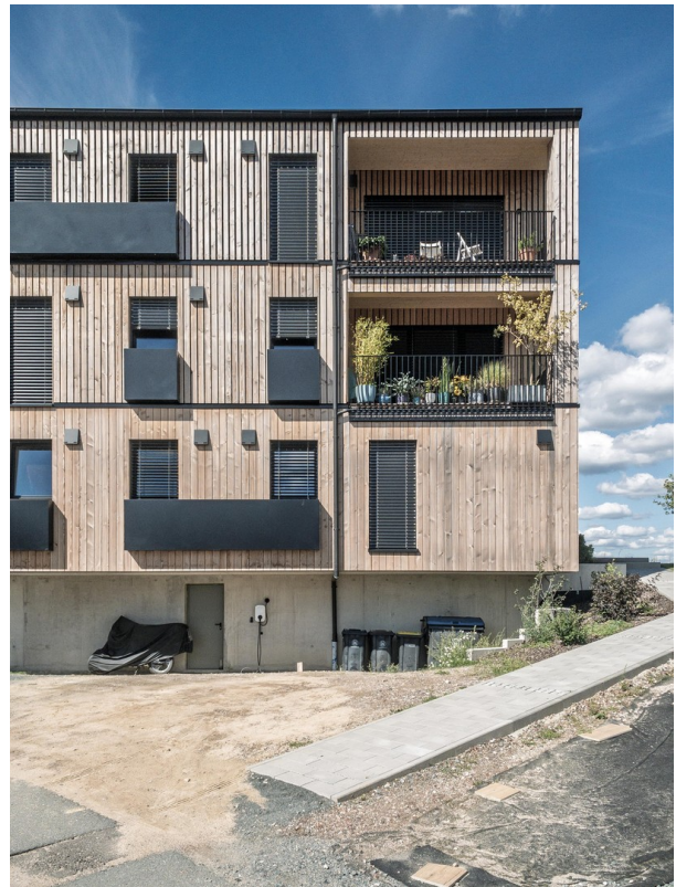
Balkone Haus 22