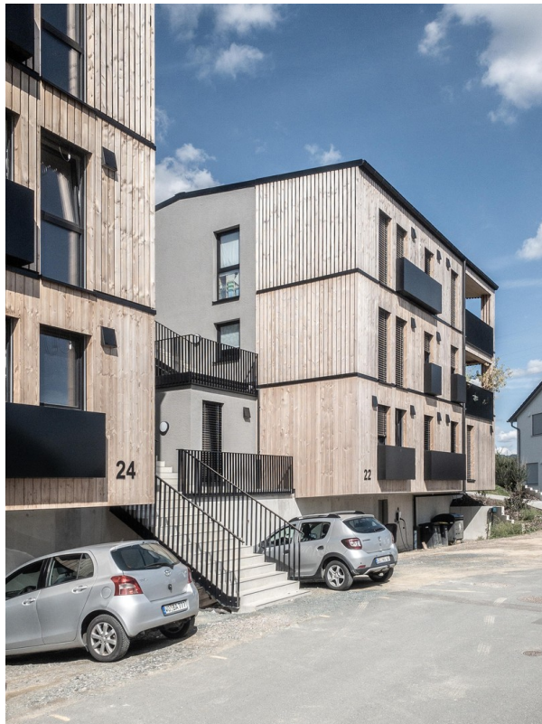
Haus 24+22 mit Treppenanlage