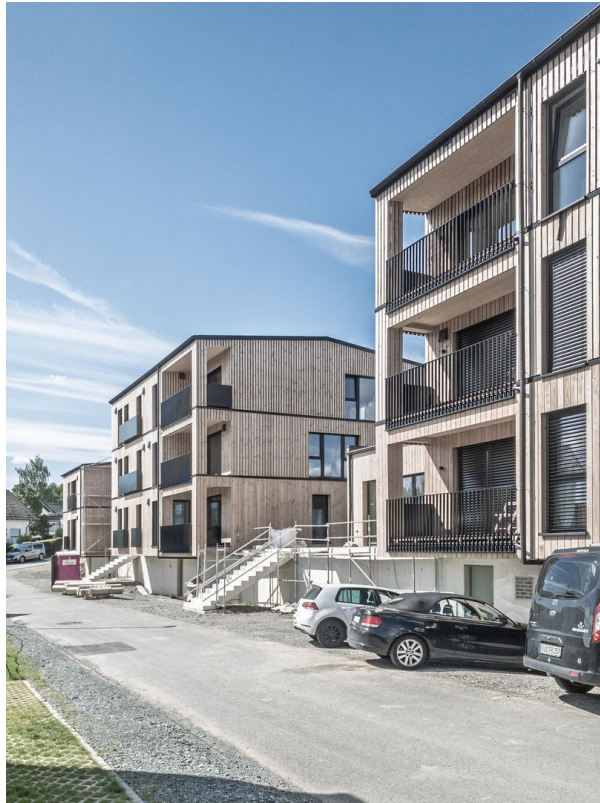
Strassenansicht Haus 28+26+24