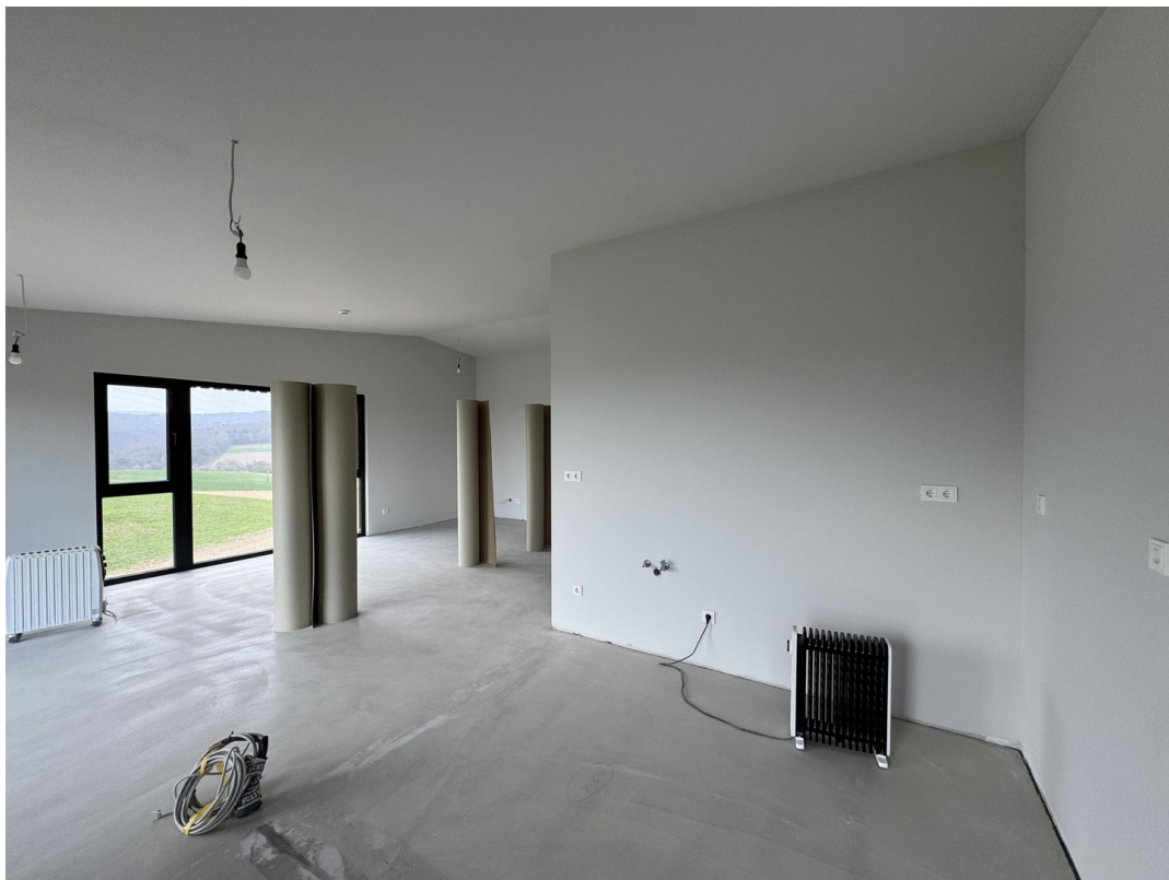
Blick vom Eingang