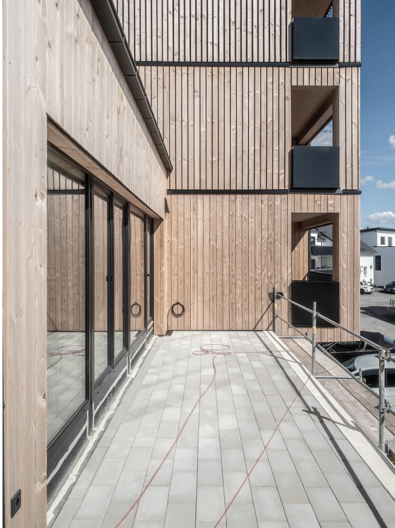
links - Gemeinschaftsraum