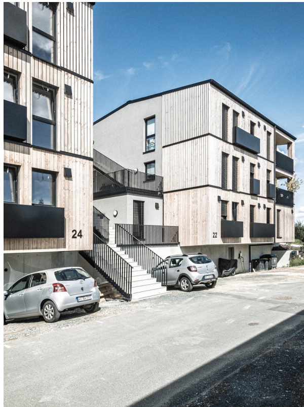
Haus 24+22 mit Treppenanlage