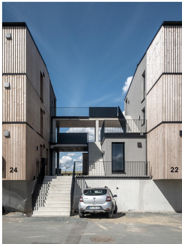
Treppenturm mit Gem.Balkonen