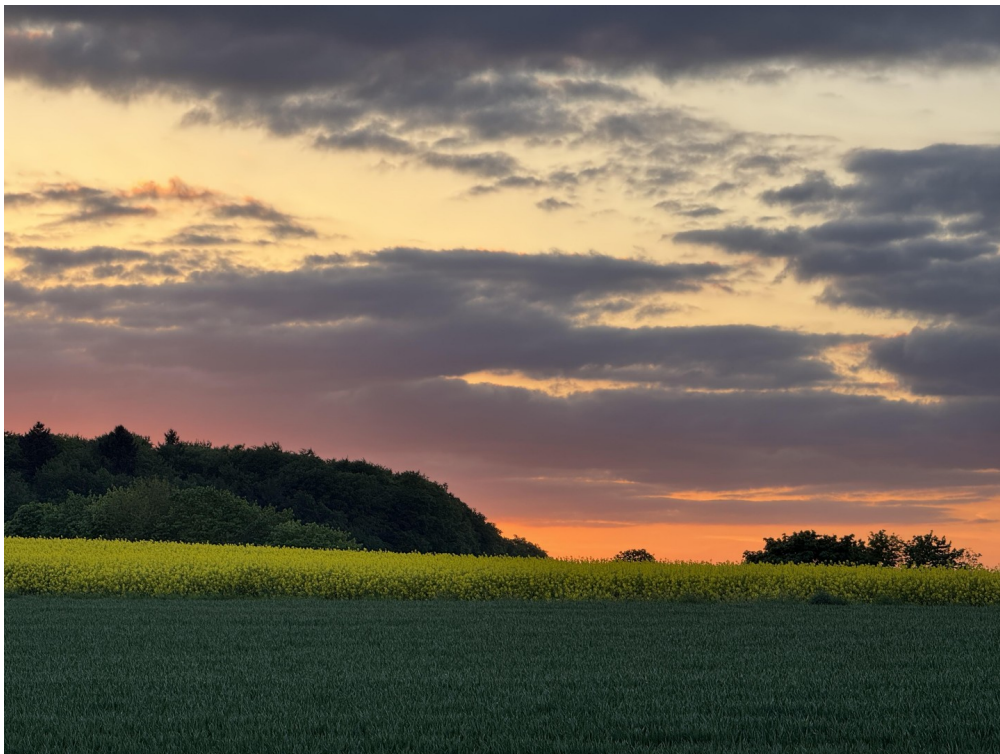
Sonnenuntergang vom EG