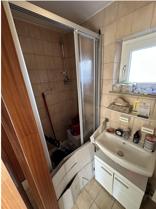
Bad mit Dusche und Toilette