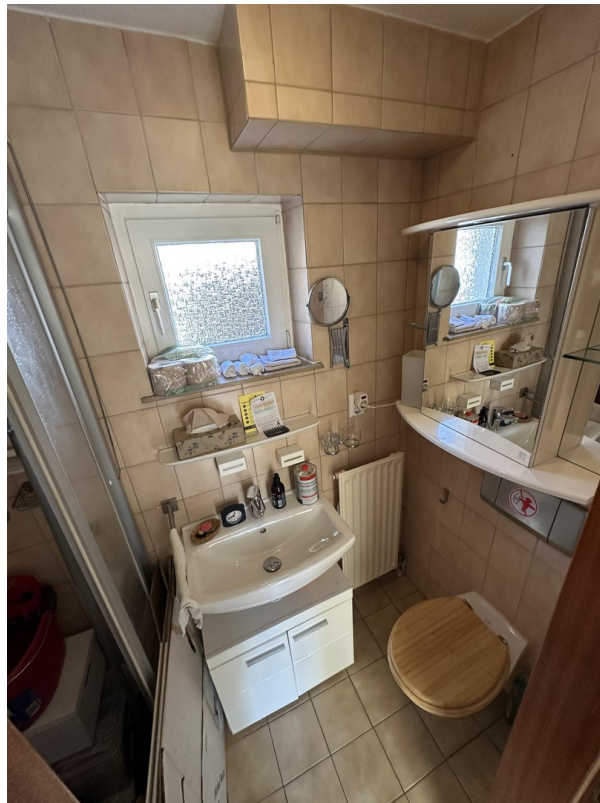
Bad mit Dusche und Toilette