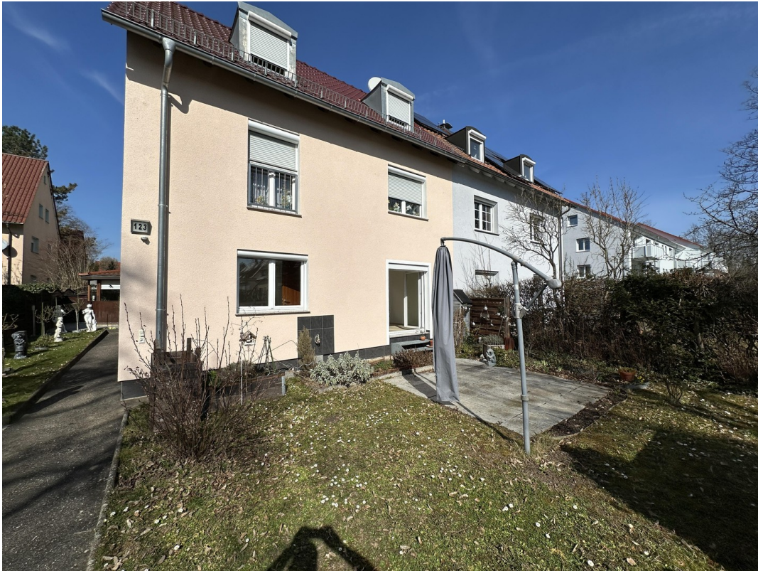
Ansicht Zugang Haus