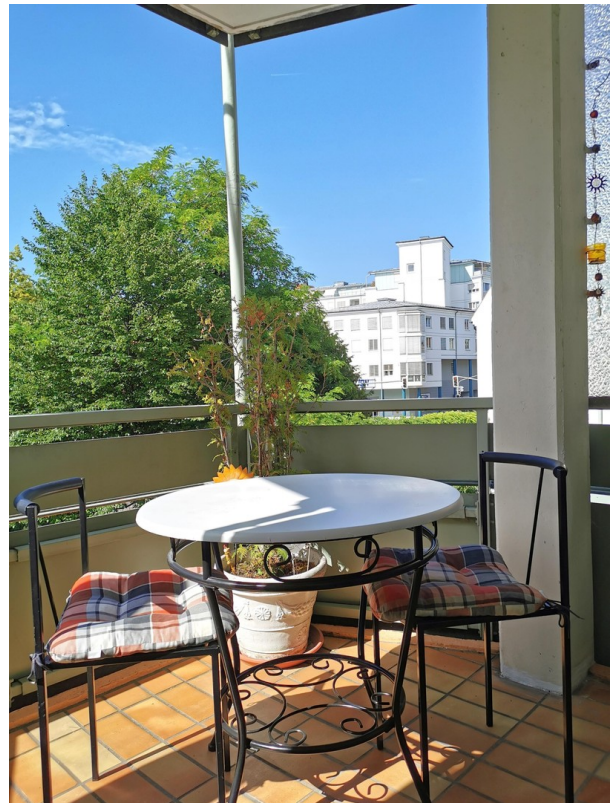
Einblick nach Aussen