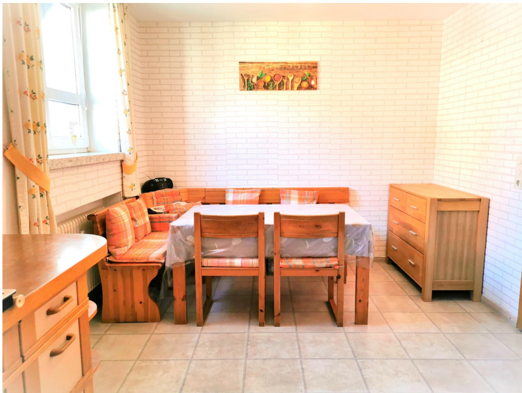
Essplatz / Küche