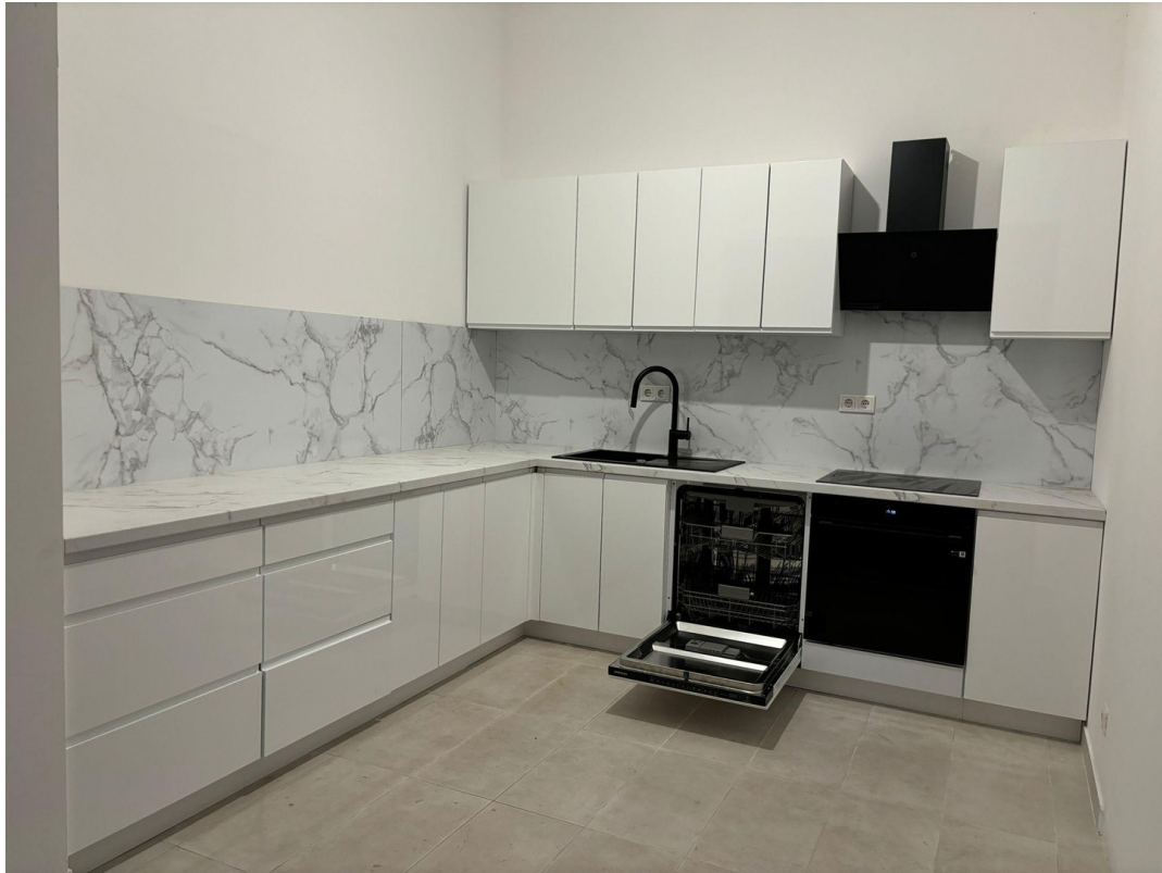
Samsung Geräte Neu