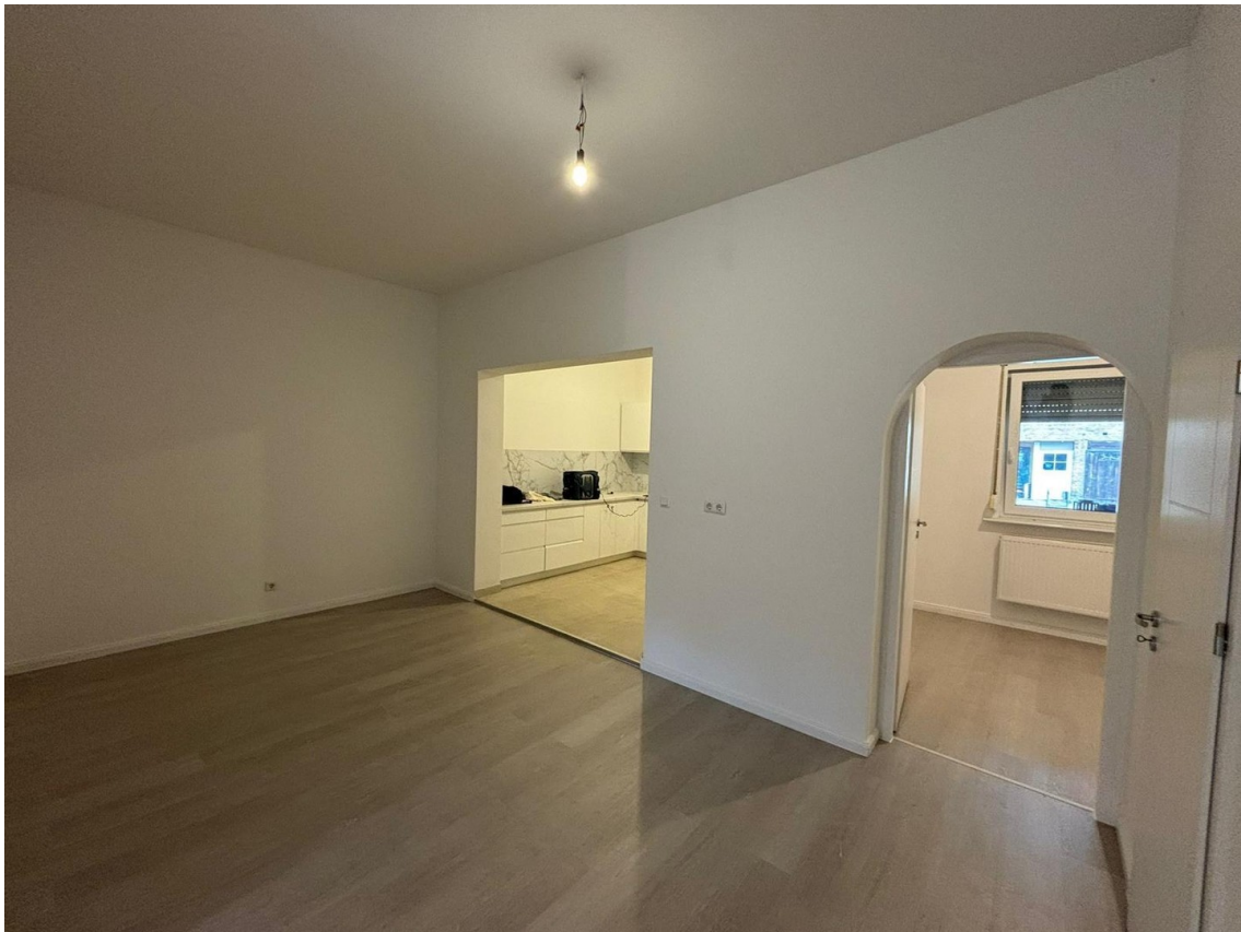
Wohnzimmer und Blick ins SZ