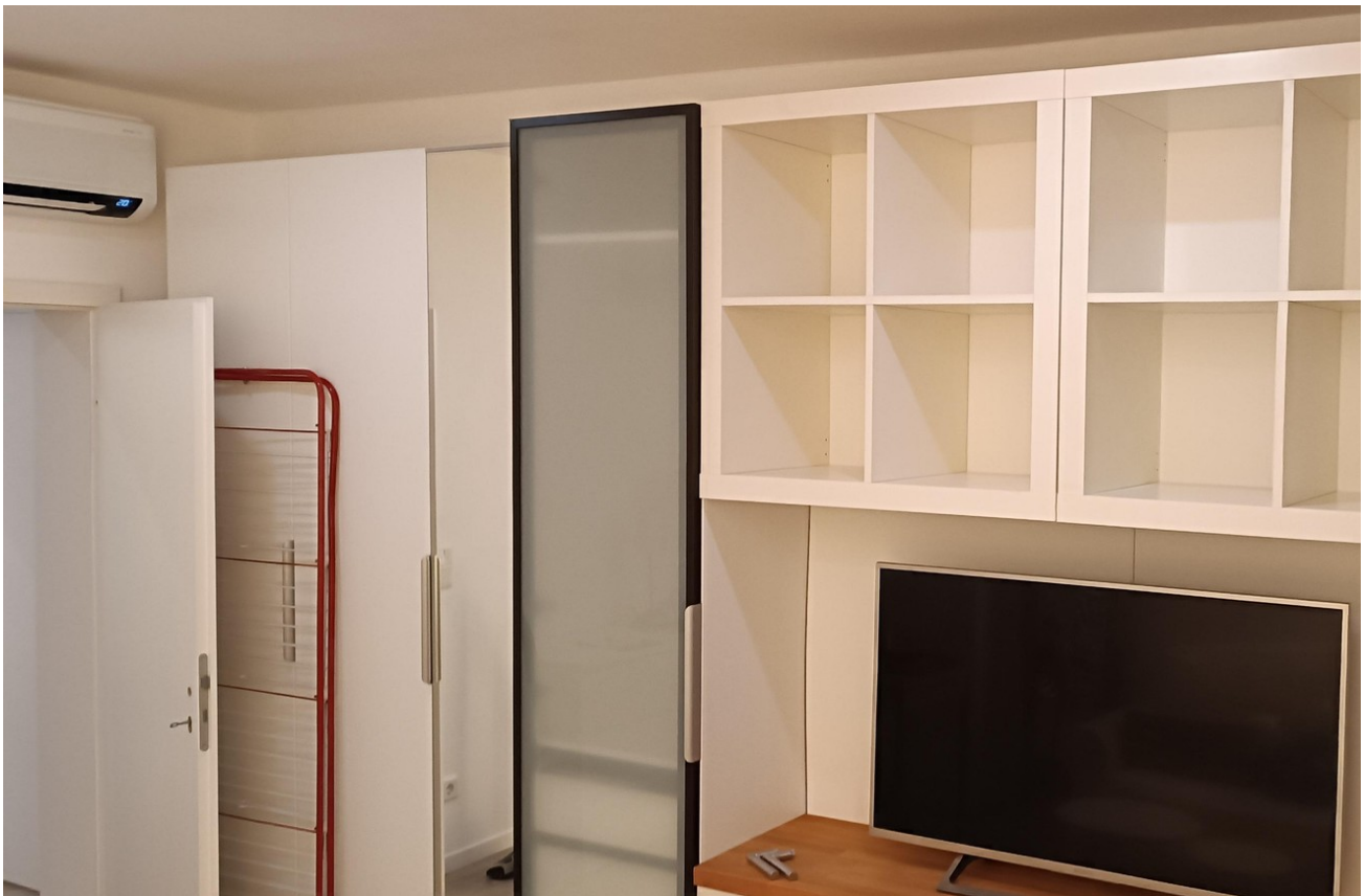
Wohn und Schlafbereich mitte