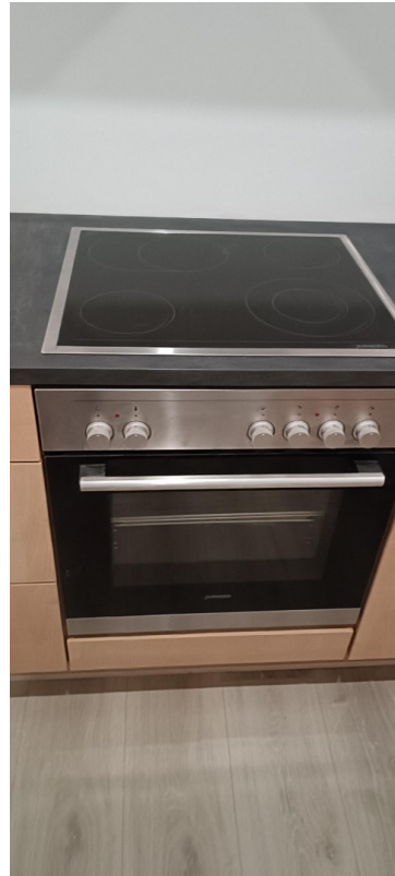
E-Herd inkl Cerankochfeld