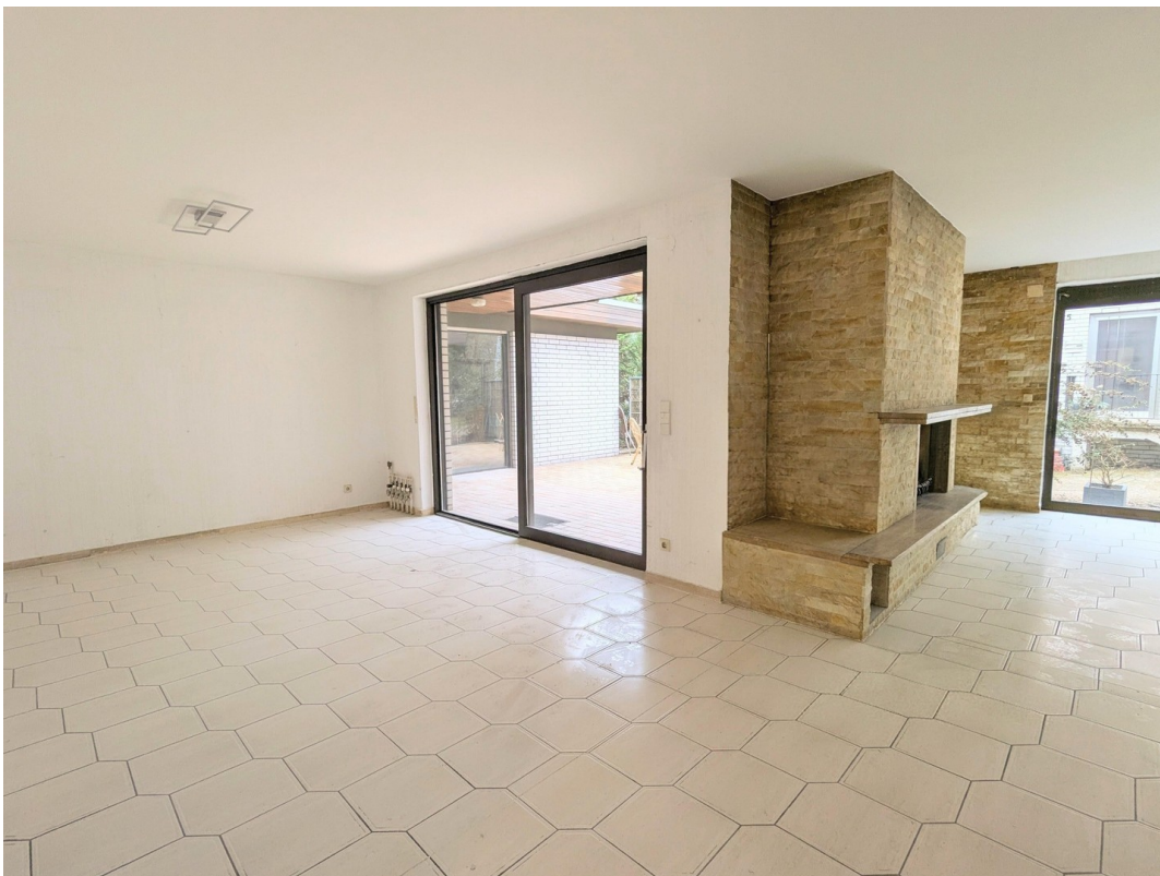
Ess- und Kaminzimmer