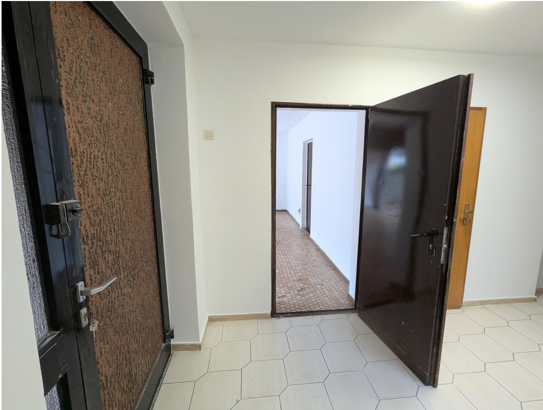
.....mit Verbindungstür Flur