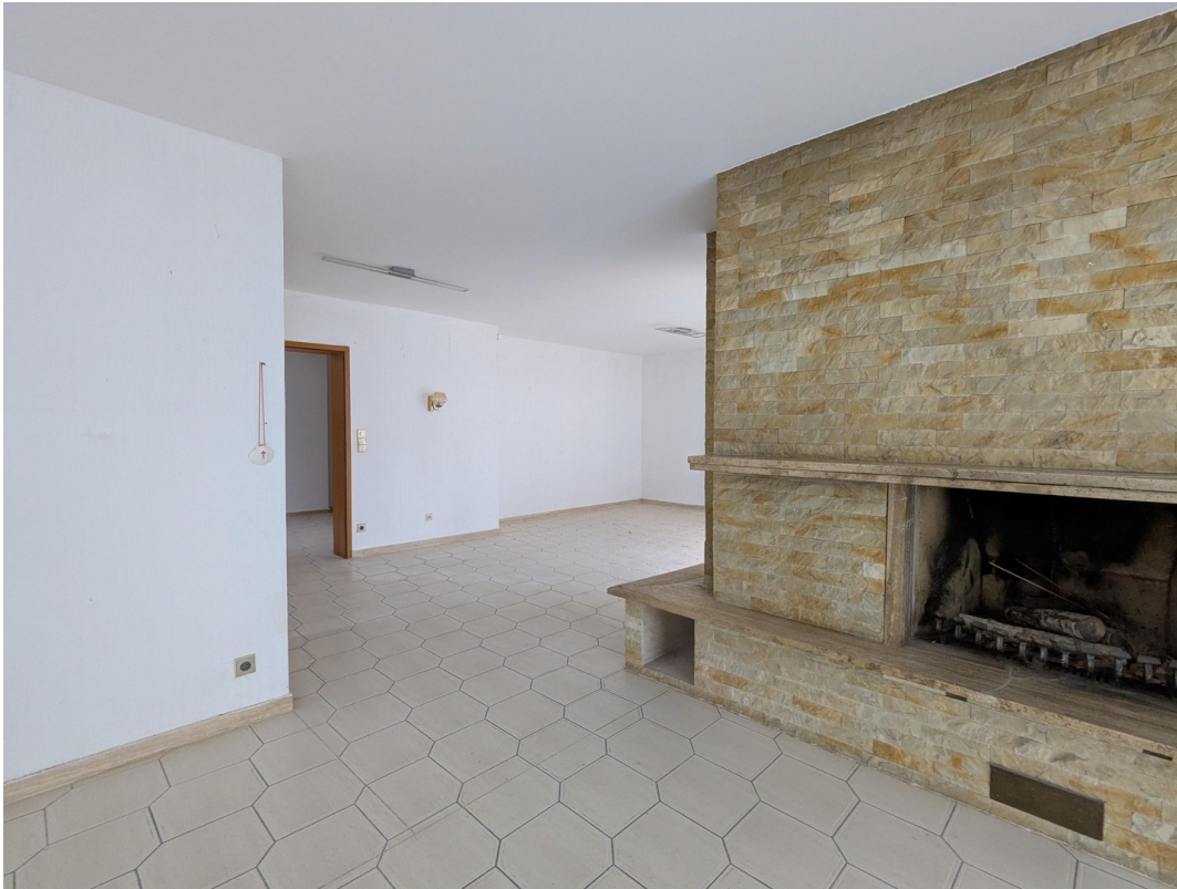
Durchgang zum Esszimmer