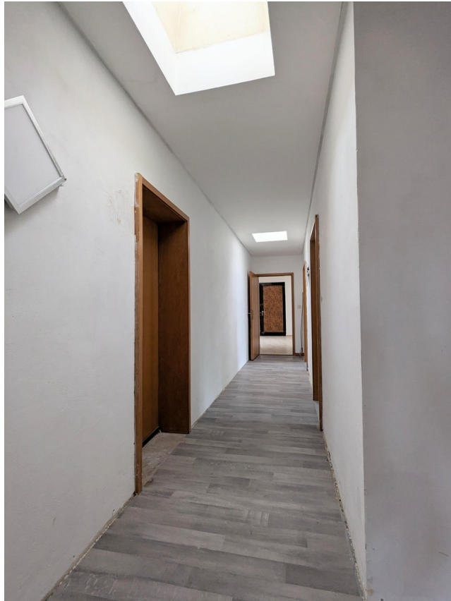
Flur zu den Zimmern