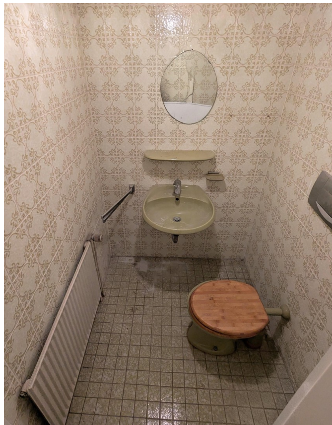
WC im Keller