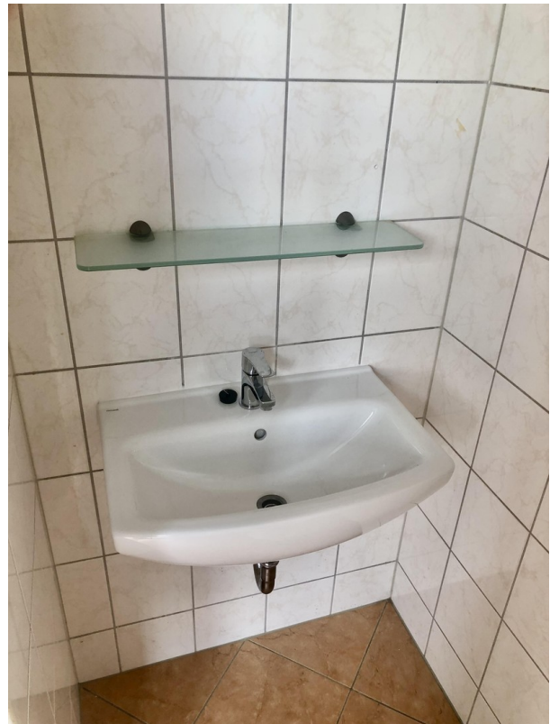
Gäste WC 1.OG