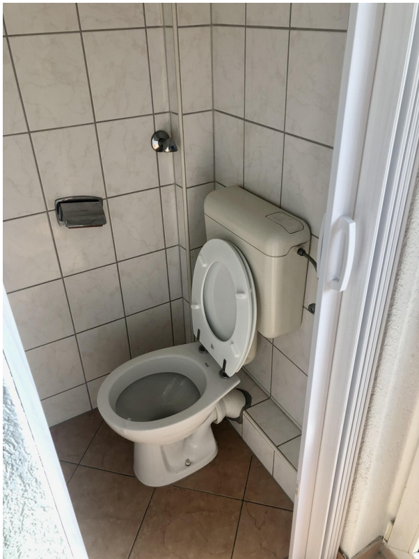
Gäste WC 1.OG