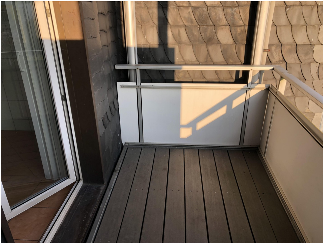
Balkon 1. OG