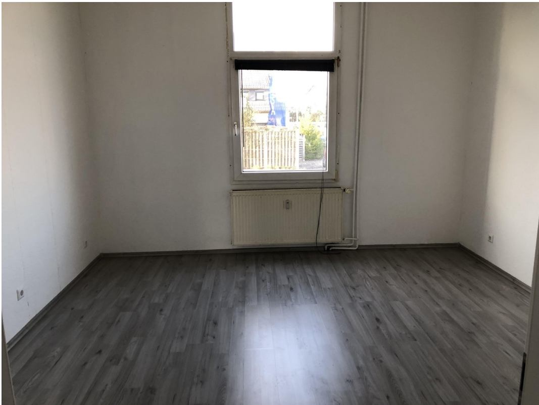
Schlafzimmer 1. OG