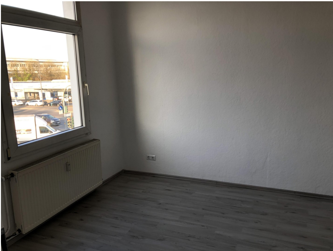
Schlafzimmer 1 OG