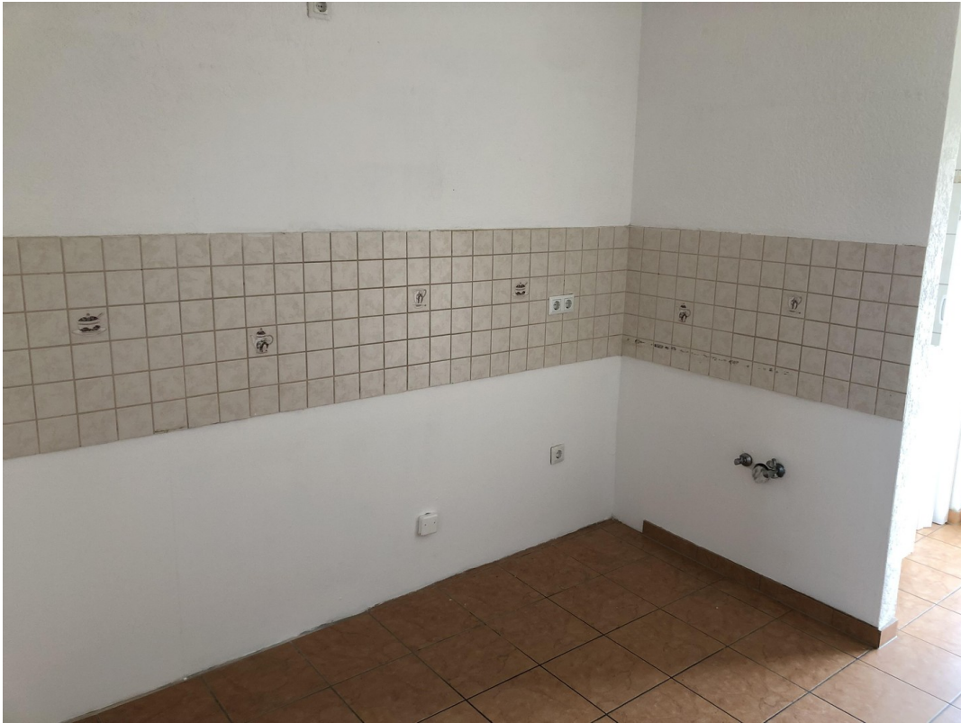
Küche 1. OG