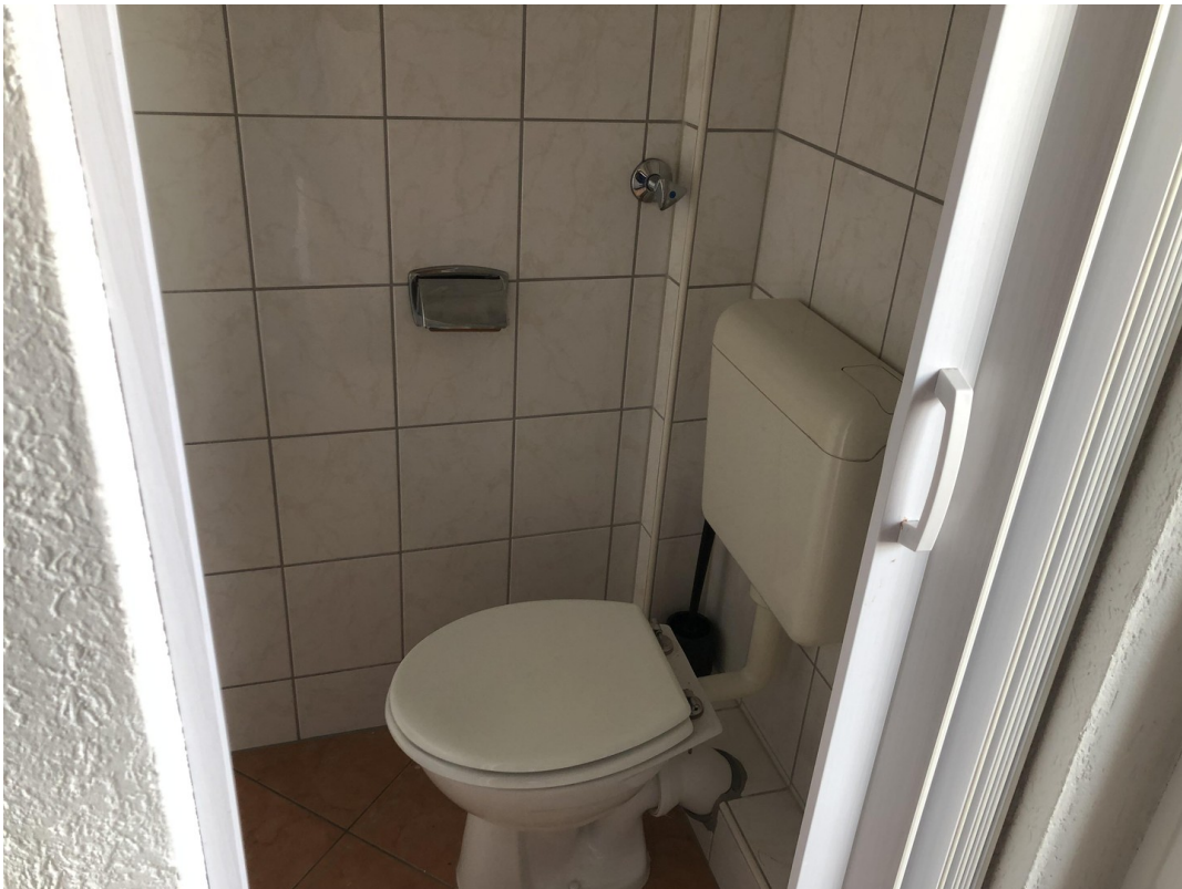
Gäste WC 1. OG