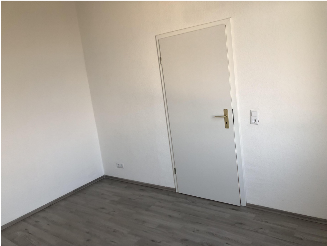
Schlafzimmer 1 OG