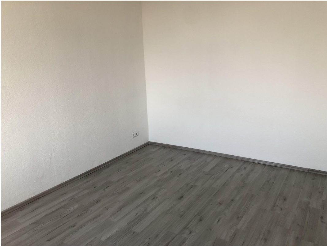
Schlafzimmer 1 OG