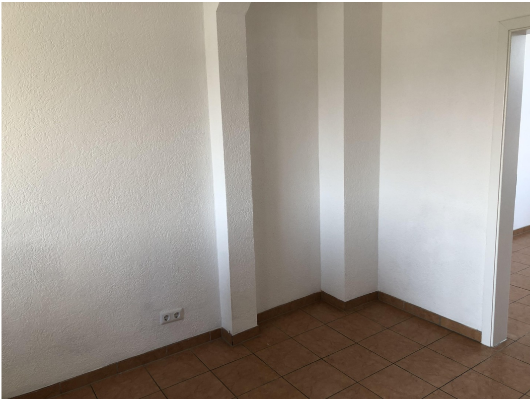
Küche 1. OG