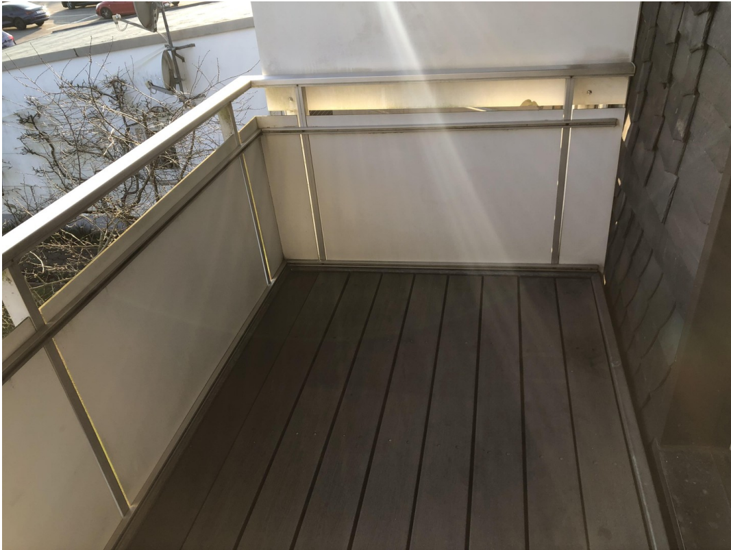
Balkon 1. OG