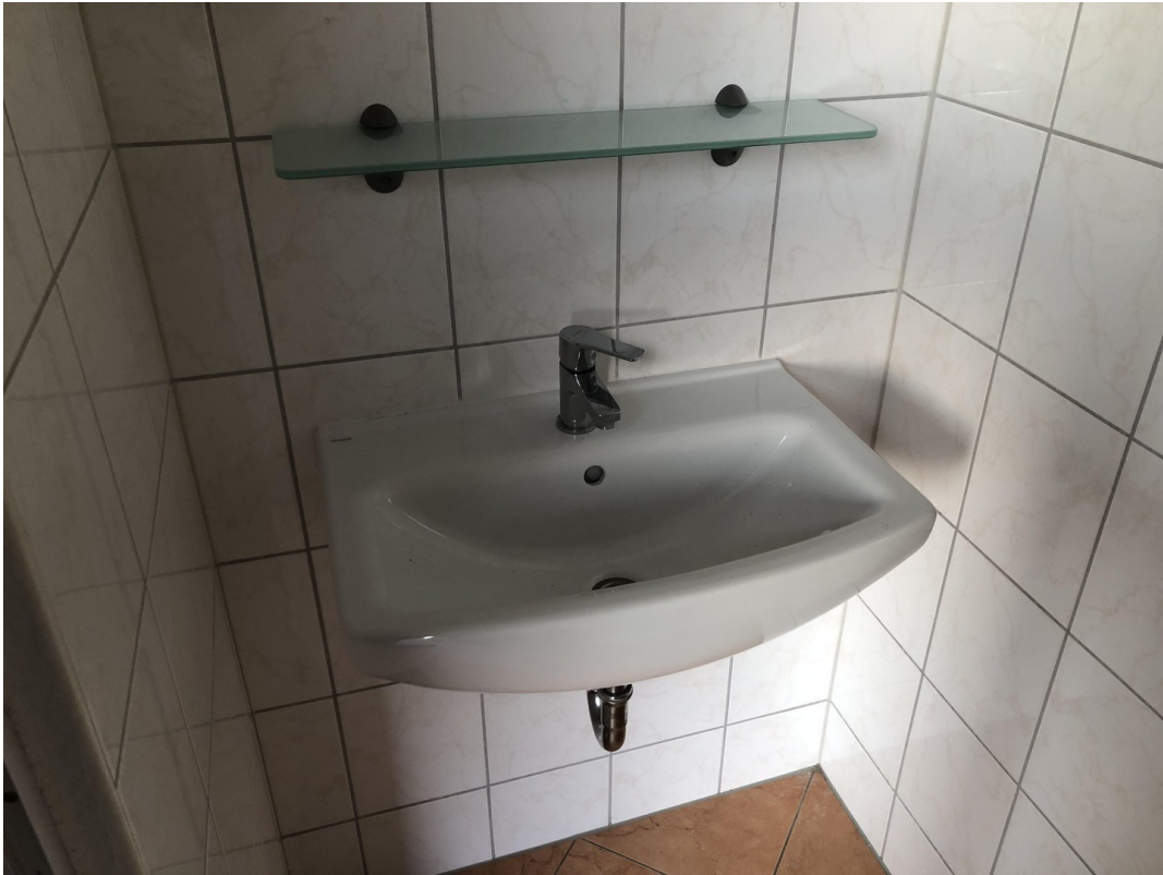
Gäste WC 1. OG