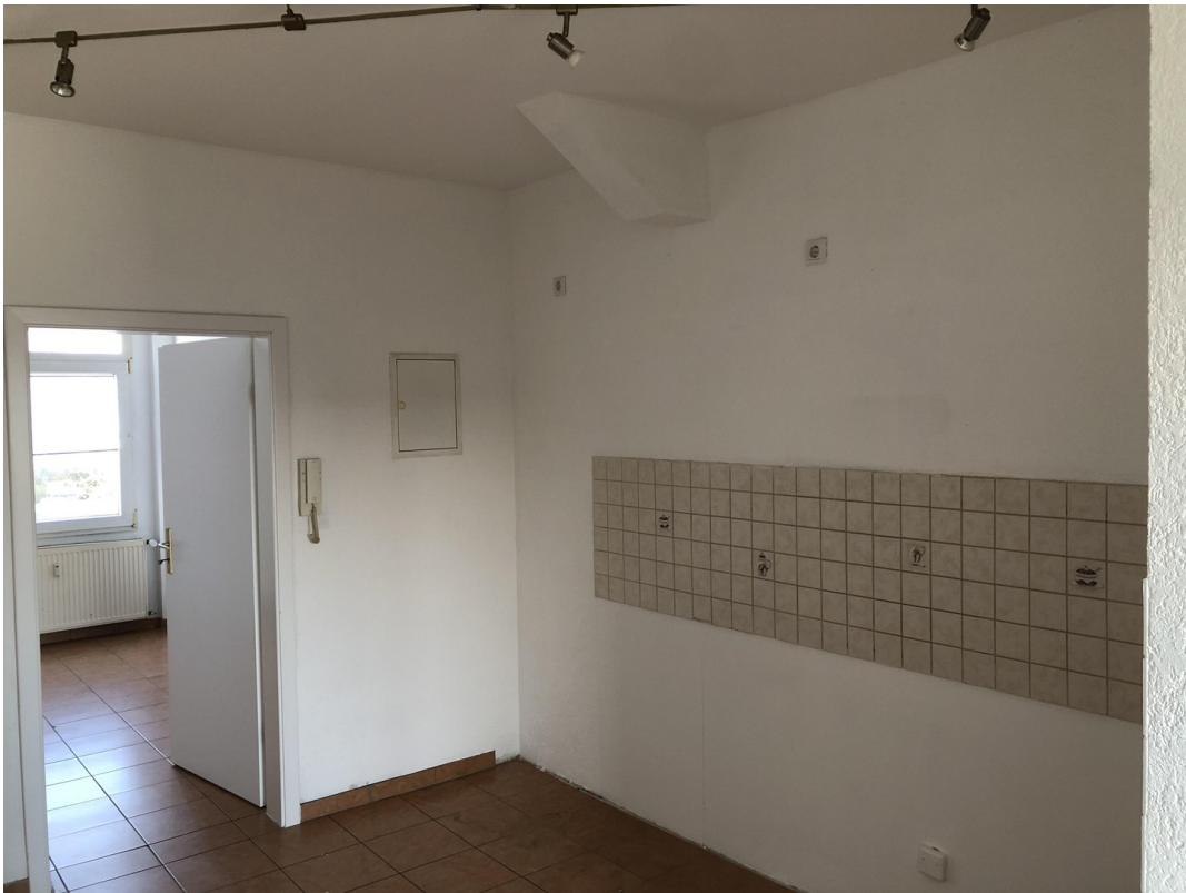
Küche 1. OG