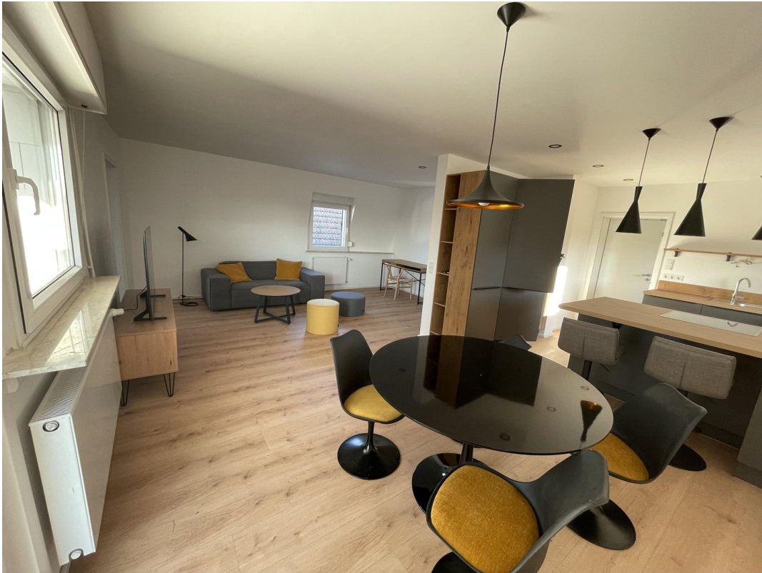
Essbereich mit Kochinsel