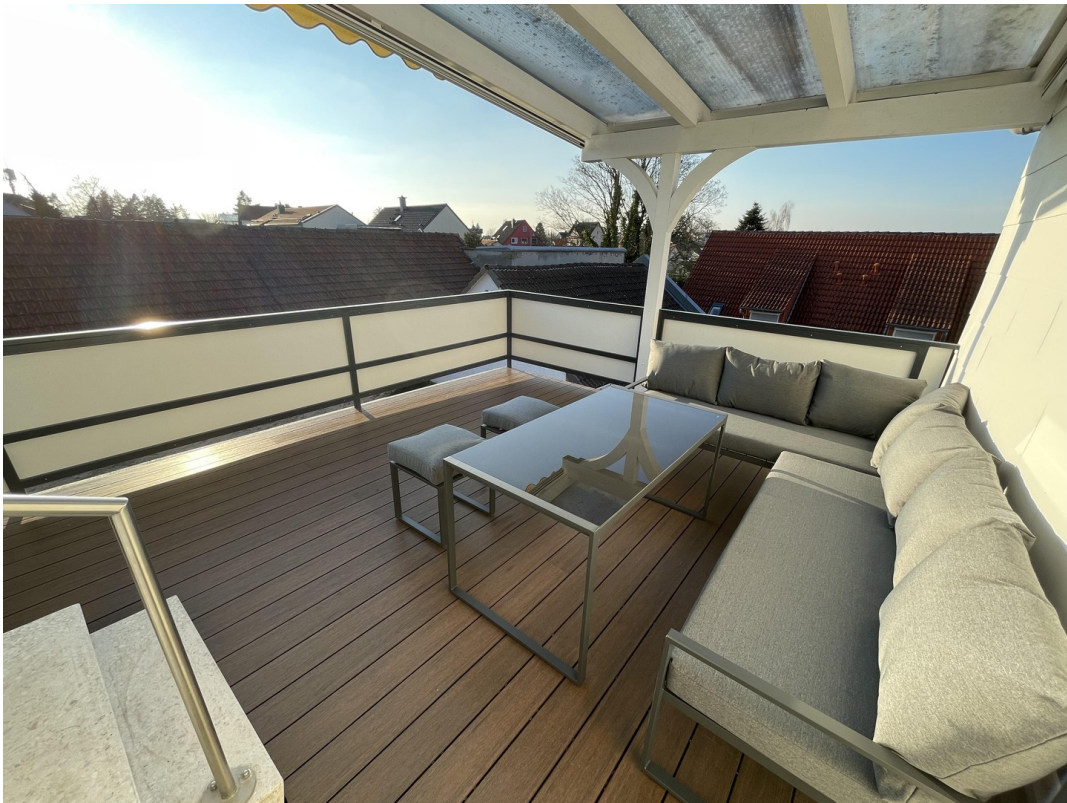
Große Terrasse mit Blick