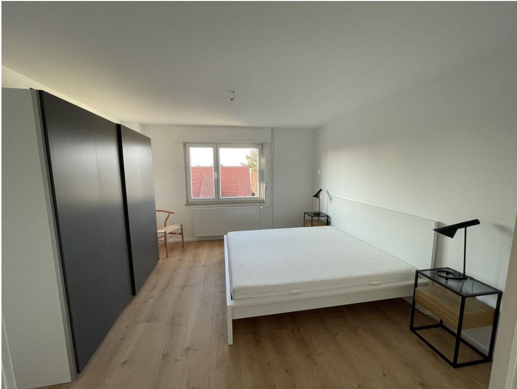
Schlafzimmer mit großem Bett