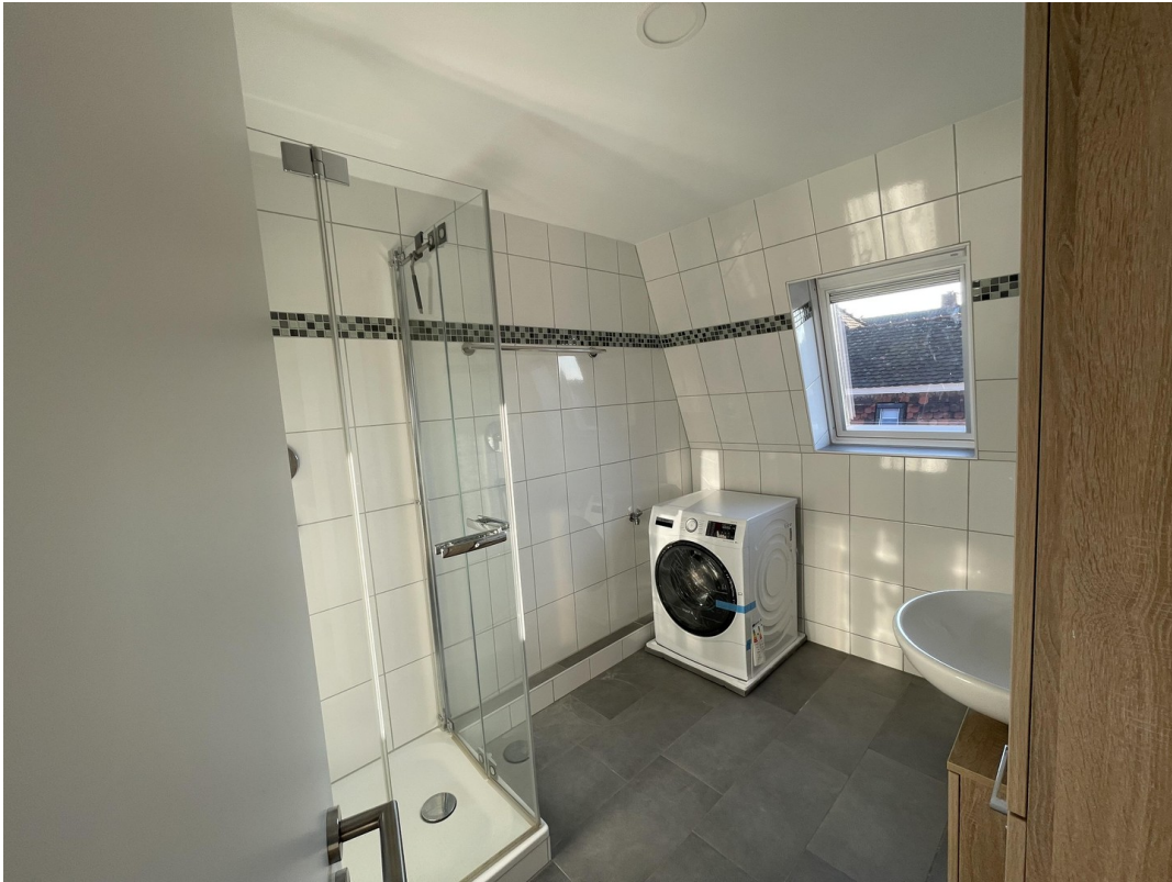
Duschbad mit Waschmaschine