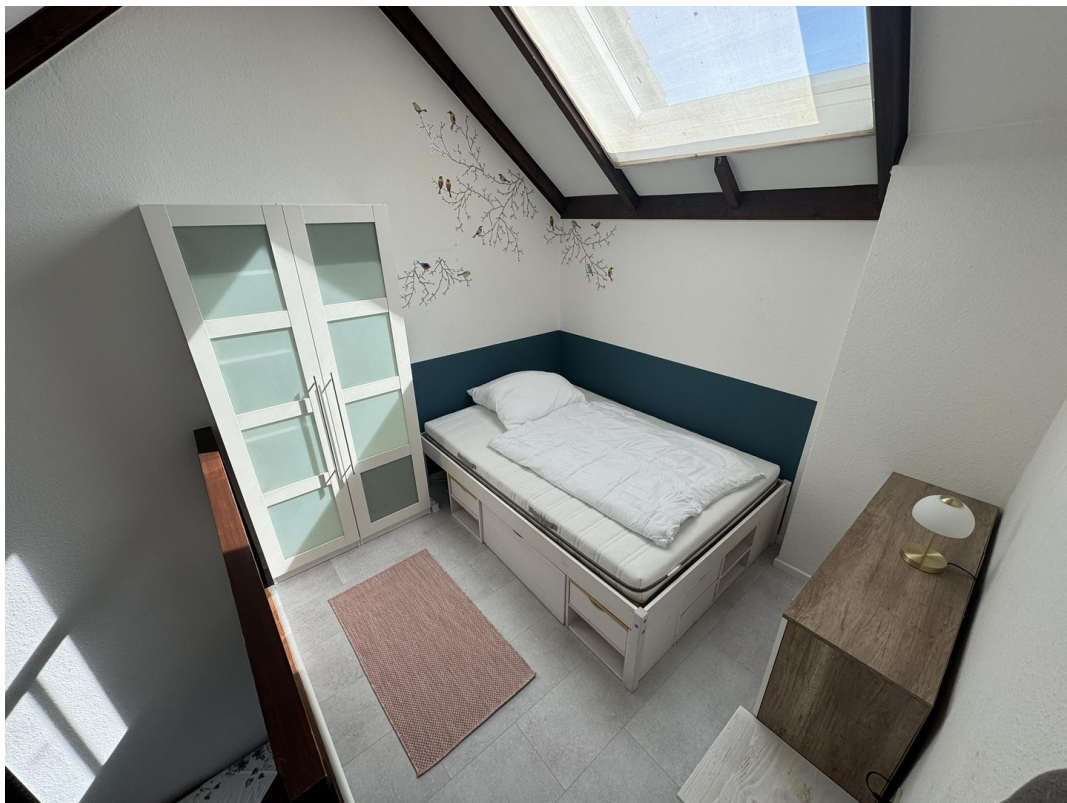
Empore mit Schlafgelegenheit