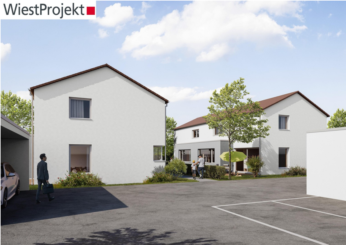
Römerstr. 47c Attenhofen