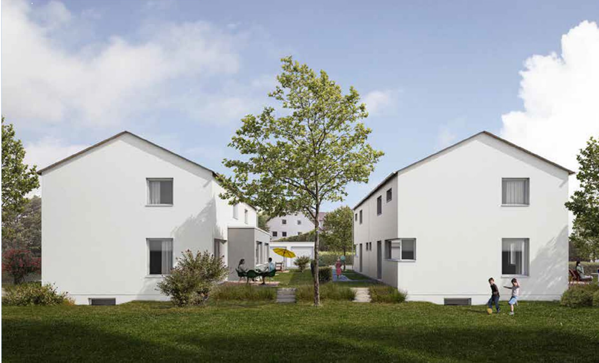
Römerstr. 47c Attenhofen