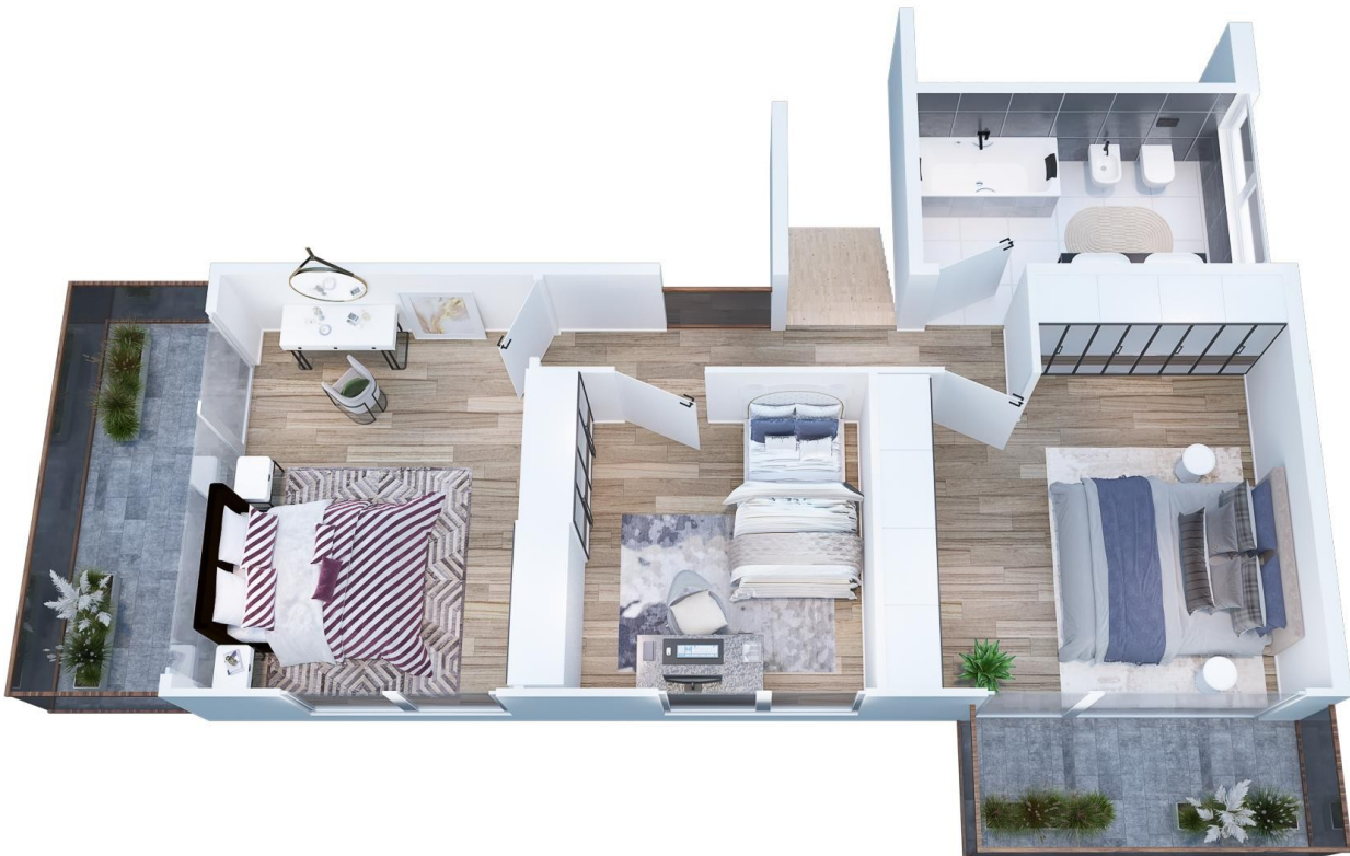
3D Grundriss OG (Planung)