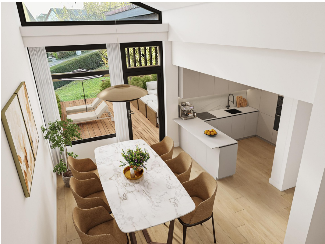
Essbereich mit offener Küche