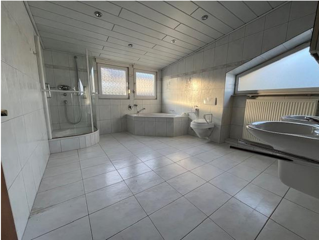
Bad ca 14 qm