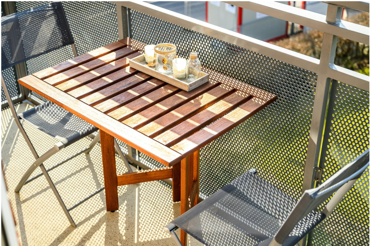
Balkon - Ansicht #2