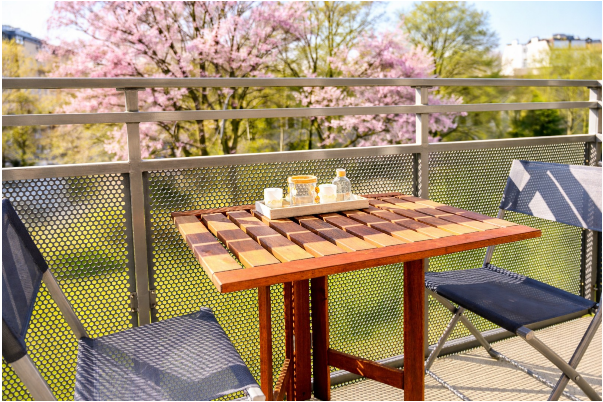
Balkon - Ansicht #1