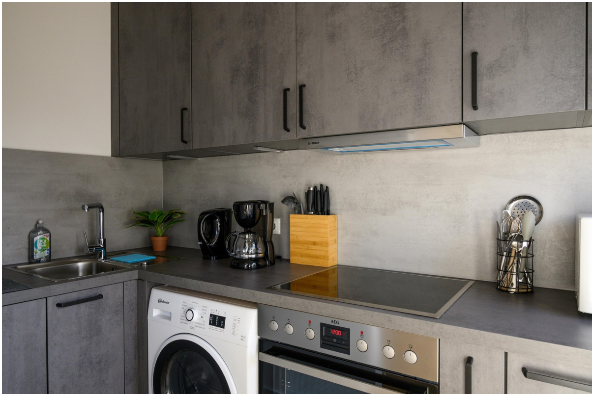
Küche - Ansicht #3