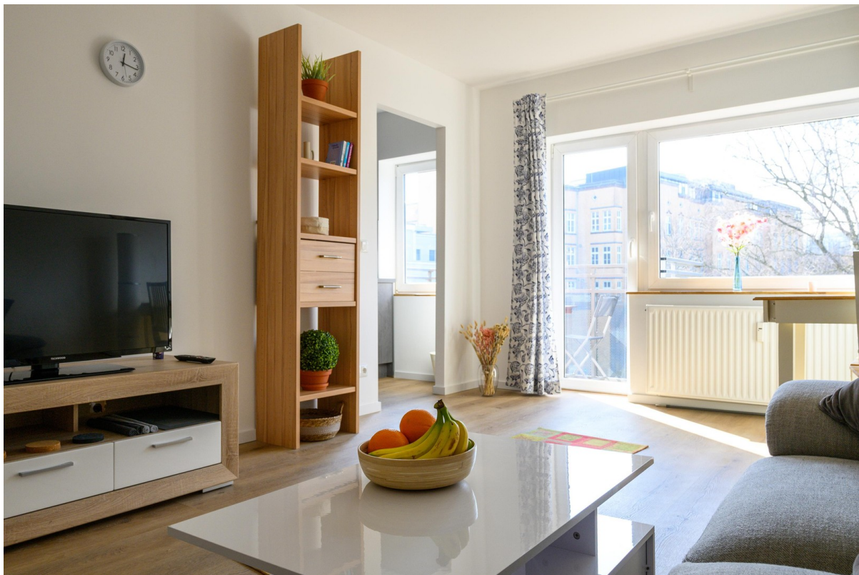
Wohnzimmer - Ansicht #6