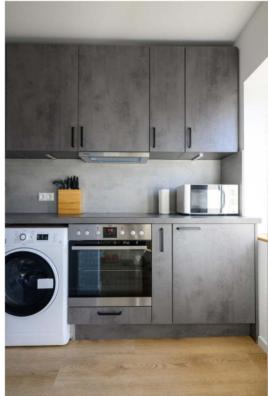
Küche - Ansicht #2