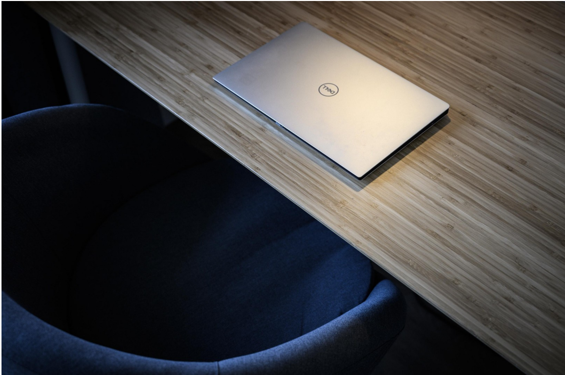
Schlafzimmer - Ansicht #10