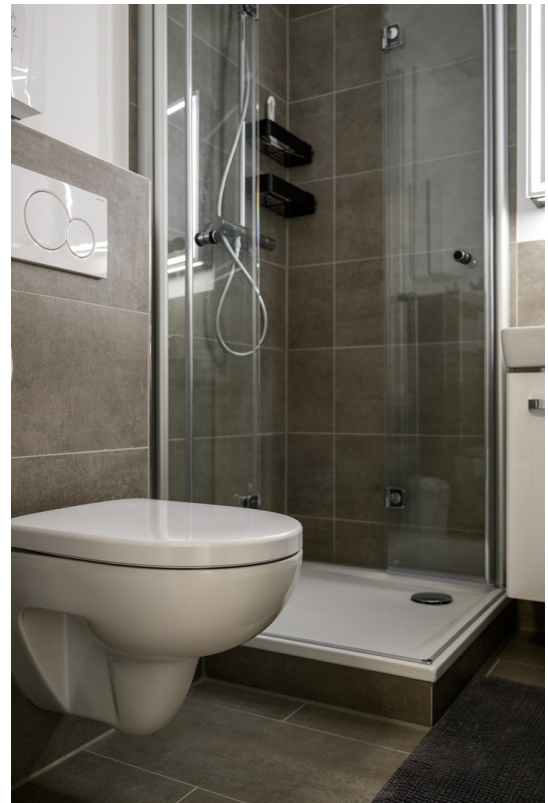
Badezimmer - Ansicht #4