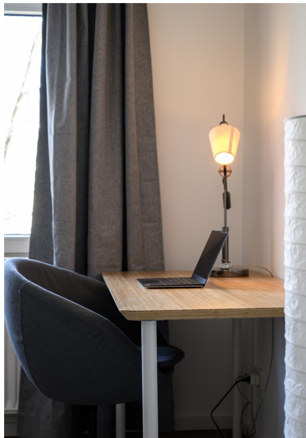
Schlafzimmer - Ansicht #9