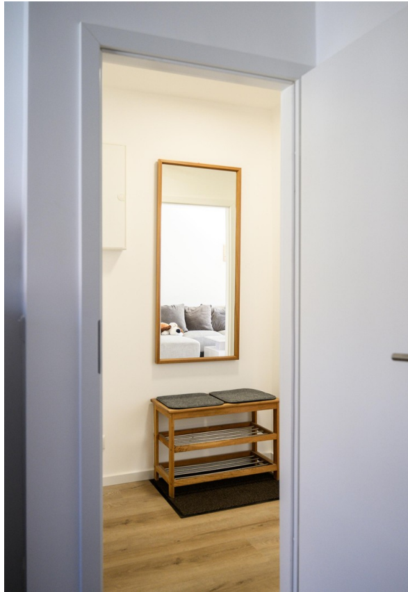
Flur - Ansicht #1