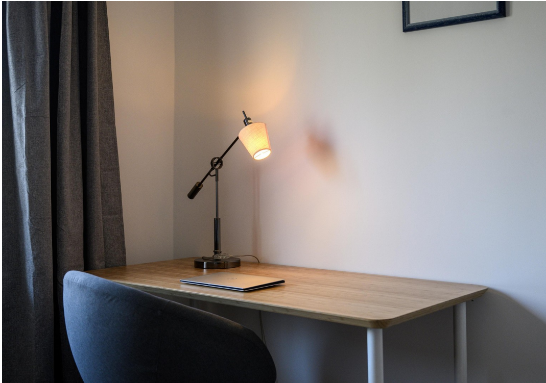
Schlafzimmer - Ansicht #8