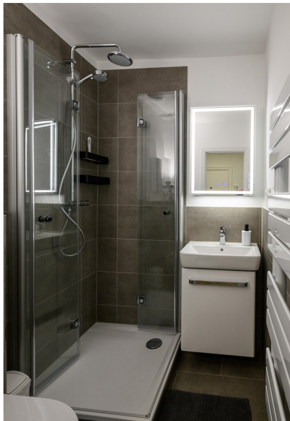
Badezimmer - Ansicht #1