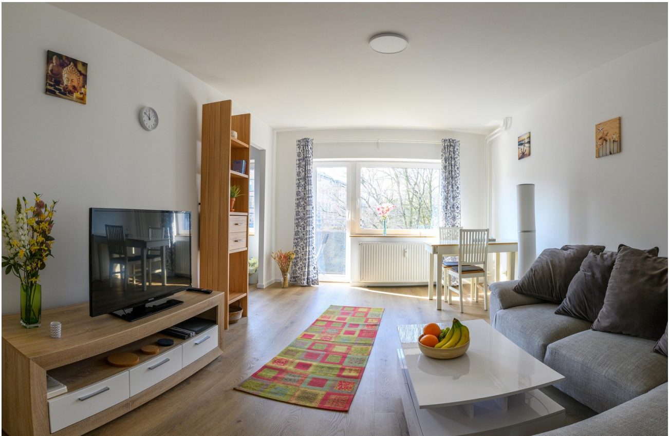
Wohnzimmer - Ansicht #2