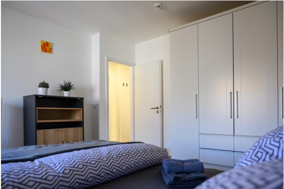
Schlafzimmer - Ansicht #4