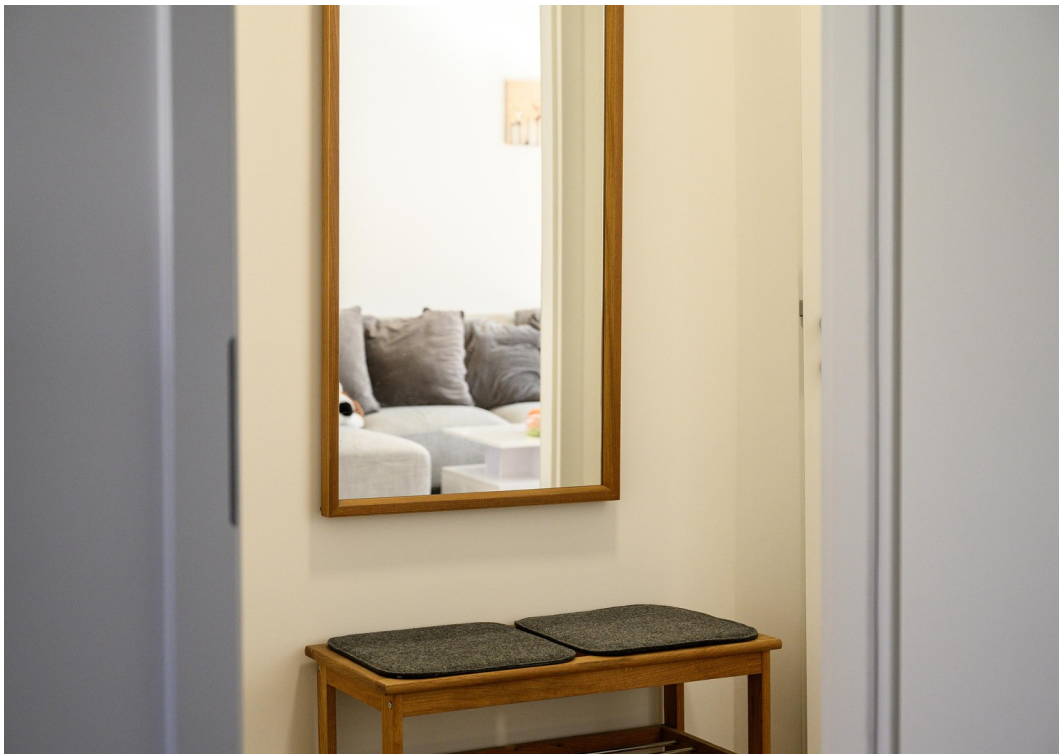
Flur - Ansicht #2