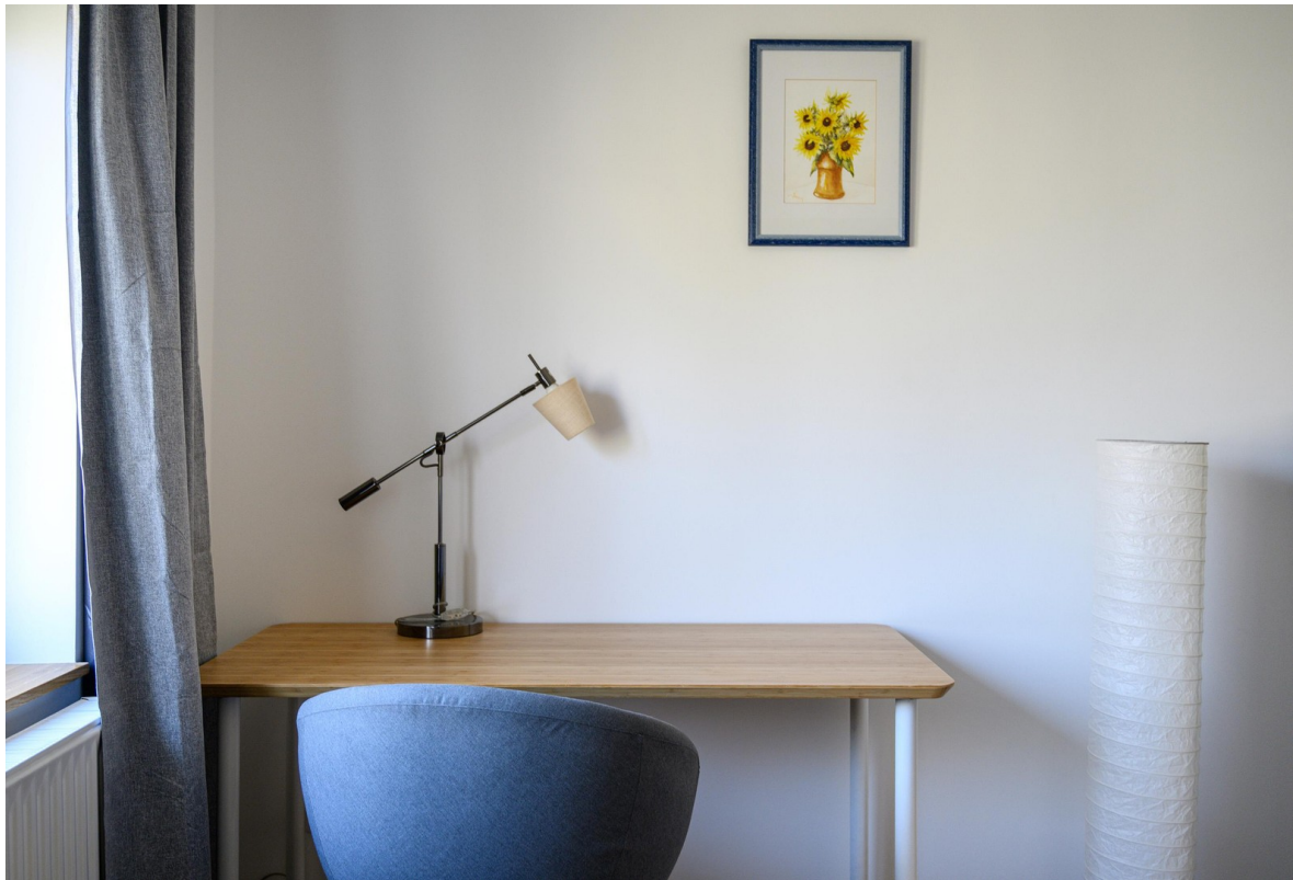
Schlafzimmer - Ansicht #6