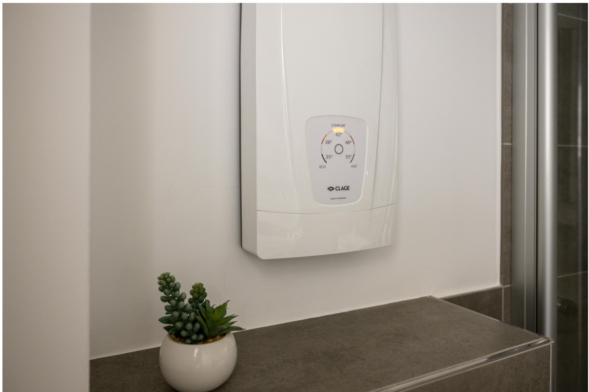
Badezimmer - Ansicht #6