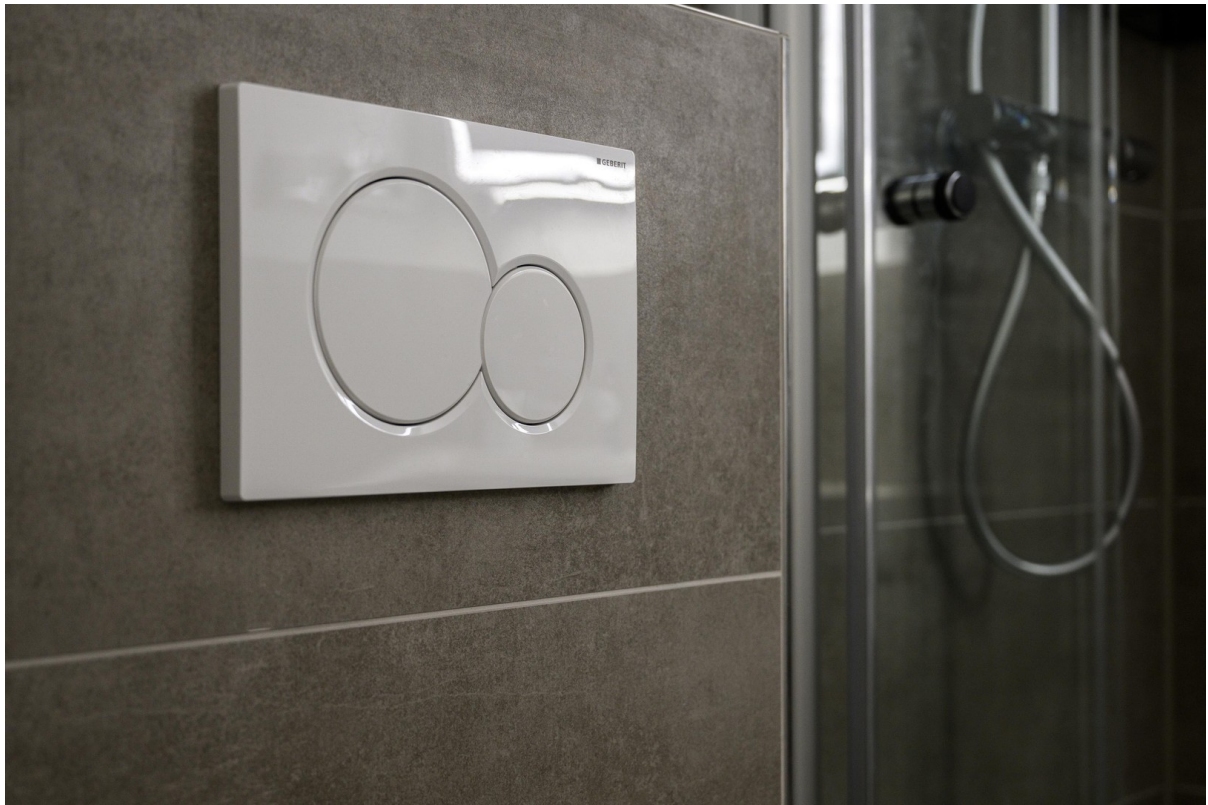
Badezimmer - Ansicht #5