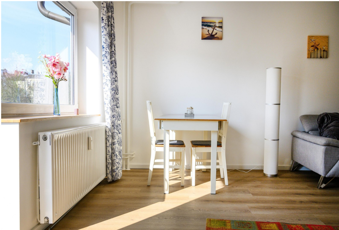
Wohnzimmer - Ansicht #5