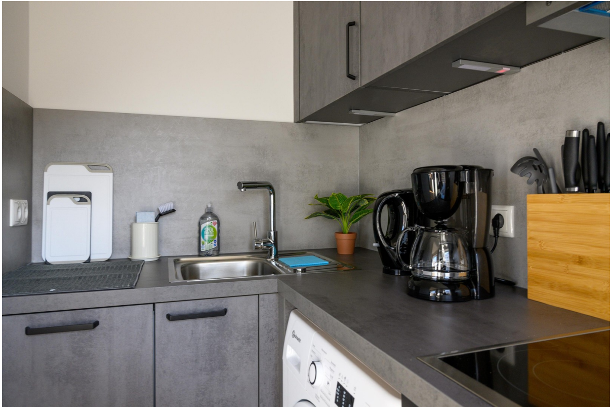
Küche - Ansicht #4