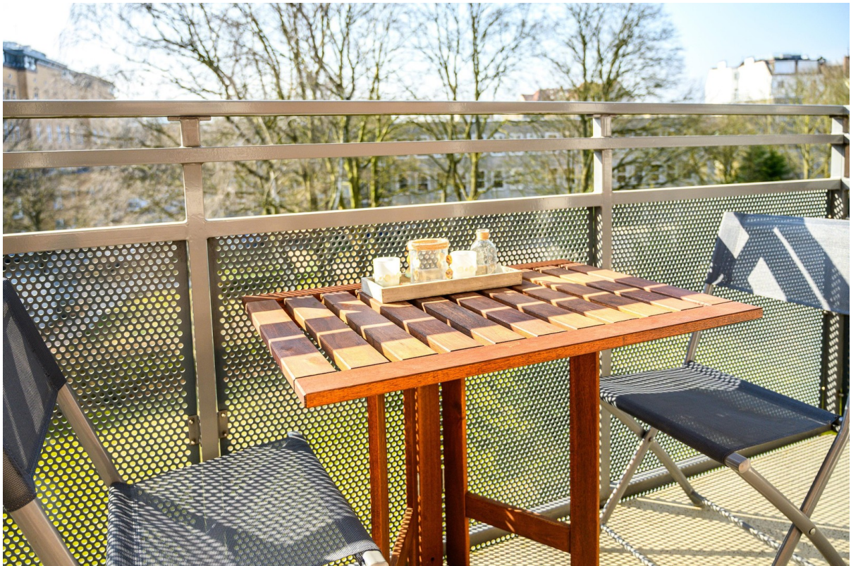
Balkon - Ansicht #2