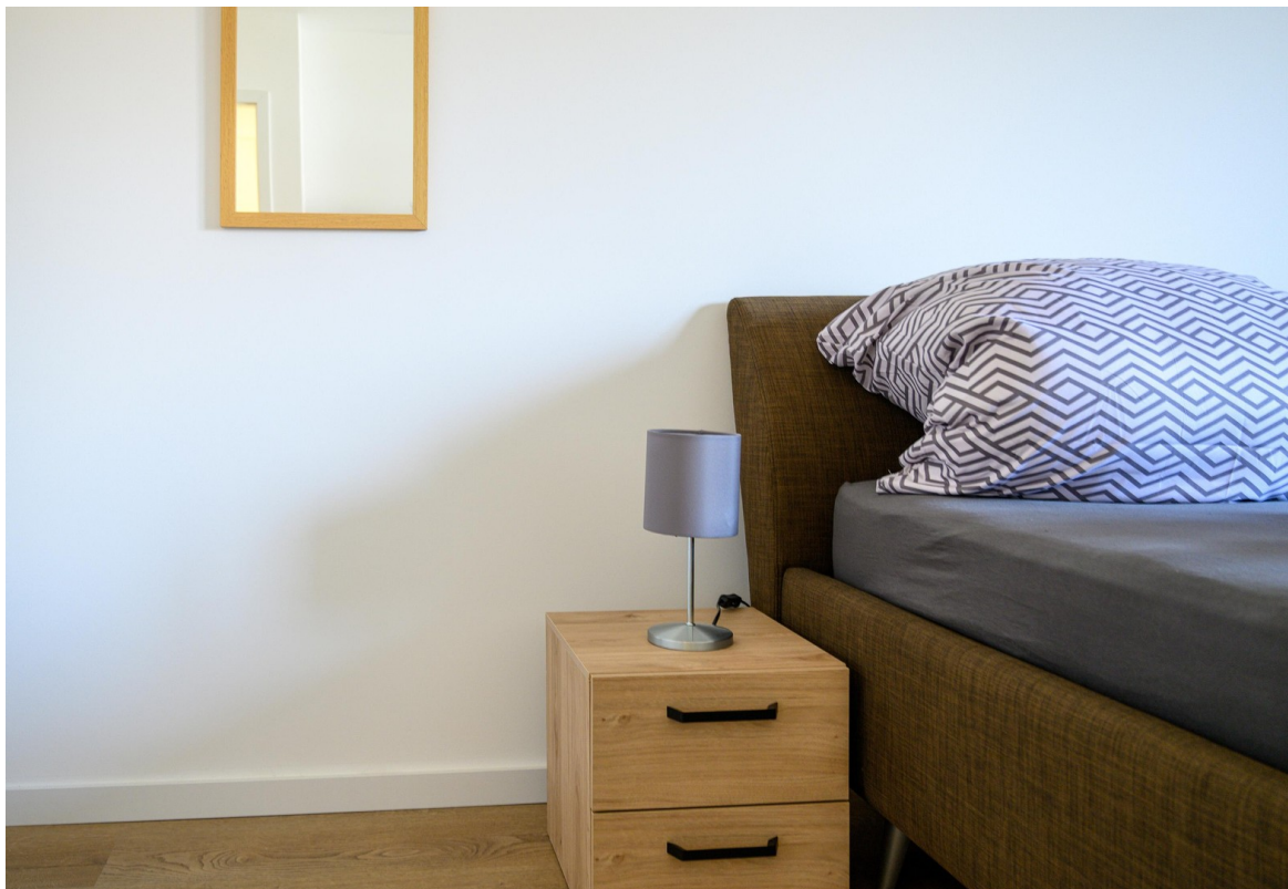
Schlafzimmer - Ansicht #5