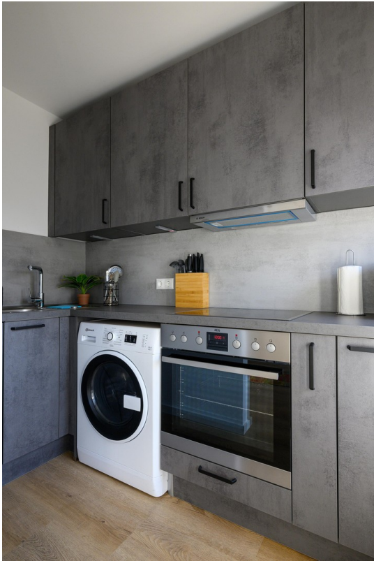
Küche - Ansicht #1