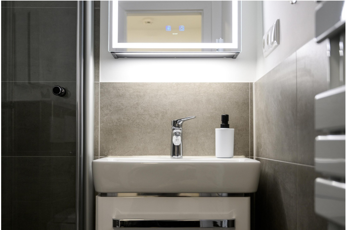
Badezimmer - Ansicht #2