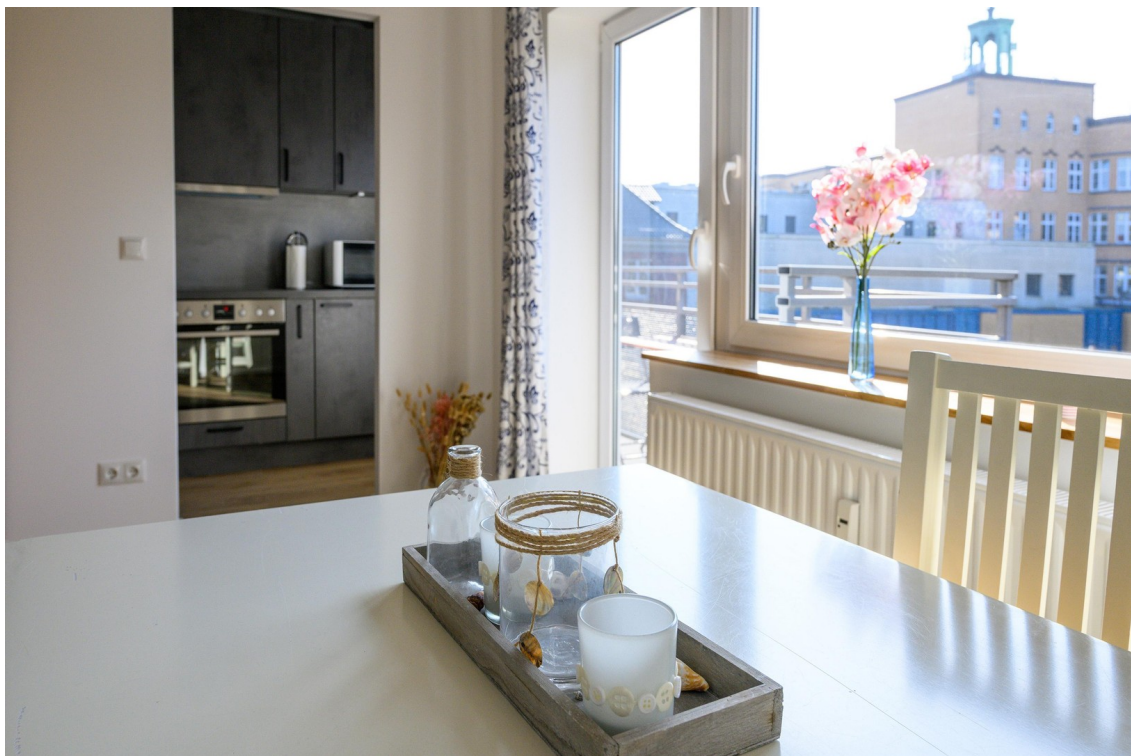
Wohnzimmer - Ansicht #8