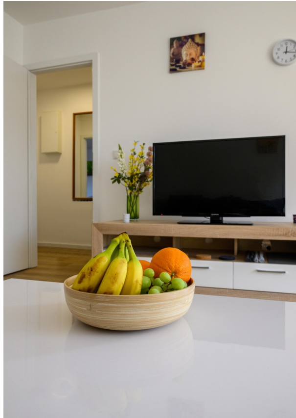
Wohnzimmer - Ansicht #7