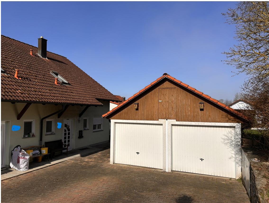
Eingang DHH mit Doppelgarage