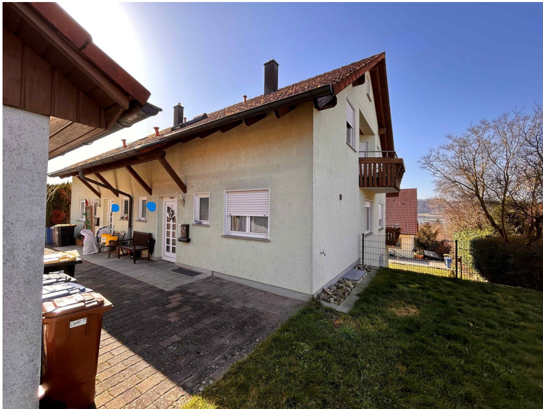
Eingang DHH mit Garten