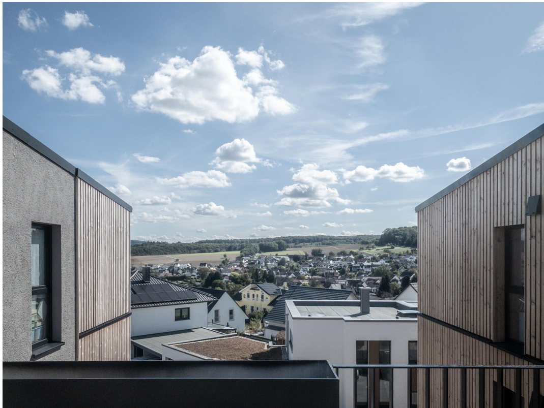
Blick über Bermbach DG