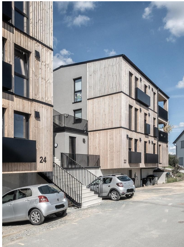
Haus 22 von der Straße aus