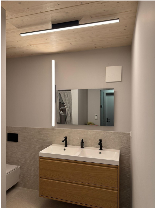
Beispielbad Haus 22