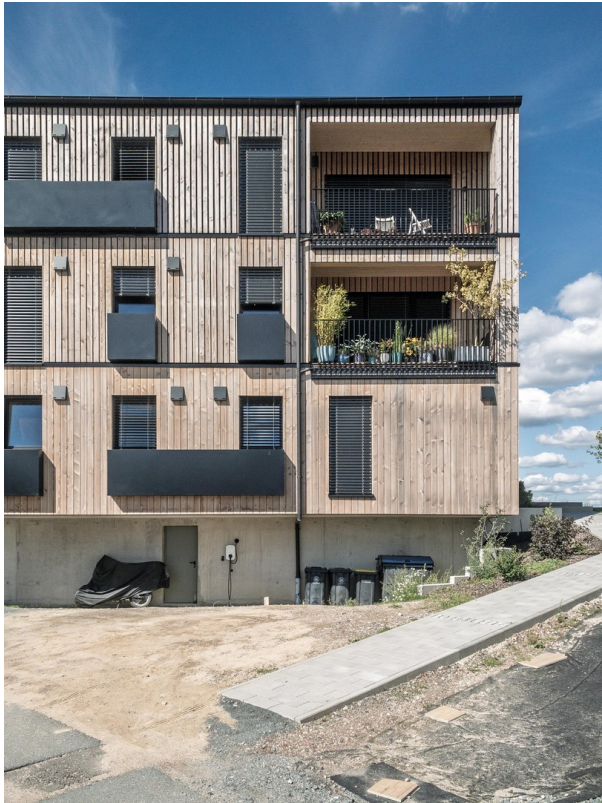
Ansicht Fassade Haus 22