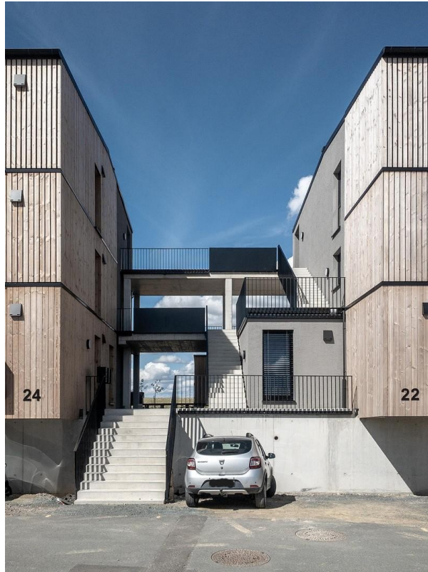
Treppenanlage + Gem.balkone