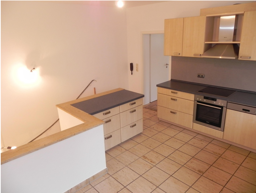
Küche zu Wohnzimmer