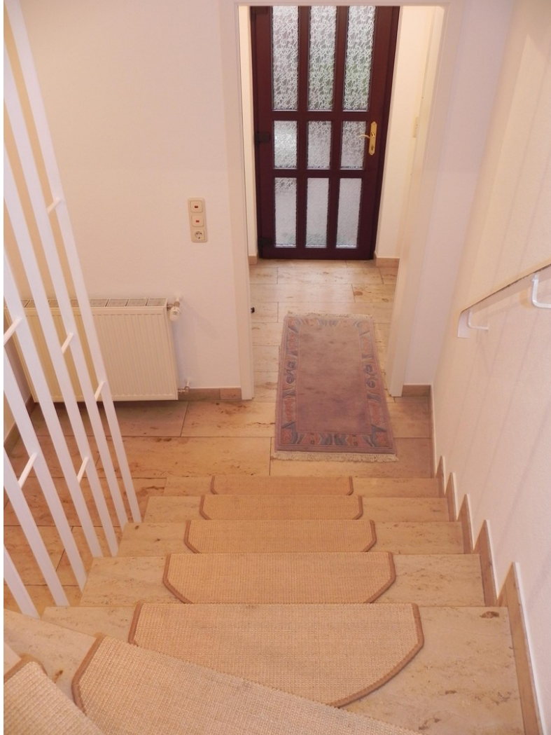
Treppenabgang Ausgang Diele