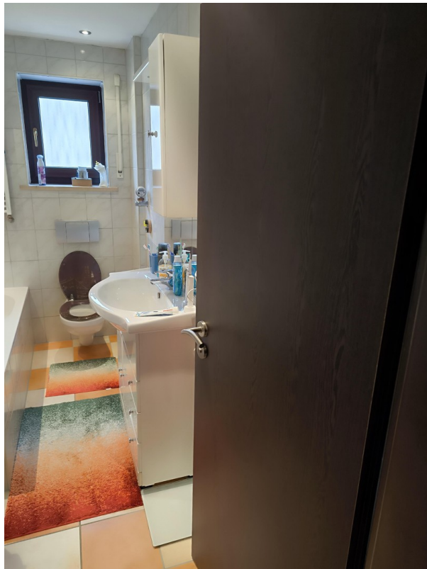
Badezimmer - Eingang