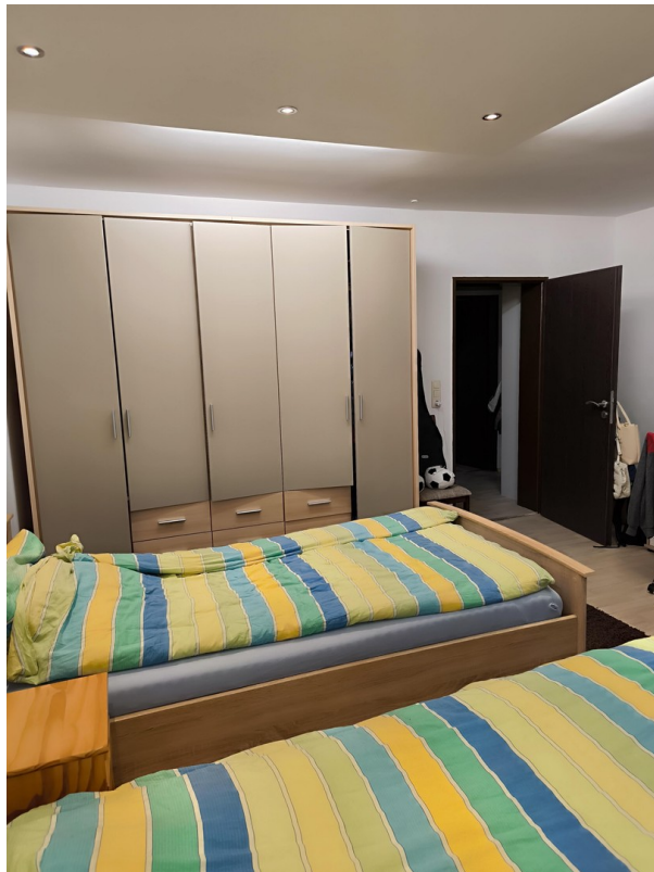
Kinderzimmer - Sicht #3