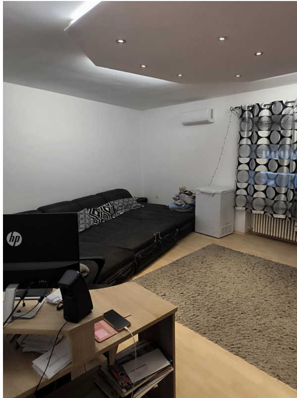
Wohnzimmer - Sicht #1