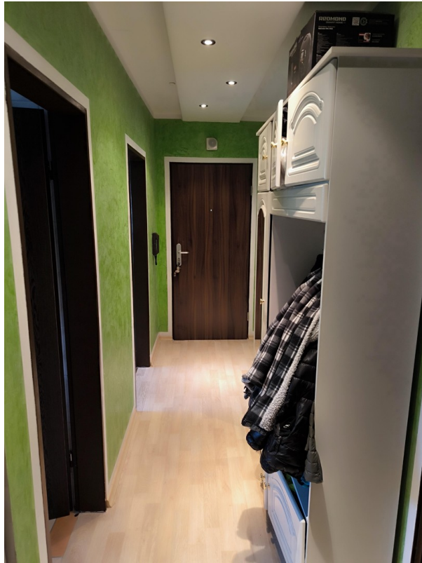
Flur - Sicht #2