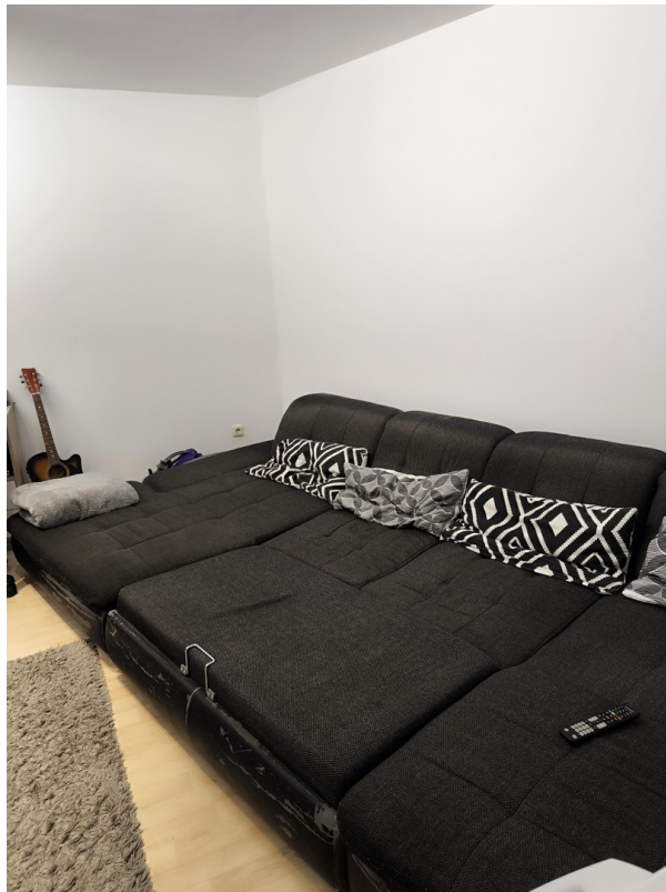
Wohnzimmer - Sicht #2