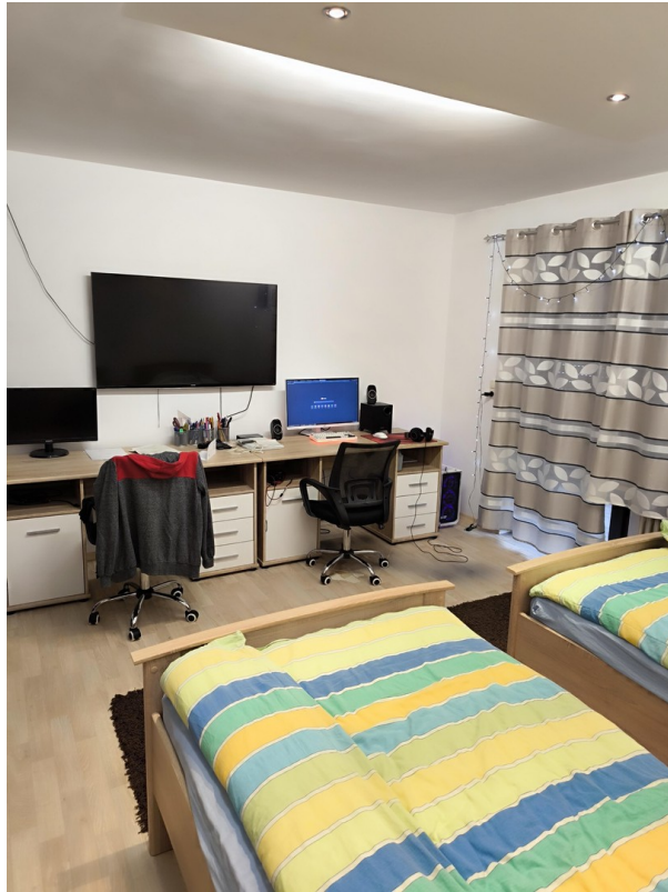
Kinderzimmer - Sicht #2