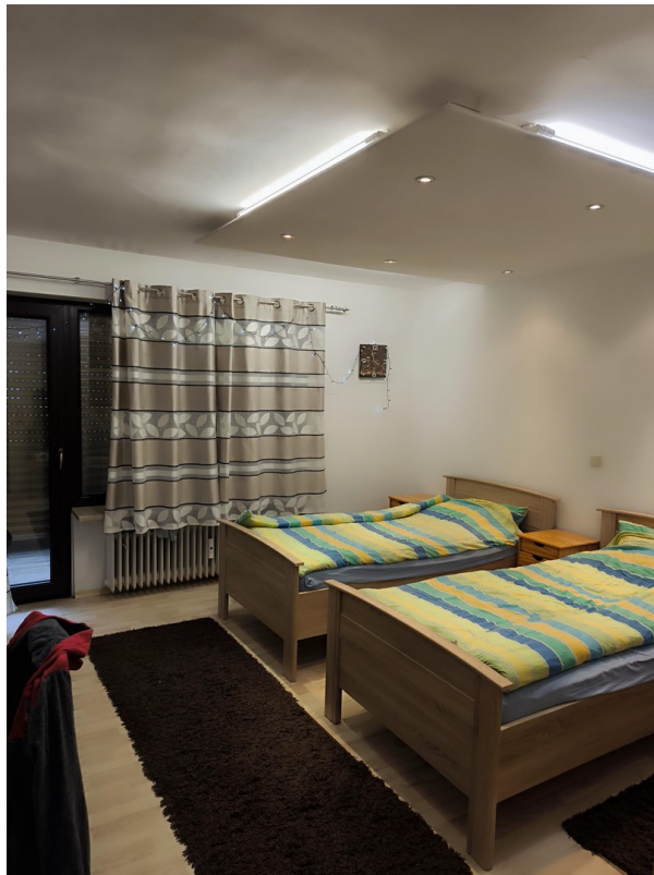
Kinderzimmer - Sicht #1