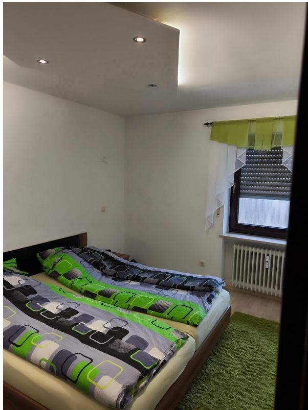
Schlafzimmer - Eingang