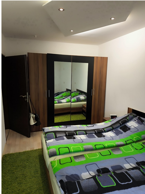
Schlafzimmer - Sicht #1