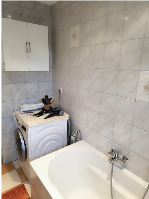
Badezimmer - Sicht #1