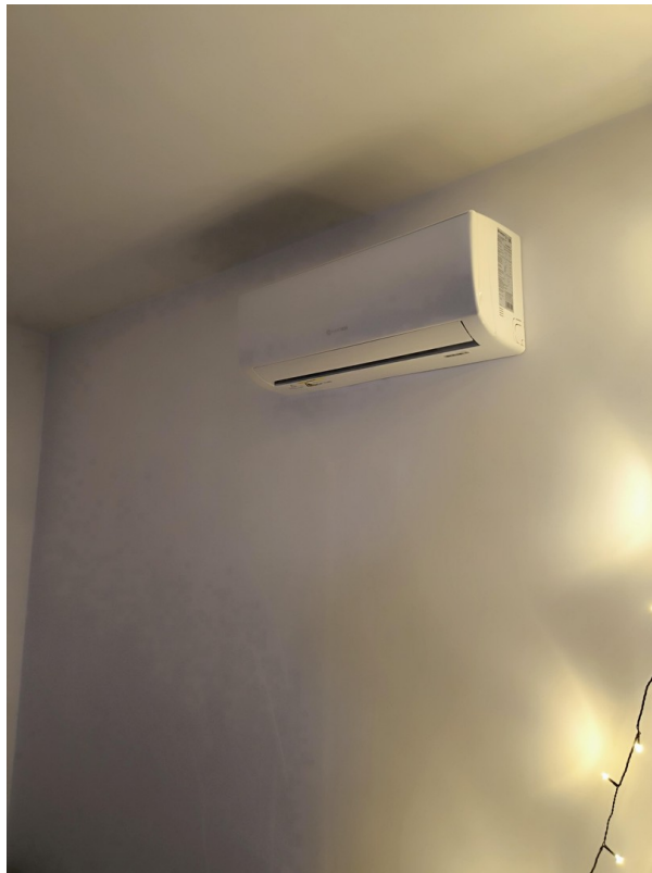
Wohnzimmer - Split-Klimaanlage