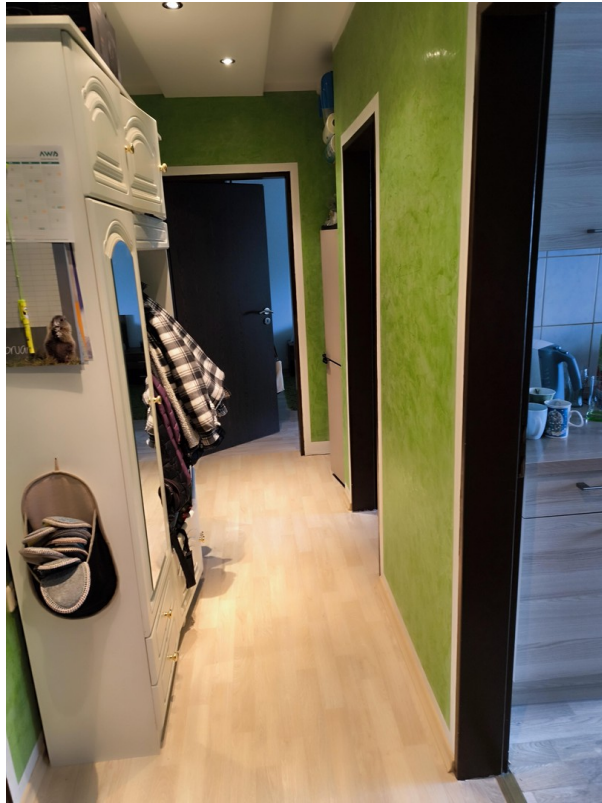
Flur - Sicht #1