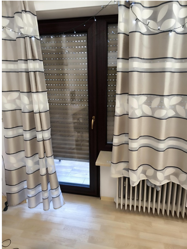
Kinderzimmer - Balkonzugang