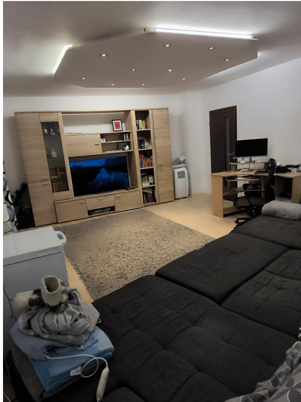
Wohnzimmer - Sicht #3