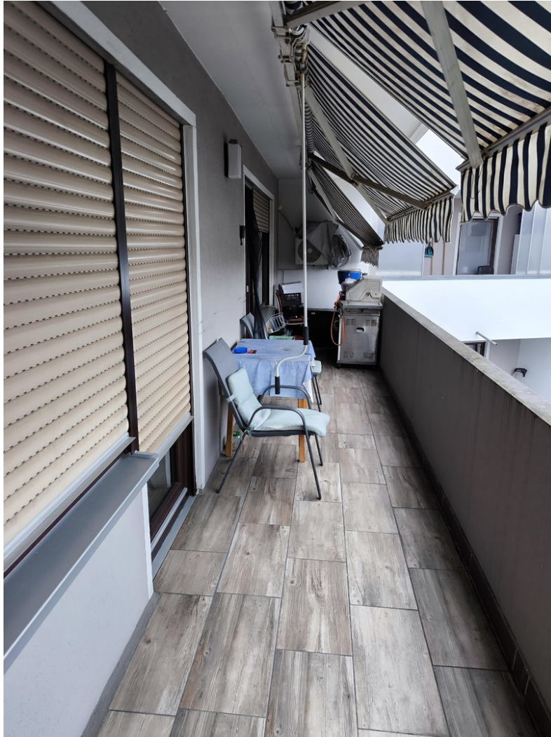
Balkon - Sicht #2