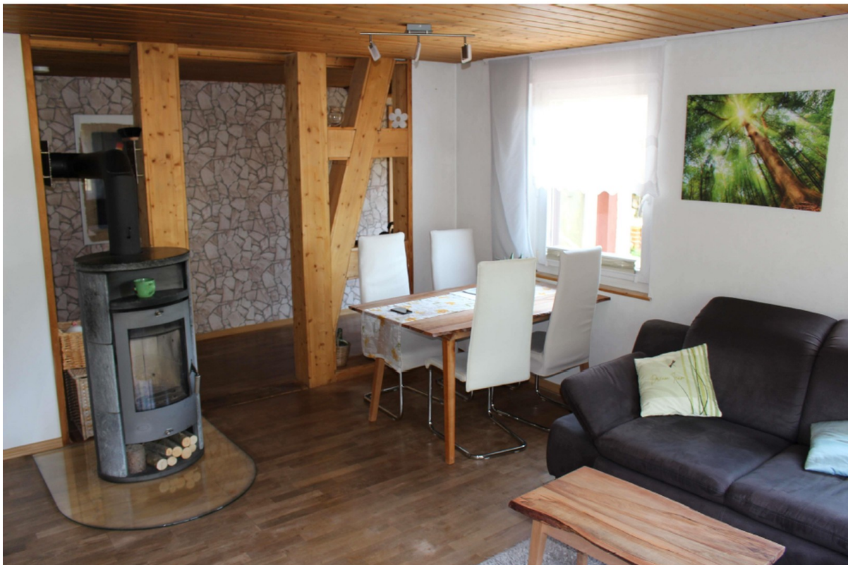
Essbereich im Wohnzimmer