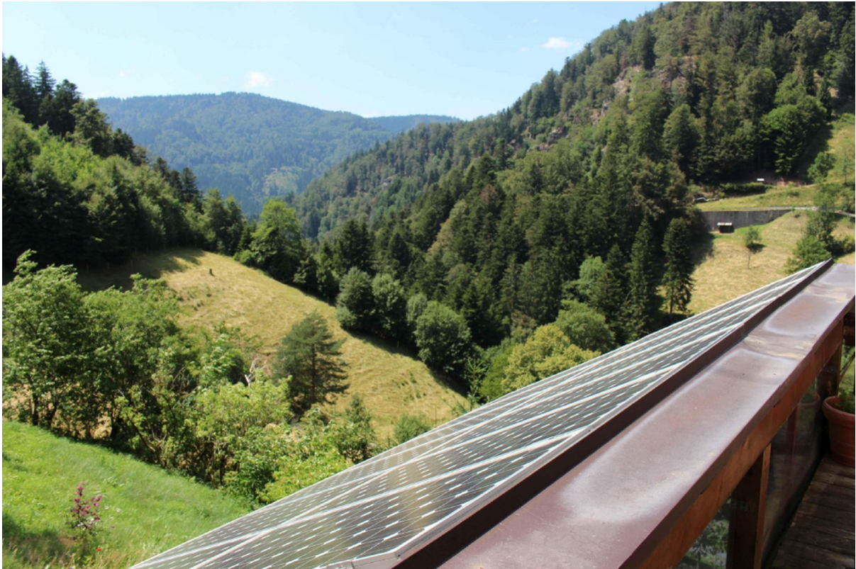
Blick auf die umliegende Natur