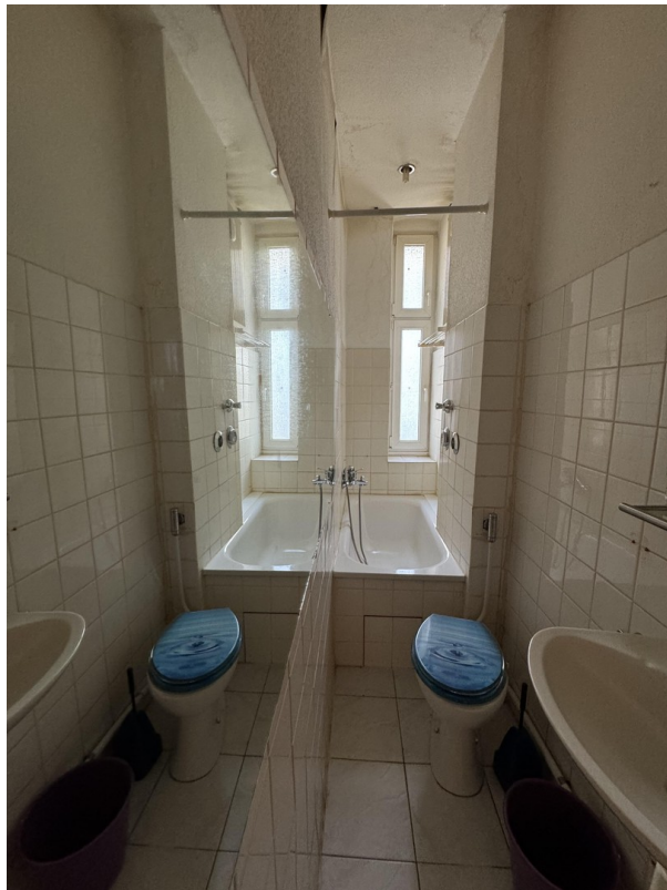
Badezimmer mit Tageslicht