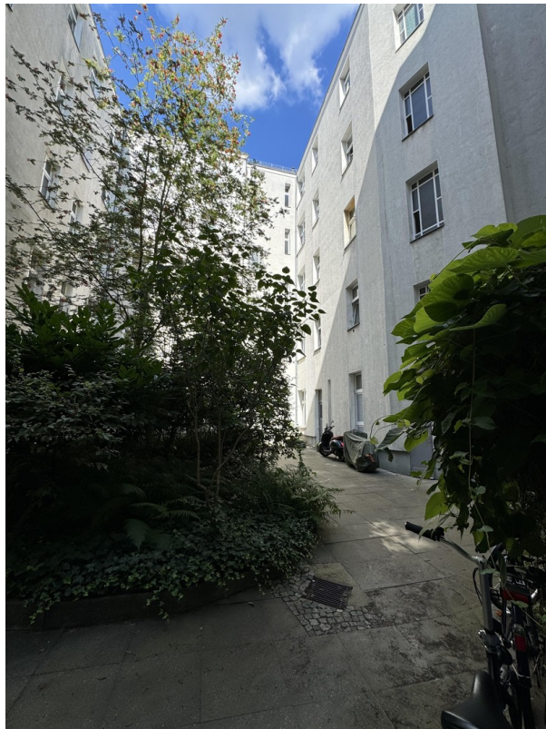
Innenhof (ruhige Lage)