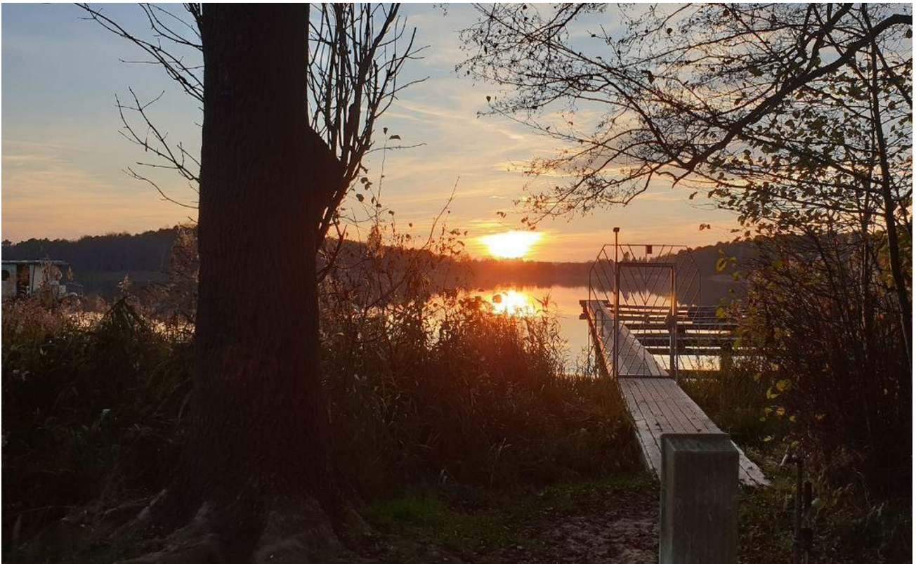
Sonnenuntergang am Steg