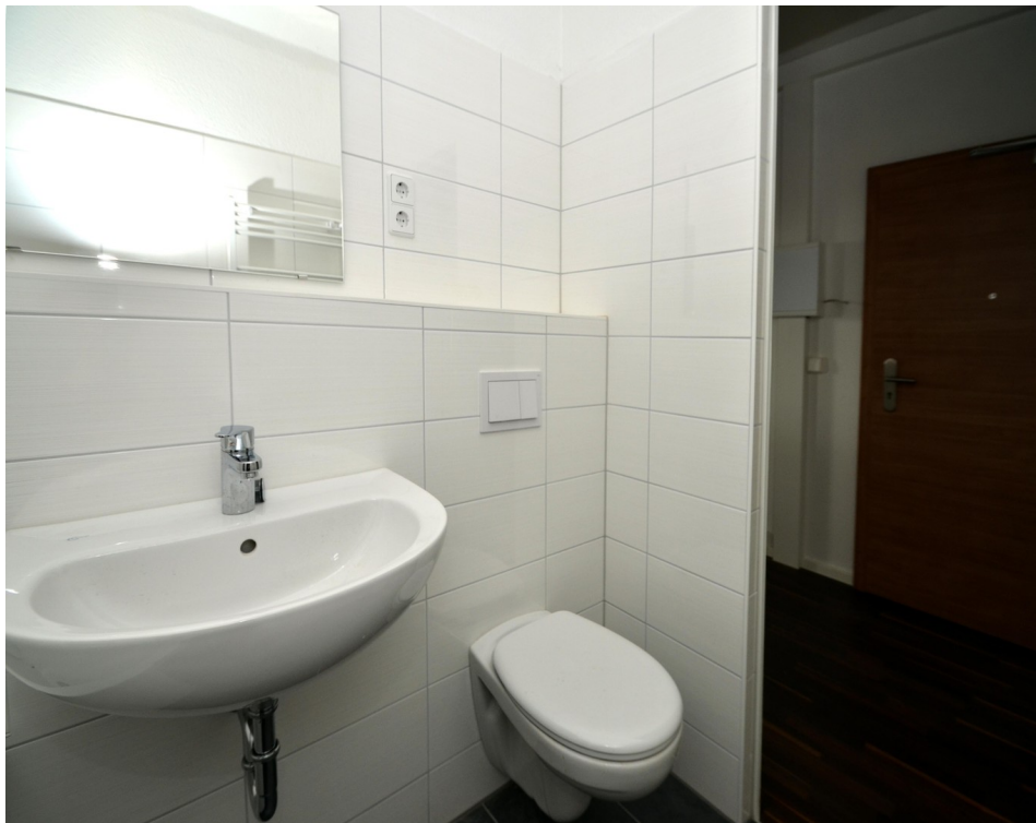
Bad und Flur