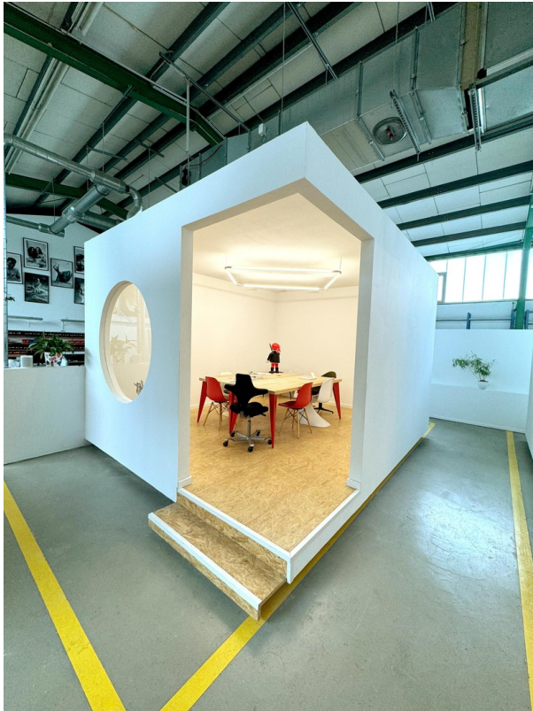
Konferenzraum mit Ausstattung