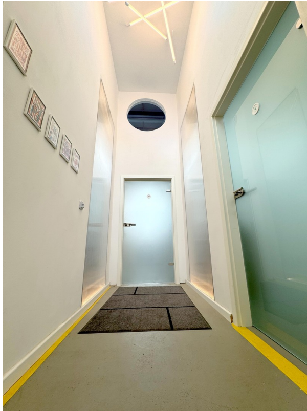
Heller & moderner Eingang