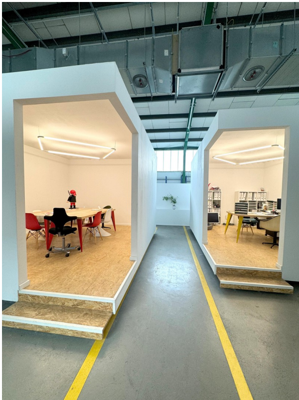
Voll ausgestatteter Meetinraum