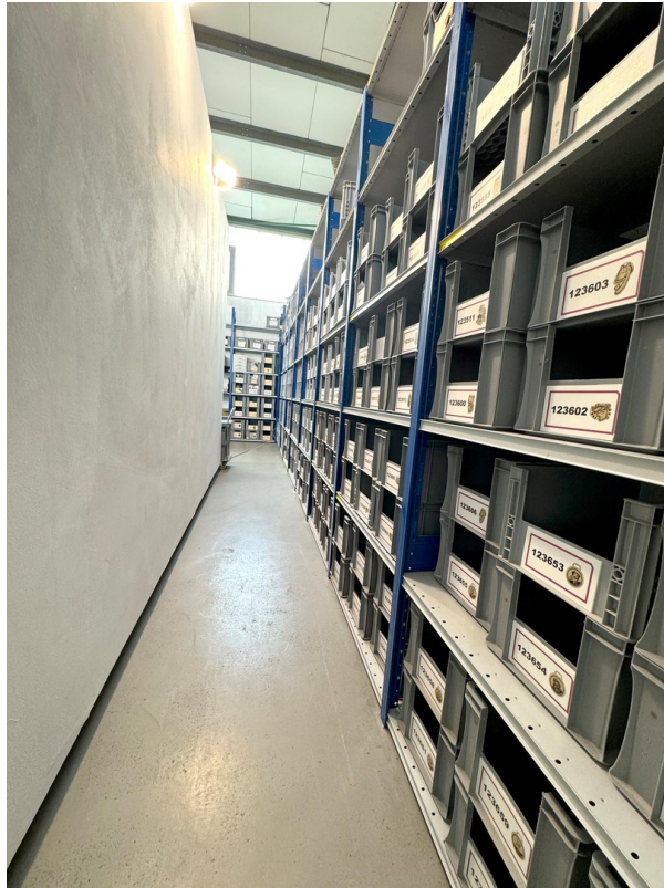
Vielseitig nutzbare Lastregale