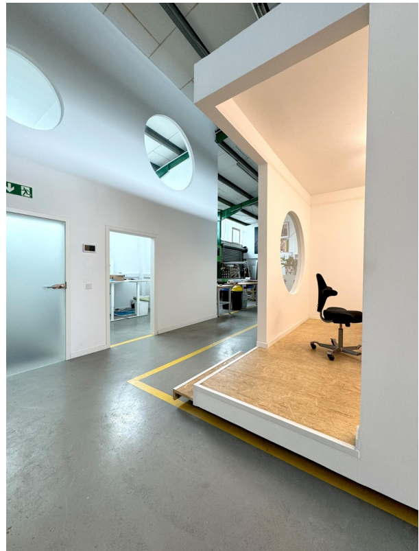
Geräumige, helle Gewerbefläche