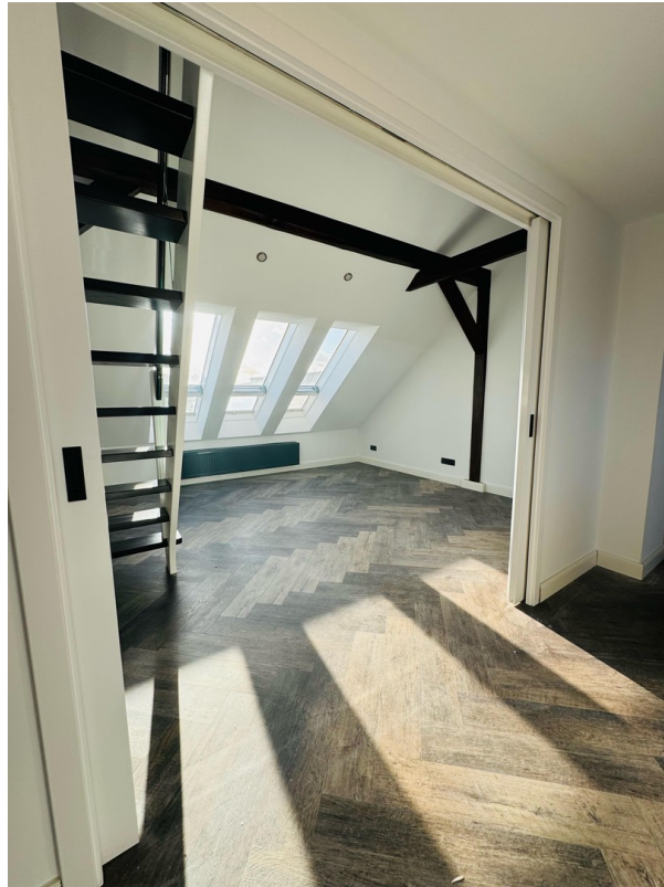
Zimmer mit Zugang Spitzboden