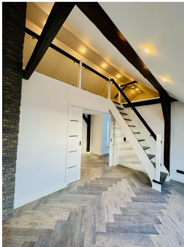
modern ausgebauter Spitzboden