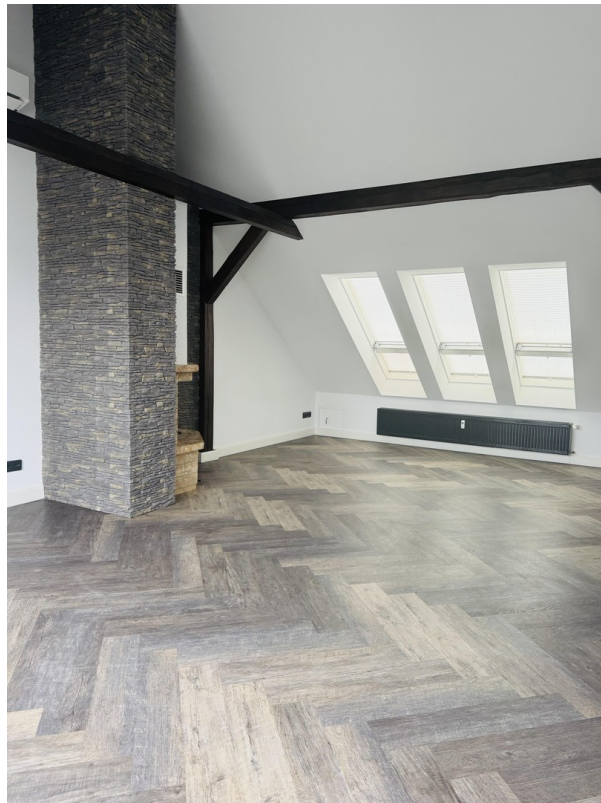
Wohnzimmer mit Klimaanlage