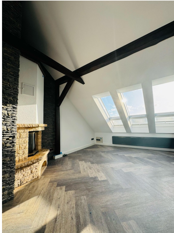
helles Wohnzimmer mit Kamin