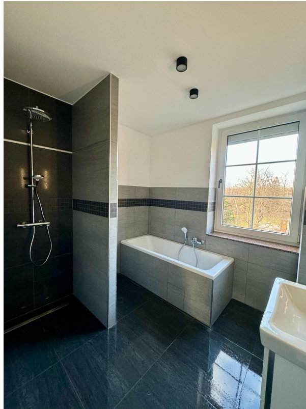
Familienbad mit WellnessDusche