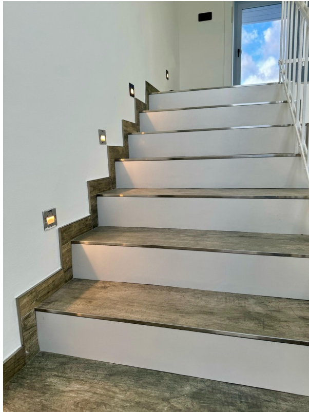
Treppe mit LED-Spots