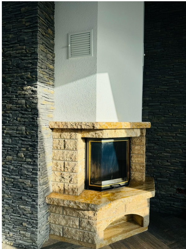
Kamin im Wohnzimmer