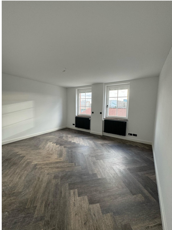
Schlafzimmer 1 UG