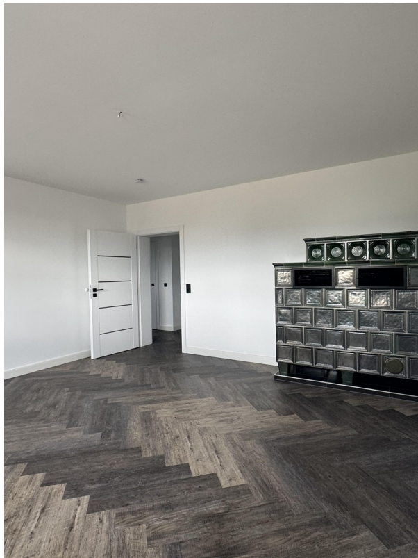
Schlafzimmer 2 UG mit Kamin