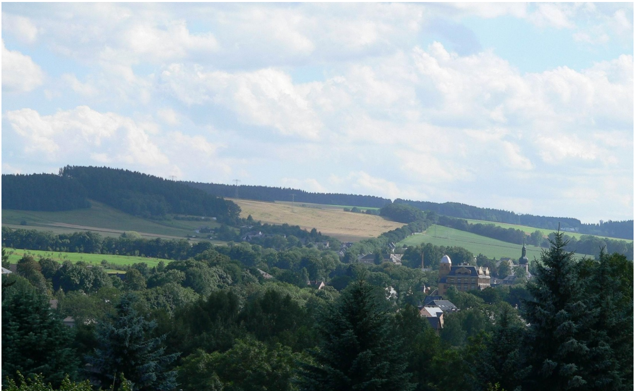
Blick vom OG zum Stadtzentrum