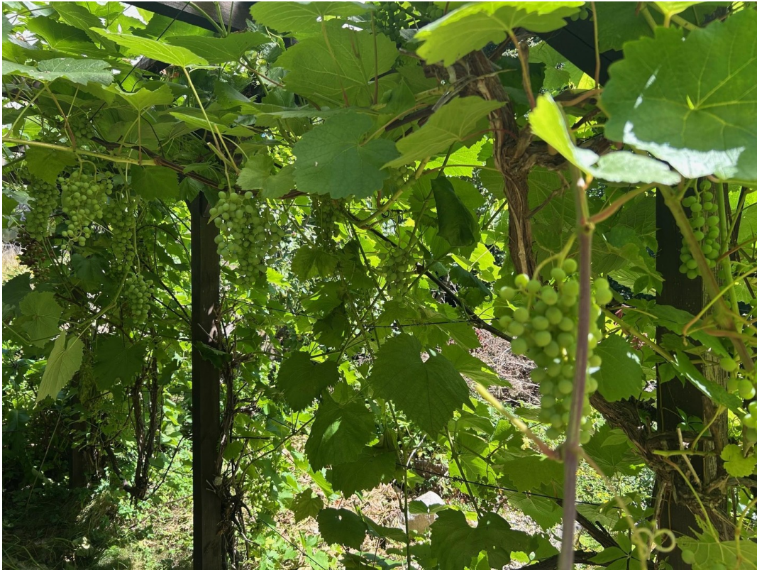
Garten mit div. Obstgehölzen