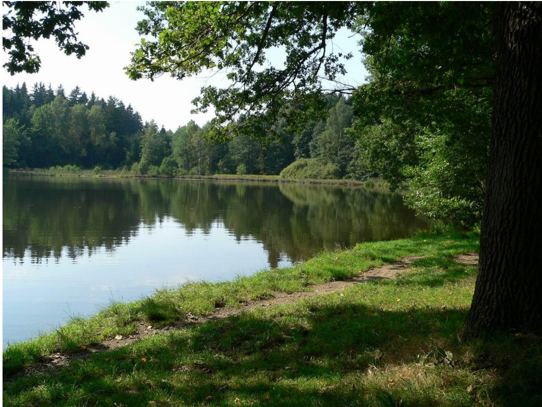
15min Fussweg zum Teich