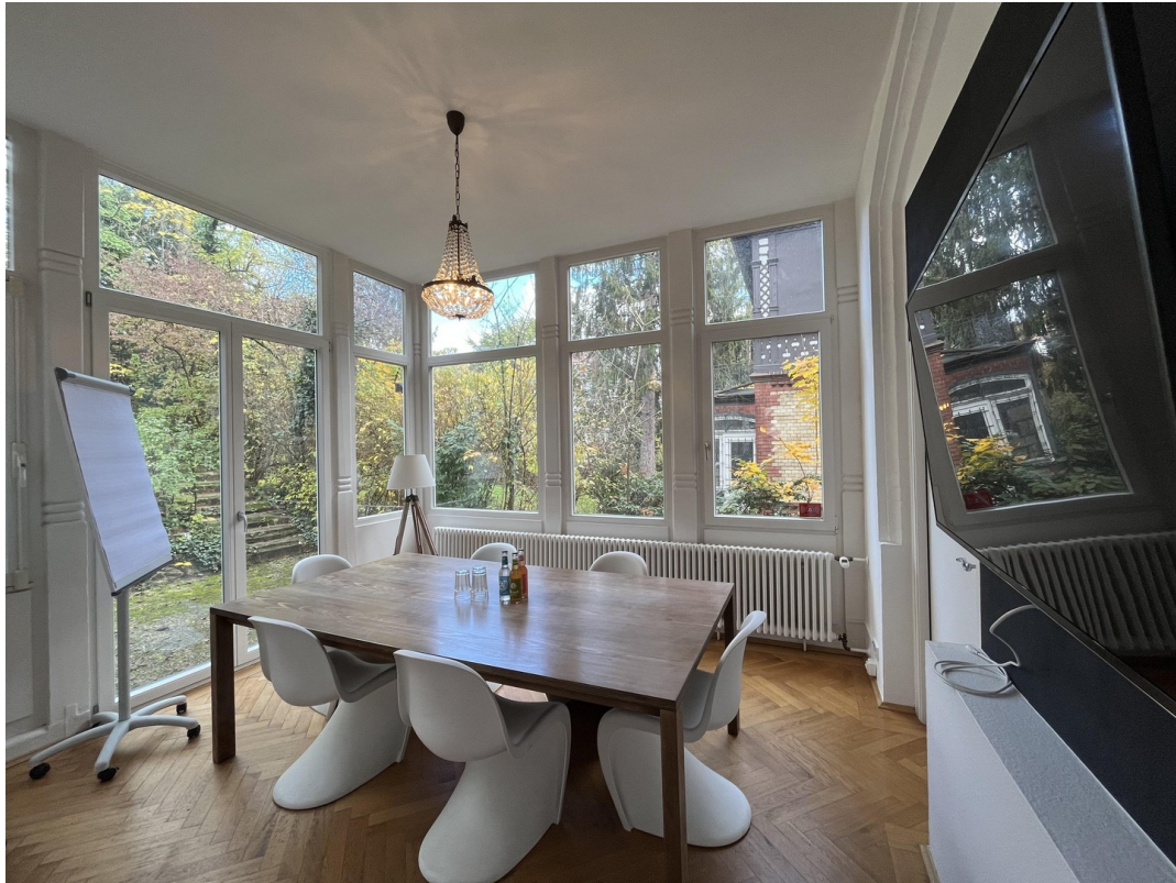
Meetingraum 2 "Wintergarten"