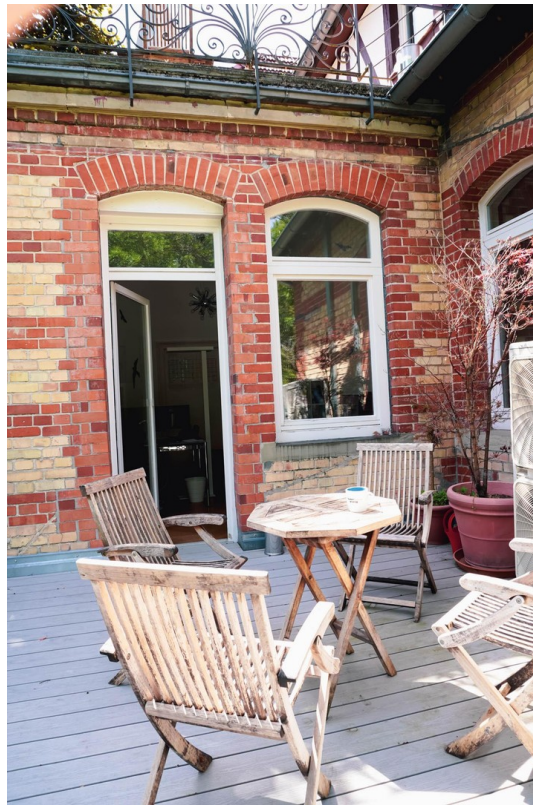
Dein eigener Balkon