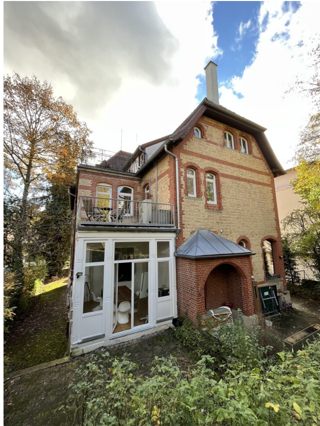
Dein eigener Balkon