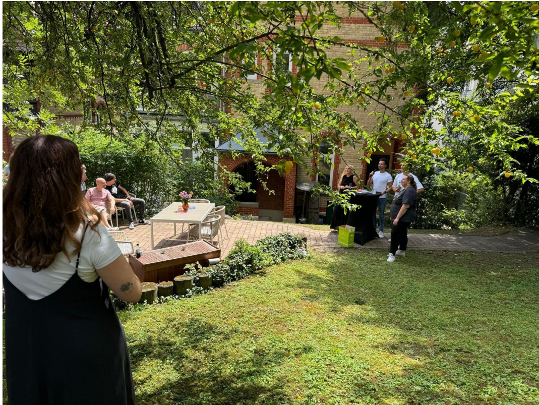
Gemeinsames Grillen im Garten