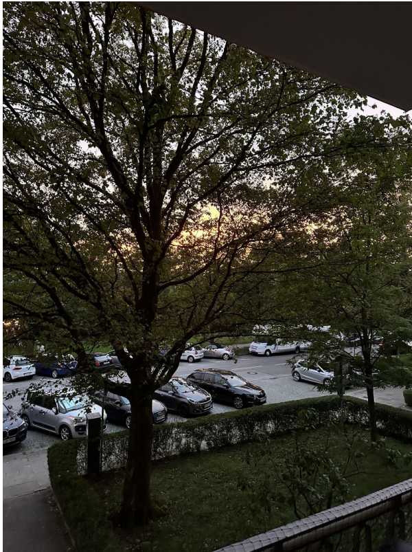
Blick aus Wohnzimmer