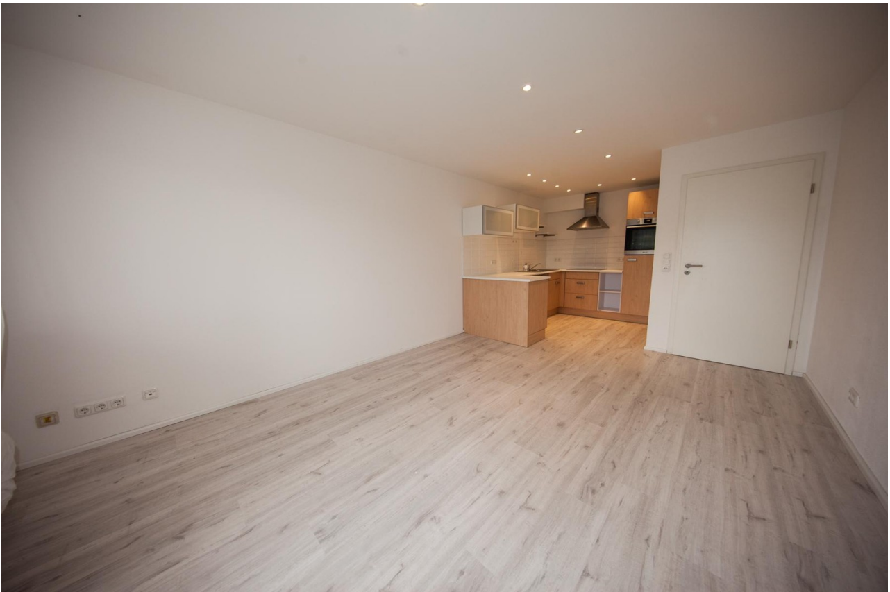
Wohnzimmer - Blick auf Küche