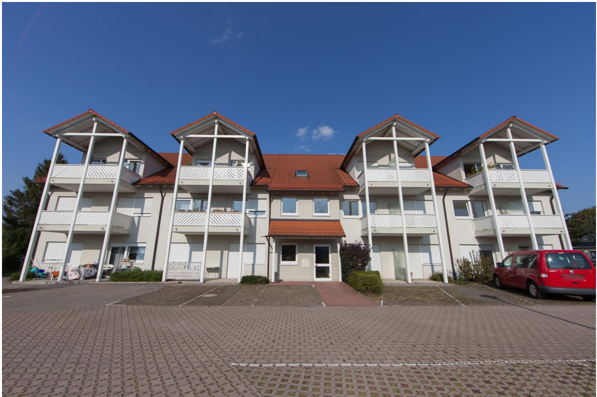
Hausansicht - vom Parkplatz