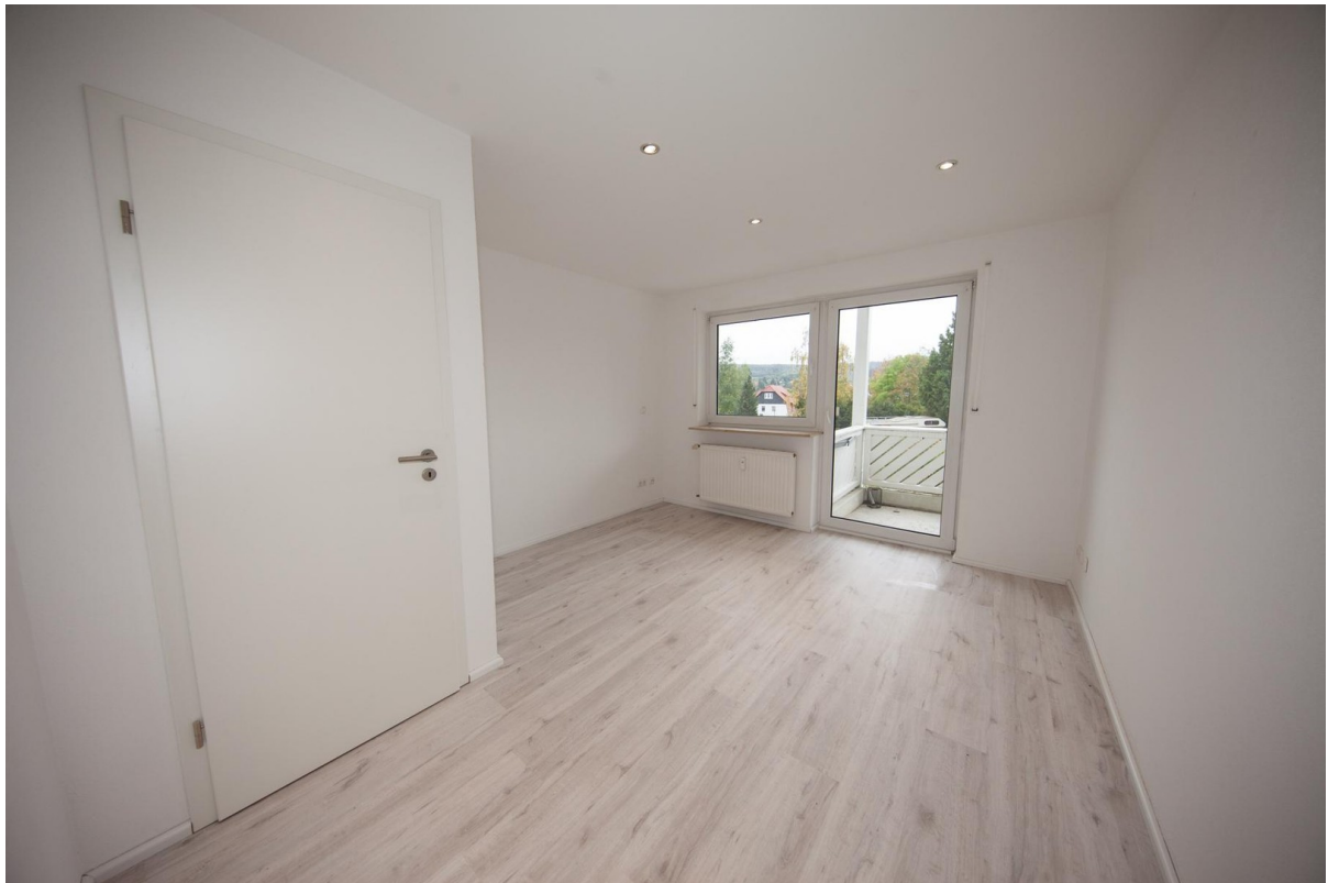
Schlafzimmer - Blick Balkon